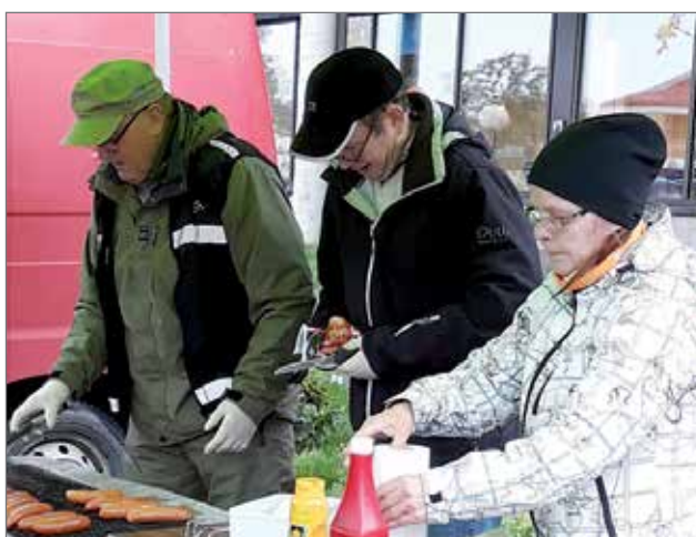
Yleisölle tarjottiin grillimakkaraita ja kahvia.