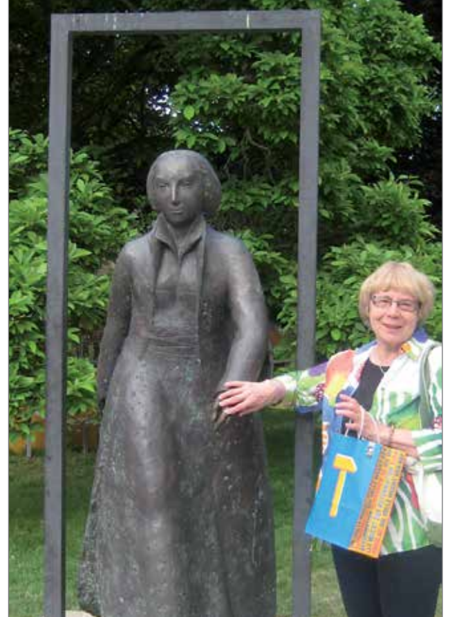
Kirjoittaja tervehtimässä kiireistä Katarina von Bora.

Turisti voi ostaa Luther-nuudeleita, -keksejä, -lei-