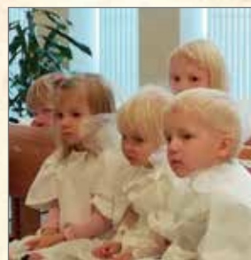
Osa lapsista oli mikkelinpäivän teeman mukaisesti pukeutunut enkeliksi.