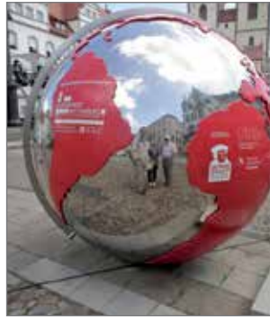
Reformaatio globalisoitui. Kuvassa turistien selfie Wittenbergin raatihuoneen torilla.

markkinatunnelmaa sekä kansanpukuihin ja vanhoihin vaatteisiin sonnustuneita juhliloita. Pääkadun varrella feikki-Luther Katarinansa kanssa otti vastaan ammattikuntien ja järjestöjen kulkueita. Lapsia oli paljon ja vilskelkoinen.