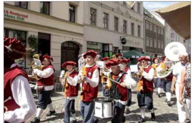
Juhlariemua Wittenbergin pääkadulla.