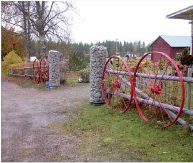
Kivikorituotteiden kestoikä on käytettävistä materiaaleista riippuen jopa kymmeniä vuosia ja ne sopivat hyvin myös luontomaisemaan.