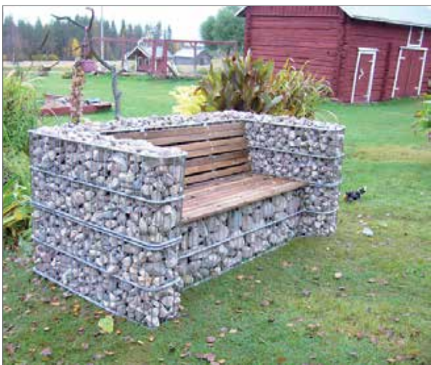
Kettumäki Oy:n tuotevalikoimaan kuuluu rakentamiseen tarkoitettujen maa-ainesten lisäksi erilaiset kivikorituotteet, kuvassa sohvakki nimetty piharakennelma.

- Sohvassa on painekylästä puusta valmistetut selkä- ja istuinosa, joten sohva kestää pitkään myös ajan hammasta.