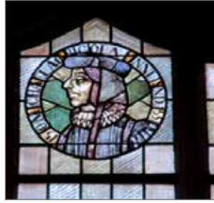
Mikael Agricolan muistoikuna Linnankirkossa.

Luther-kaupunkien epävirallinen pääkaupunki on luonnollisesti Wittenberg. Viime kesäkuussa siellä juhlittiin Lutherin häitä (Luthers Hochzeit). Oli