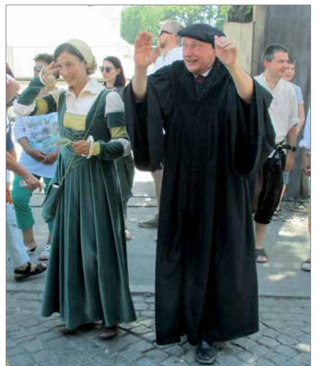
"Martin ja Katharina" - Lutherin häitä juhliitaan.

pää ja -hatun sekä nauttia Luther-jäätelöä tai siemaila Luther-olutta. Itse hankin Luther-ruusuaiheisen jääkaappimagneetin sekä kuvakirjan reformaattorin sauduista.