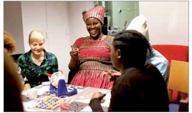
Kulttuurikahvilan ohjelmistossa muistipelit, bingo ja muut pelit ovat kestoosuusikkejä.