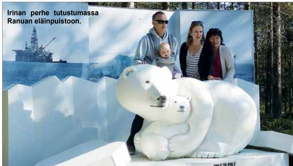
Irinan perhe tutustumassa Ranuan eläinpuistoon.