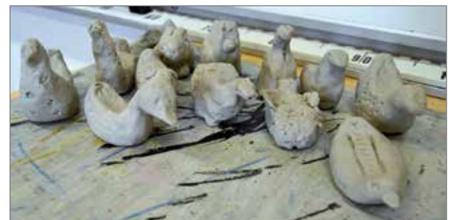
Suomalais-ugrilaista kulttuuria edusti kukkopilli-työpaja.