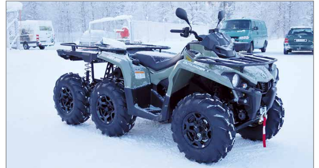
Pörinäpäivien uutuuksena oli 6-pyöräinen mönkijä.

Esittelyssä oli myös uutuuksena BRP:n Rovaniemen tehtaalla suunniteltu, raskaaseen työhön kehitelty ja valmistettu 450-moottorilla oleva 6-pyöräinen mönkijä. STK