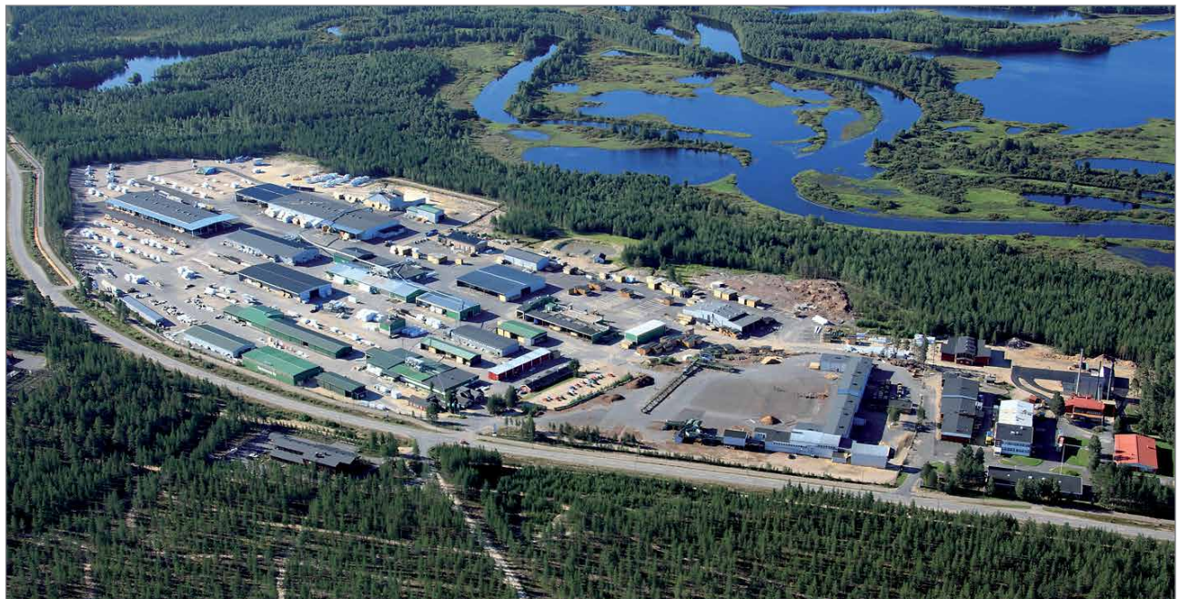
Kontion hirsitalo- ja huvilavalmistustehdas on laajentunut vuosien varrella Ranua/Rovaniemelle menevän tien varteen. Ensi maanantaina avataan virallisesti kuuden miljoonan euron tuotantolinjarakennus.