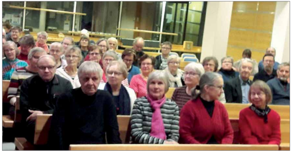
Muistikahvilan tämän vuoden ensimmäinen kokoontuminen yllätti suosiollaan, tilaisuuteen tuli 130 osallistujaa.

halutessaan teettää itselleen edunvalvontavaltuut-