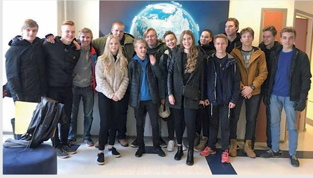
Hirsikampuksen ilmaulinjalla opiskelee 15 nuorta eri puolilta Suomea.