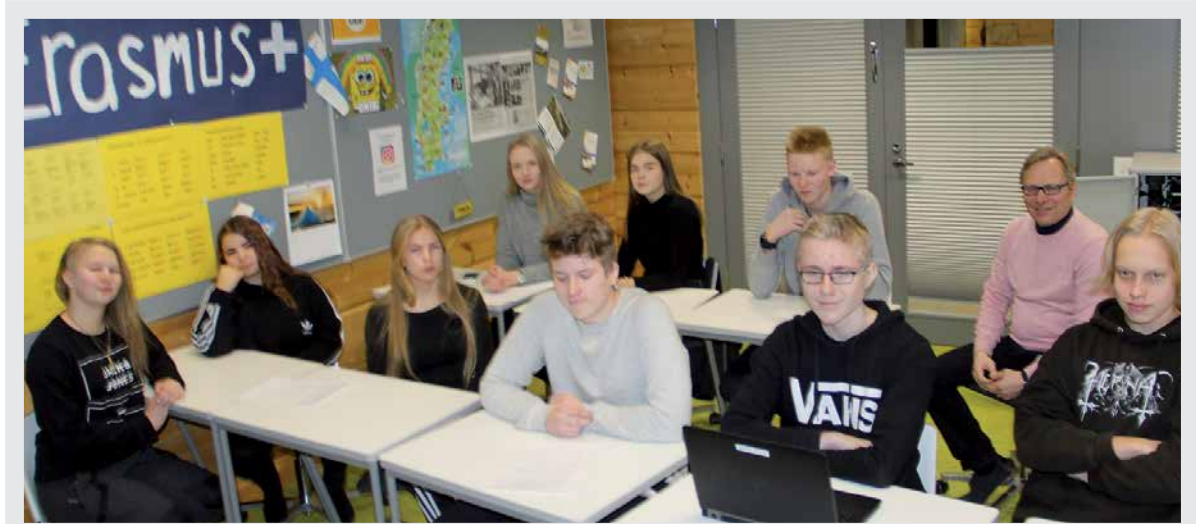
Messujen järjestäminen on vaatinut lukuisia neuvotteluja ja tuumauksia. Marraskuun oppilaat koontuivat messulehtiliitteen suunnittelupalaveriin.