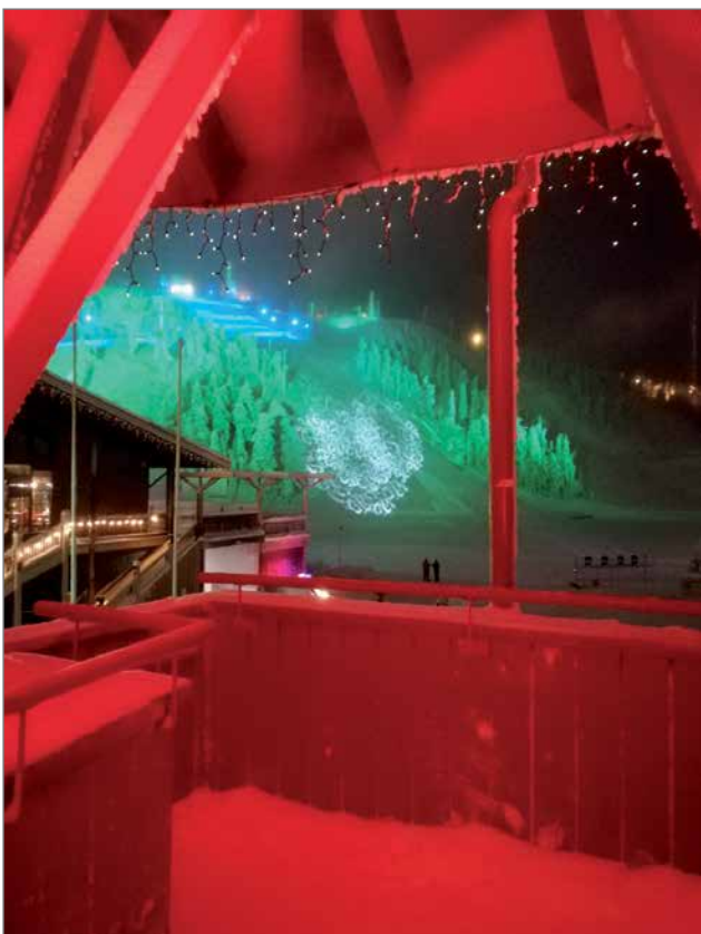
Ruka kylpi väreissä Nordic Noir festivaalin aikaan.

pohjoismaisia rikoskirjailijoita ja heidän lukijoitaan Rukan lumiseen maisemaan keskustelemaan dekkareista. Nordic Noir (vapaasti käännettynä pohjoismainen musta) on kansainvä-