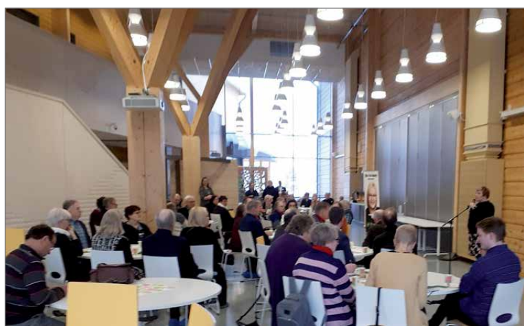
Ministeri Annika Saarikkoa sekä kansanedustajaehdokkaita oli Hirsikampukselle saapunut kuulemaan runsaasti väkeä.