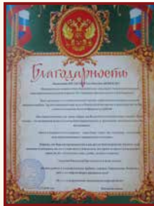
Pitkäaikainen yhteistyö Karjalan koulujen kanssa on tuottanut monta hyvää hedelmää.

Toinen tunti oli yhdeksäsluokkalaisten. Joukossa oli muutama tuttu nuori. Olen aikaisemminkin ollut tämän luokan vieraana. Puhuin heille perheestä ja lapsista. – Muutama vuosi vielä, niin teillä on omia lapsia, joiden kanssa rakennatte omaa joulua. Hyvin kuuntelivat tar-