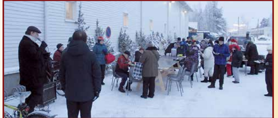
Joulupuuro-tapahtuma sai uuden muodon vuonna 2013, kun tilaisuus tuotiin ensin torille ja myöhemmin kauppaliikkeen edustalle.

veimme ruokapaketin pudasjärvisiin koteihin. 17 perhettä sai apua. Yhteistyötä olemme tehneet Lijokiseutu- ja Pudasjärvi-lehden kanssa. Jälkimmäinen sponsoroi 9x vuodesa lehden niille jäsenille, joilla ei ole nettiä. Lehti menee ympäri Suomea ja samalla Pudasjärvi tulee tutuksi. Myös Vienan Karjalassa Pudasjärvi on tullut monelle tutuksi.