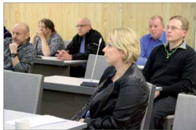
Pudasjärven Yrittäjät arvioitiin vuoden 2015 toiminnan perusteella parhaaksi paikallisyhdistykseksi omassa kokoluokassaan. Yhtenä perusteena oli hyvä yhteistyö kaupungin kanssa. Kuva viime marraskuussa kaupungintalossa yhteisesti järjestetystä hankintaillasta.