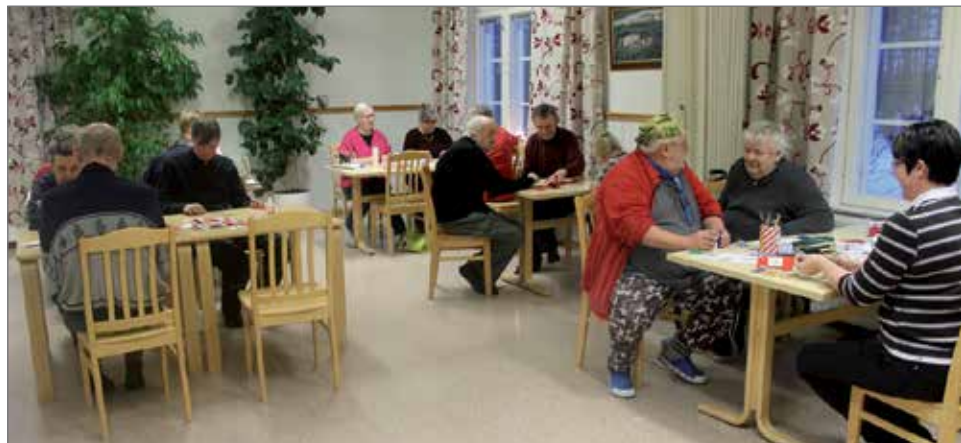
Metsälän virikepäivään joulukuussa 2013 saapui paikalle sekä Metsäläkodin asukkaita että kyläläisiä.