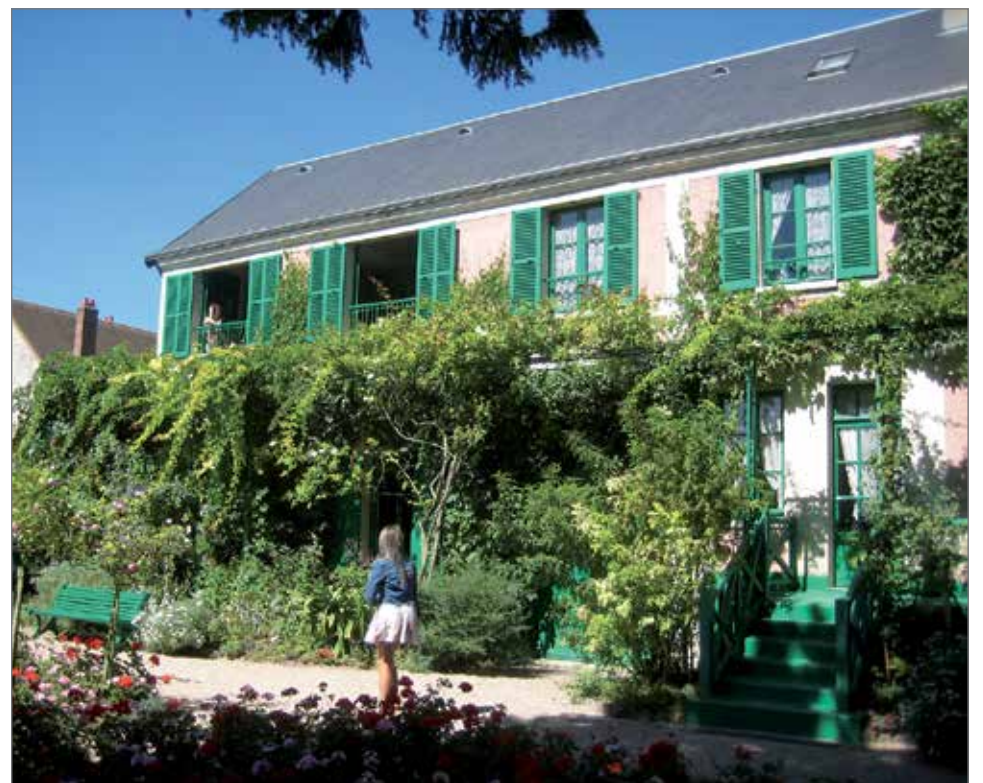
Claude Monet'n vaaleanpunainen talo Givernyssä.