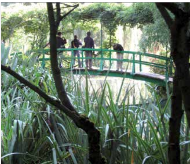
Kaarisilta kuin suoraan japanilaisesta puupiirroksista.