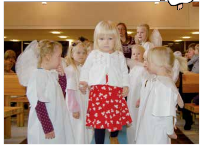
Turvallista oli kulkea enkelien viitoittamaa siltaa pitkin. Kuva vuodelta 2014 mikkelinpäivän perhemessuista.

Uuden oppiminen on tottu liittämään koulutusjärjestelmään, oppivelvollisuuteen ja sen jälkeiseen opiskeluun tulevaa ammat-