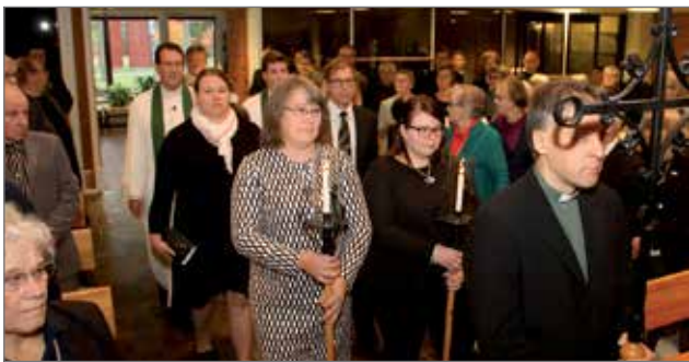
Piispa ja päivämessun avustajat saapuivat paikalle risti-saatossa.