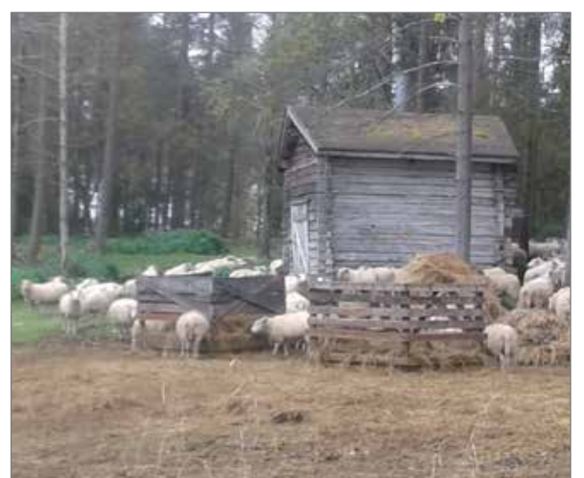
Kälkäjillä on lampaista, joihin oppilaat tykäsivät.