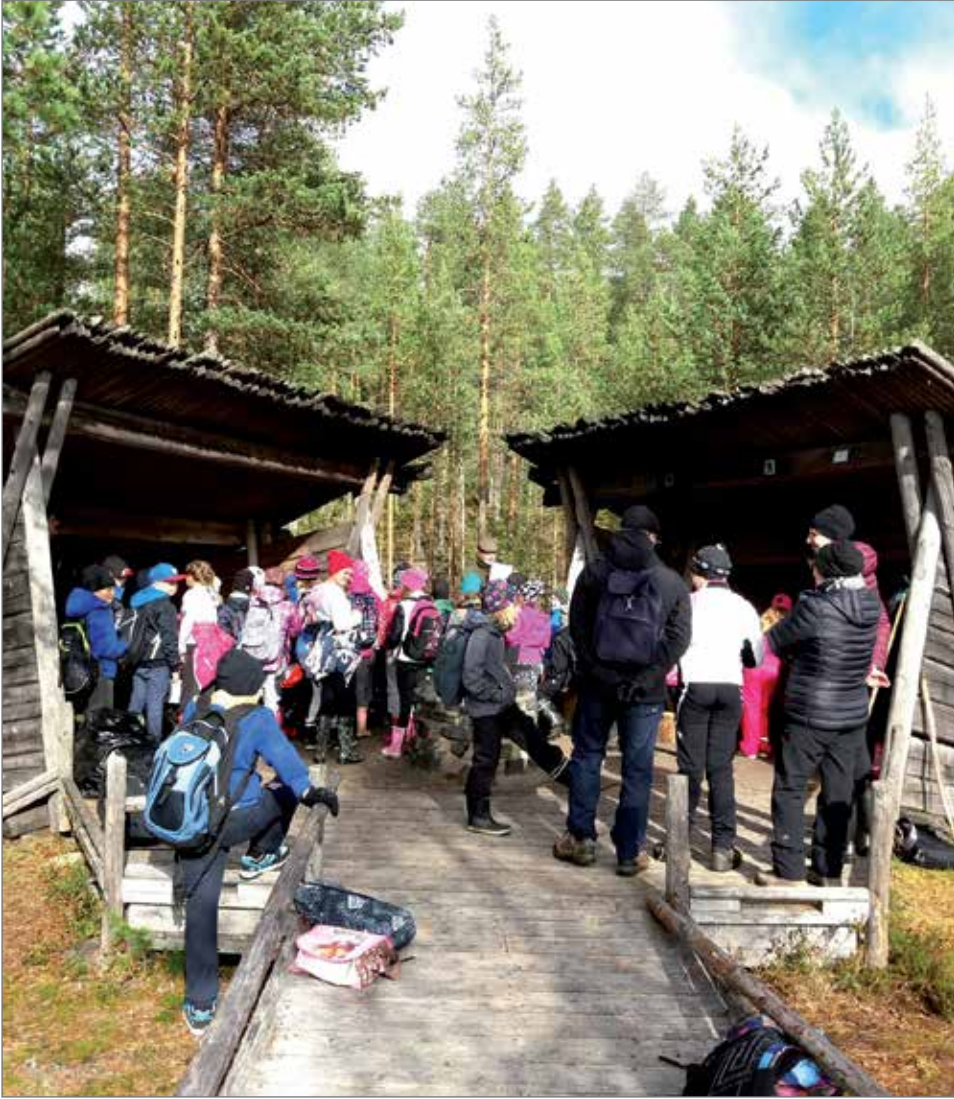
Kellarilammen luontopolun laavulla paistettiin makkaraa ja tutustuttiin harjujen, suolammen sekä suon historiaan.