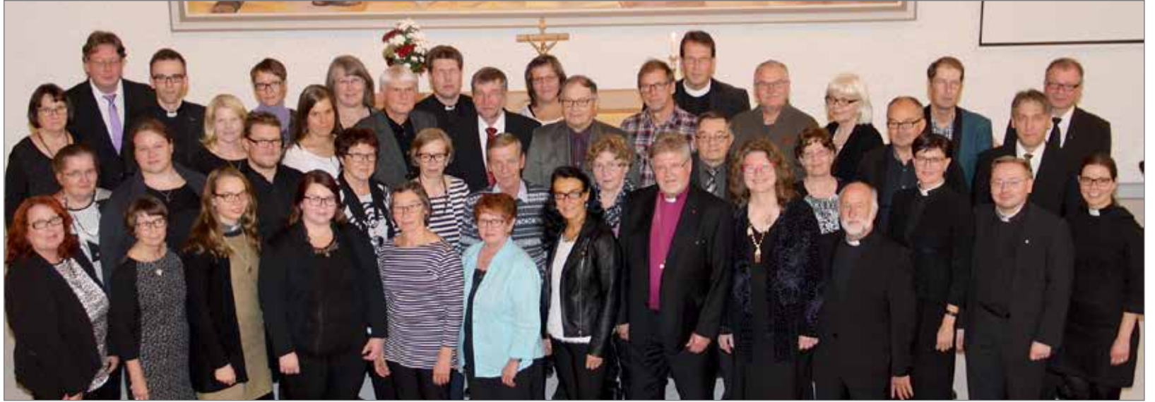
Piispa seurueineen sekä Pudasjärven seurakunnan työntekijät ja luottamushenkilöt kokoontuivat neuvottelutilaisuuden aluksi yhteiseen kuvaan perjantaina illansuussa.

Piispa Samuel Salmi korosti vierailunsa aikana, että sana "piispantarkastus" ei