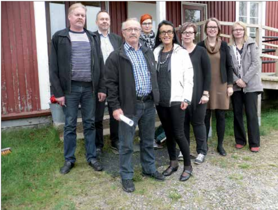
Elinvoimavaliokunnan jäseniä Jongun kylätalolla kokouksen jälkeen 21.9.2016

Kehittämiskoordinaattori esitteli kehittämistoimen talousarvion 2017 valmistelutilanteen. Haasteellisesta työllisyystilanteesta johtuen kehittämistoimen määrärahan tarve on työllistettävien palkkamäärärahoihin 190 000€, Unelmatehas käynnistämiseen 200 000€, viestintään 30 000€, sekä kyläasiamiehen palkkaamiseen 46 000€. Ammattitaitoisen asumisneuvojan palkkaami-