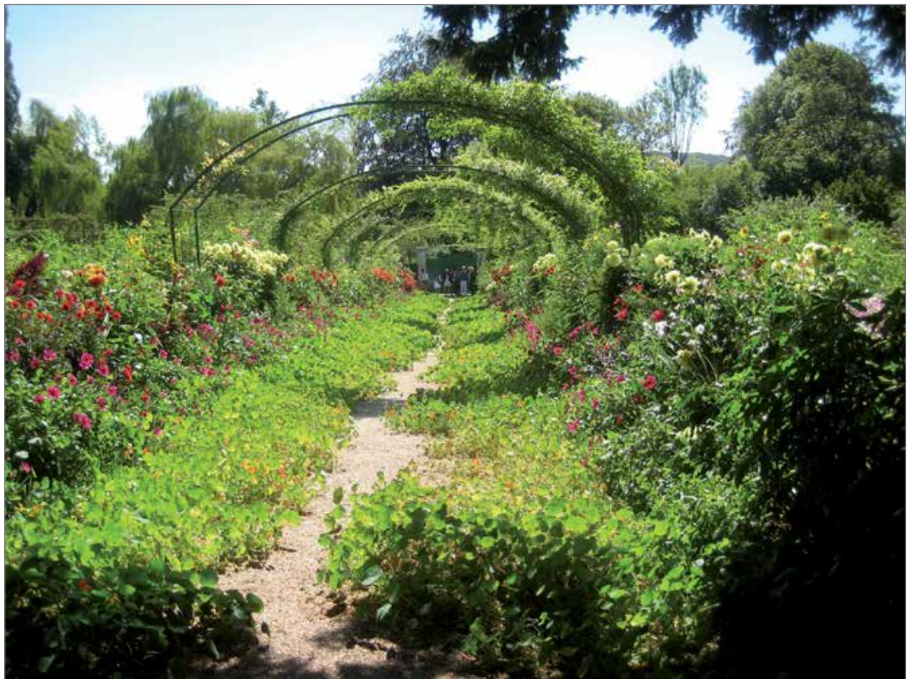
Grande Alléen krassikäytävä vie talon pääovelle.

Rutiköyhä Monet sai Givernyn talon, entisen siideripuristamon, kuitenkin vuokrattua, ja perhe muutti sinne toukokuussa 1883. Taiteilija