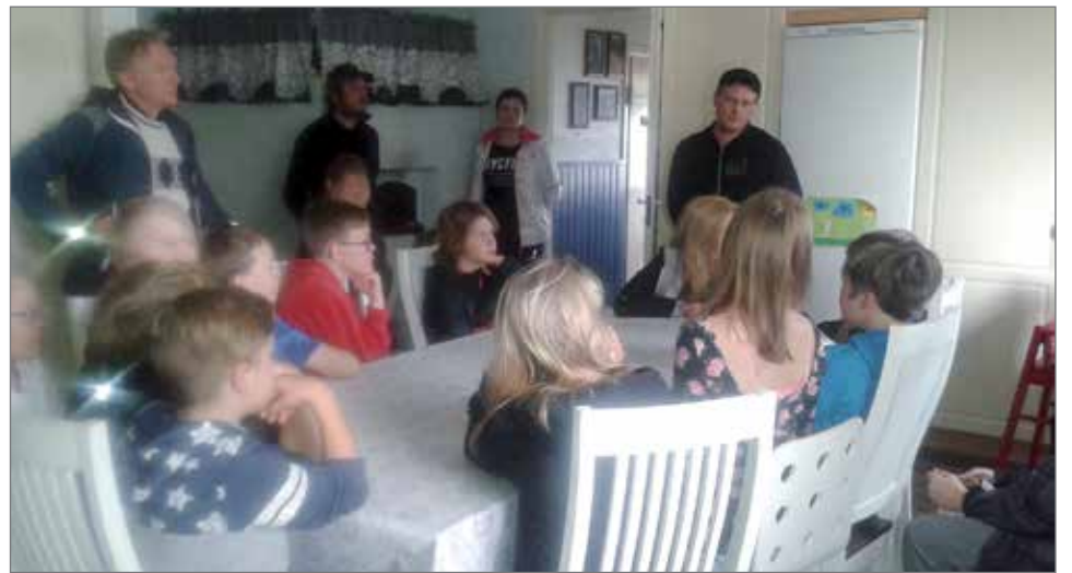
Oppilaat kokoontuivat Kälkäjien keittiöön kuulemaan muun muassa MTK:n toiminnasta.