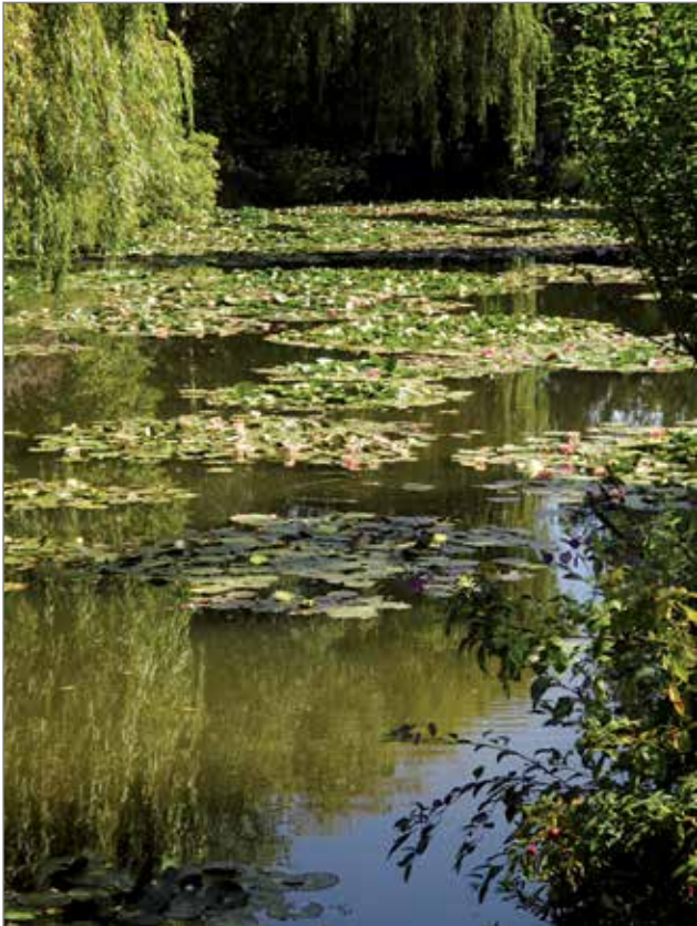
Lumpeet täydessä kukassa vesipuutarhassa. Claude Monet inspiroitui veden ja lumpeiden väreistä ja heijastuksista.