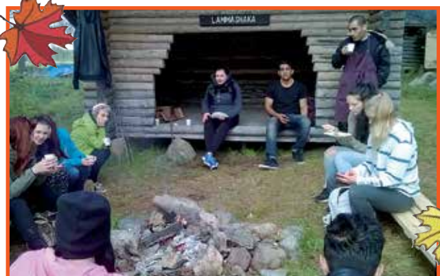
Ruokailua opiston laavulla.