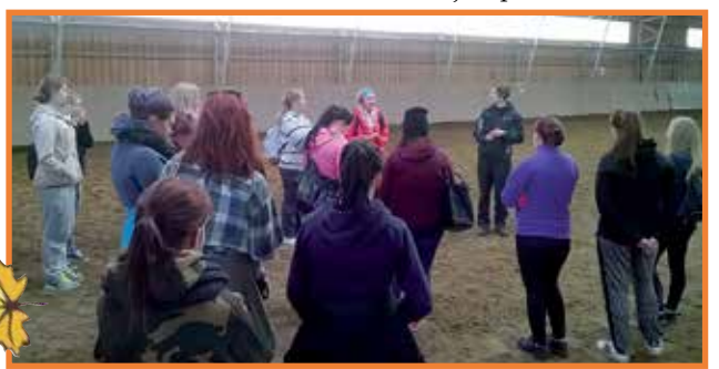
Vierailu hevososastolla oli mielenkiintoinen. Oli tallin, simulaattorin ja maneessin esittelyä.