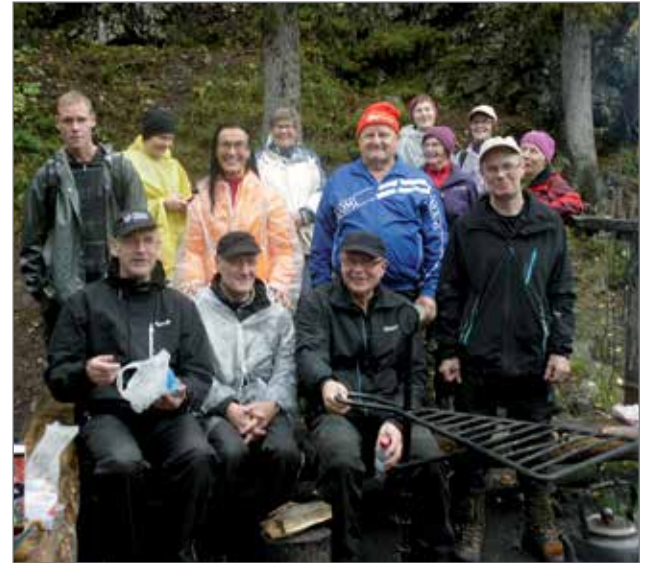
Hempan hölkkäläiset Pienellä Karhunkierroksella Siilastuvan nuotiopaikalla nokipannukahvilla.

Vaellus kaikkineen oli onnistunut ja porukka ponnisteluunsa tyytyväinen. Tästä kertovat seuraavat