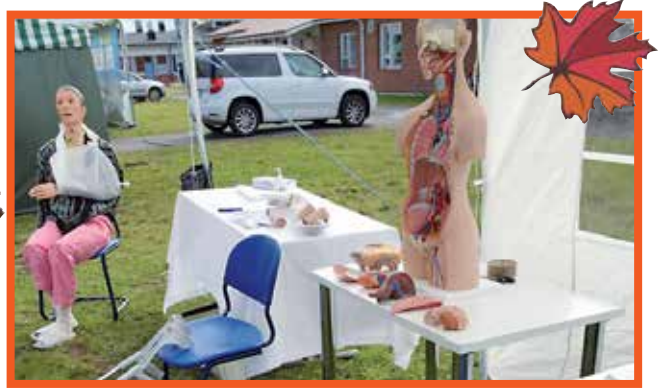
Syysmarkkinoilla lähihoitajaopiskelijoiden pisteeltä löytyi verenpaineenmittausta, lasten ensiapurasti sekä elintunnistamista ja sijoittamista ihmiskehoon.