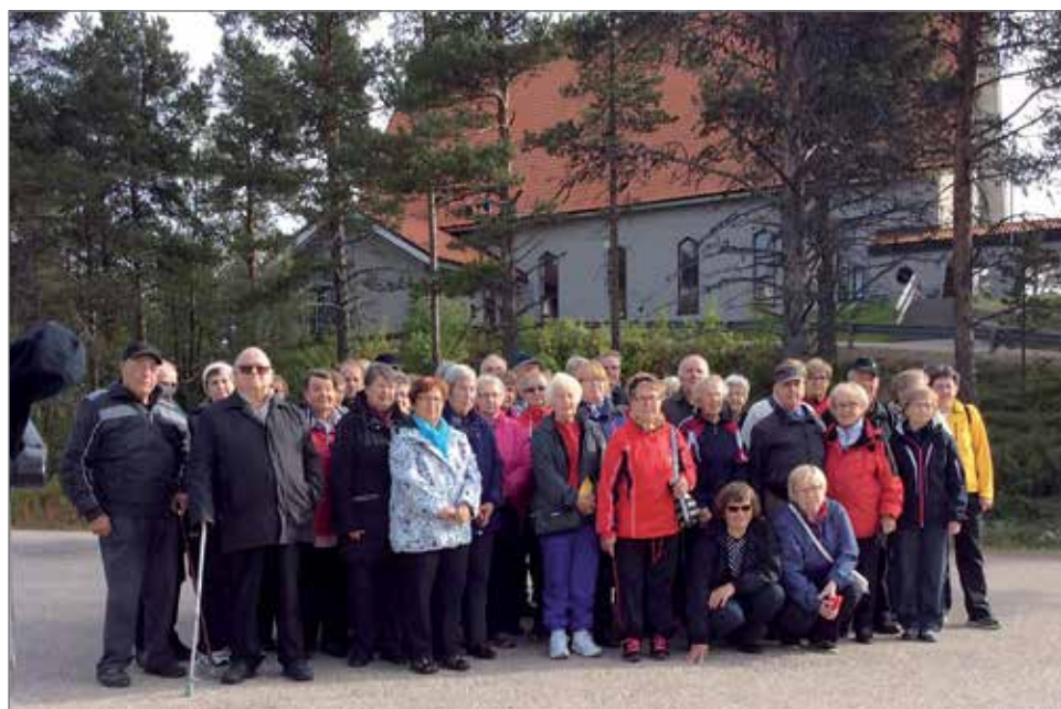
Pudasjärven Syöpäkerhon syysretkeltä yhteiskuva Hetan kirkon pihalla.