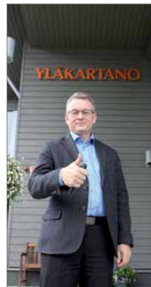
kettavia tekoja, toteaa Purola.

"Tavoitteena on, että juhluvuoden tempaus näkyy ympäri Suomen. Kannustamme kaikkia suomalaisia vapaaehtoistyöhön. Osana lahjaamme olemme avanneet osuuspankkiryhmässä vuoden alussa kaikille suomalaisille avoimen vapaaehtoistoiminnan kohtauspaikan Hiop100.fi. Uuden ajan vapaaehtoistyön välitysalustan kautta kuka tahansa voi etsiä apukäsiä järjestämäänsä vapaaehtoistyöhön tai löytää oman vapaaehtoistyön kohteen. Uudessa vapaaehtoisten kohtauspaikassa hiop100.fi suomalaiset löytävät helposti sopivat tekemisen paikat, ja meillä on mahdollisuus saada yhdessä aikaiseksi koko Suomea kos-