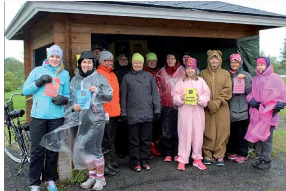
Illa sattui olemaan huono, mutta kävely vedettiin kunniakkaasti.

Pihlajanmarjat ja alkava ruska koristivat kävelyreittiä.