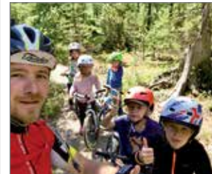
Syötteen reitit soveltuvat myös lapsille.

Olen tutustunut Syötteen maastopyöräreitteihin ensimmäistä kertaa reilu viisi vuotta sitten. Jäin koukkuun heti ensimmäisen lenkin jälkeen. Maasto on mukavan vaihtelevaa ja vaatimusta-soiltaan kaikille löytyy sopivia reittejä. Helpoimmat ovat ihan aloittelijoille ja lapsille sopivia, sorastettuja polkuja, joilla pärjää perusmaastopyörällä mukavasti. Taukopaikkoja on hyvin ja halutessaan voi ottaa pyöräretkelle eväät mukaan. Olen ajanut lasten kanssa eri versioita reiteistä ja jokaiselle löytyy sopivia. Kun ajo halut kasvat, voi lenkkejä yhdistellä ja ajaa vaikka 70-80 kilometriä niin, ettei tarvitse ajaa samaa reittiä kahta kertaa samalla lenkillä -ai- van uskomatonta! Syyskuussa oli pyörälenkillä mukana muutama ensikertalainen ja kaikki vanhoivat palaavansa niihin maisemiin uudestaan -sen verran haltioituneita olivat nämä Ranuan isännät. Polkuja on sorastettu tälle kesälle lisää ja se mahdollistavat yhä useammalle maastopyöräilyn, kun reitin tekninen vaatavuustaso helpottuu. Toki kokeneet pyöräilijät jäävät samanaikaisesti kaipaamaan juurakoita ja kivikoita, mutta niitäkin onneksi löytyy vielä esimerkiksi Pitämävaaran lenkiltä ihan ajaa asti.