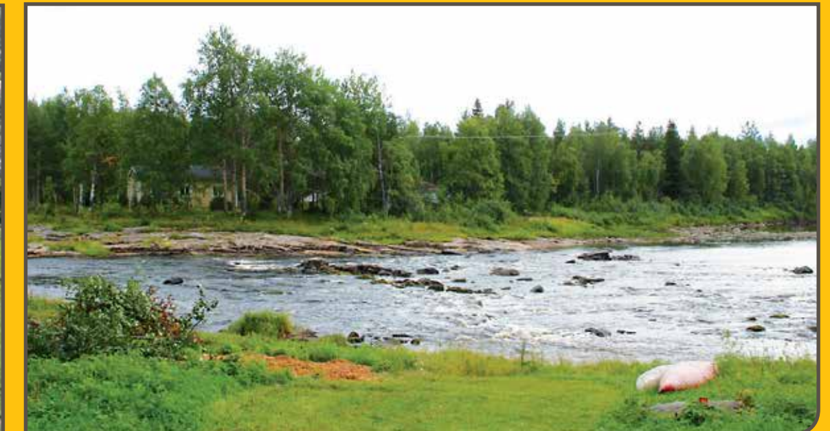
Profin Oy:n syntysijoilla Kynkään kosken rannalla on historiallinen puunjalostuspaikka. Siellä on sijainnut saha ja myly vuosina 1784 - 1909. Sahattua puutavaraa kuljettiin liijokea pitkin merelle ja siitä maailman markkinoille muun muassa Englantiin saakka.