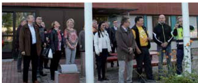
Suomen lipun nostamiseen 5.9. osallistui noin 25 yrittäjää ja kaupungin henkilökuntaa.

tulevan syksyn toiminasta ja korosti kaupungin ja yrittäjien hyvää yhteistyötä. Keskustelu kävi vilkkaana ja kehittämistoimelta kyselehtiin ajankohtaisia asioita. Syötteen matkailun vetovoimaan uskottiin ja siellä todettiin olevan meneillään uusia matkailua edistäviä investointeja. Kaupungilla on kehittäillä Valtatie 20:n varrella olevan lakkauteen Kurenalan koulun purkamisen ja tilalle tullaan rakentamaan mahdollisesti jo ensi vuonna, uusi kaupungin keskusta valtatieltä johtava liittymä sekä koulun paikalle vuonna 2019 aloitettavaksi monitoimikeskuksen rakennustyöt. Rakennuksen suunnitellaan muun muassa jäähallia, keilahallia ja useita muita palvelukokonaisuuksia. HT