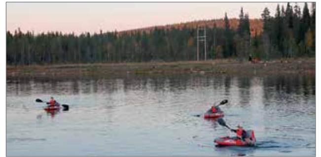
Syötteen Eräpalveluiden pisteellä sai kokeilla River Tubeilla melomista ja testiryhmää riitti ajoittain ruuhkaksikin asti.

Tapahtuma keräsi jälleen karkeasti arvioituna lähes 500 kävijää. Etenkin kokon roihutessa komeimmillaan ja ilotulitusten räiskyessä väkeä oli runsaasti. Tulimestareilta tilatun ilotulituksen tarjosivat Syötteen Matkailu-