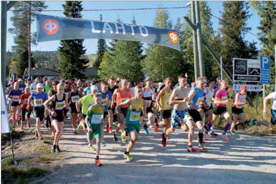
Huippukymppin yhteislähdössä starttasi lähes sata juoksijaa ja kuntoilijaa.

Syötteen tapahtumarikkaan viikonlopun yksi vetonauloista oli lauantaina 12.9. pidetty Huippukymppi juoksupahtuma. Tapahtuma veti paljon urheilijoita tukijoukkoineen paikalle. Yhteislähdössä starttasi 90 juoksijaa ja nuorten sarjoissa matkaan lähti noin 20 nuorta urheilijaa.