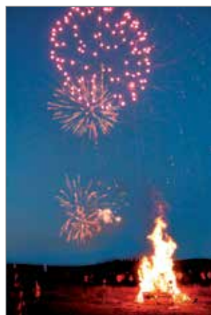
Näyttävä ilotulitus huijensi illan.