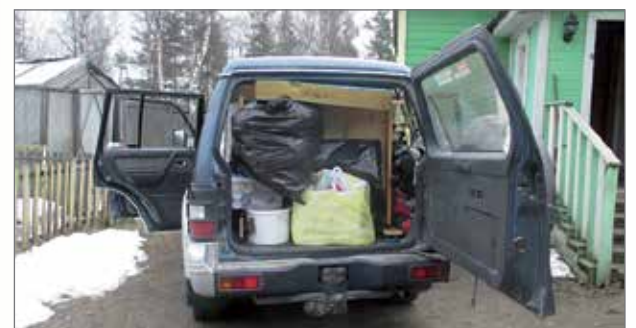
Kyllä Pajeroon mahtuu tavaraa, kunhan pakkaa oikein.

len kurssin päätöstilaisuuteen. Sovittiin vierailusta.