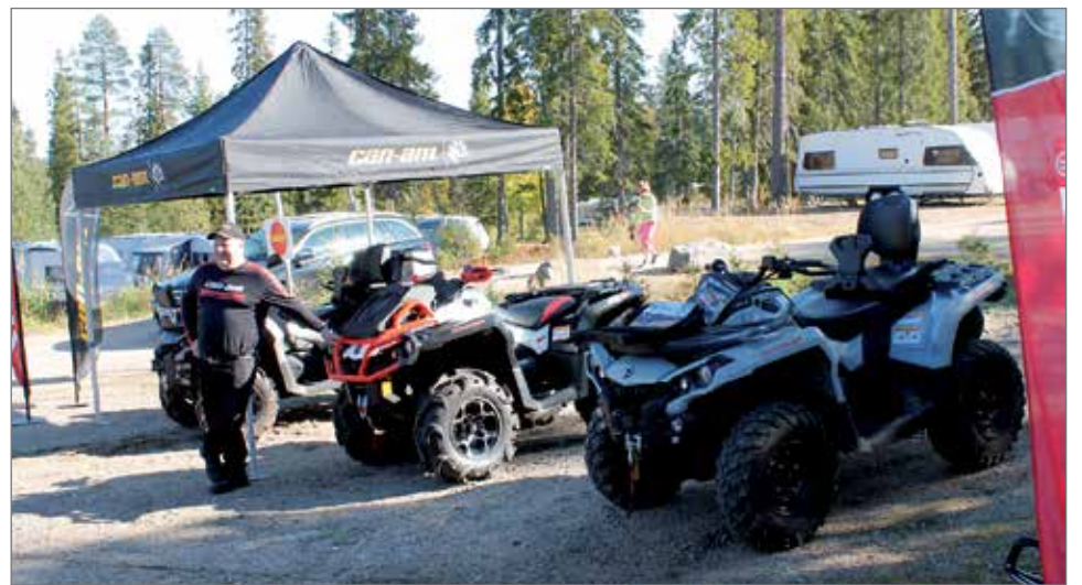
Avajaisviikonlopun kunniaksi pihalla oli myös muutamia myyntipisteitä, kuten Pienkonehuolto Keskihon esittelystä oli suosittuja mönkijöitä.