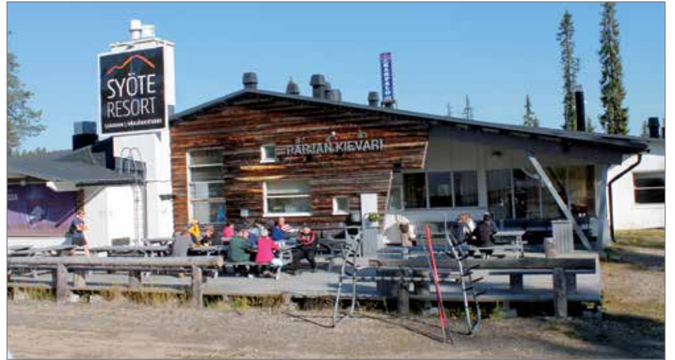
Aurinko heli jo heti aamupäivästä Pärjäkievarin terassille tulleita asiakkaita.