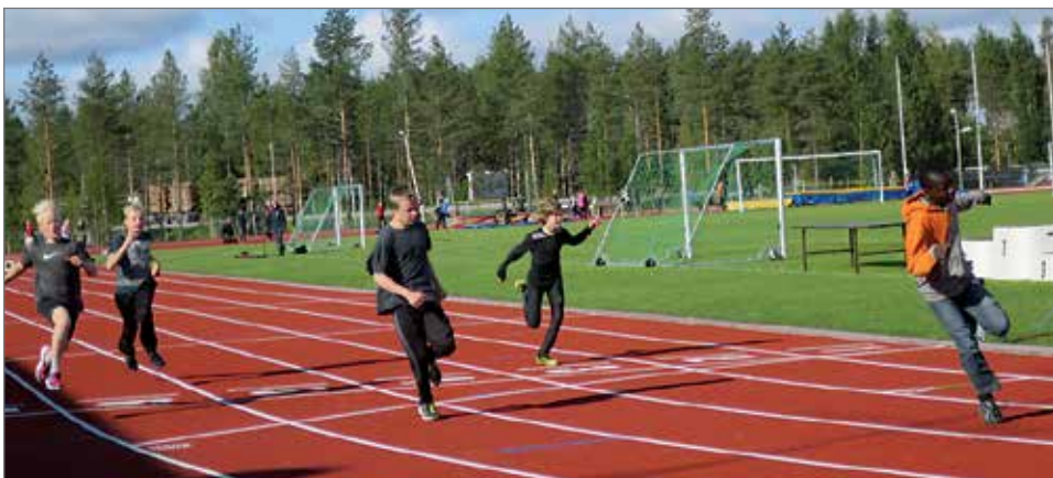
13-vuotiaiden poikien 60 metrin välierän maaliintulo.