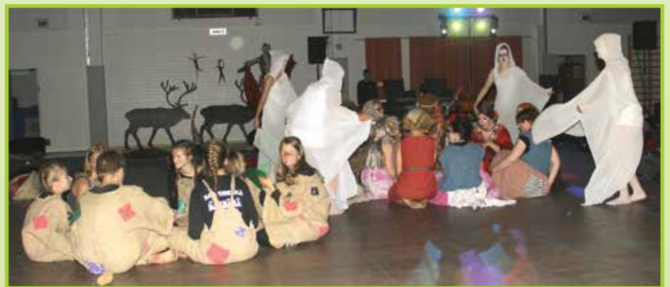
Erämaakylän lasten apuun kutsumat hengettäret voimaannuttamassa kyläläiset iloon, eloon ja tanssiin.