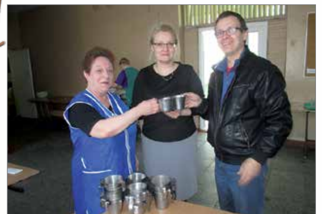
Työpetari ry on lahjoittanut isot määrät teräsmukeja.

- Ota vain. Kyllä sinä tarvitset, kun sinulla on sellainen elämä. Hän tarkoitti tätä avustustyötä. Jätin äidin ja tyttären kaupunkiin ja jatkoin matkaani. Matkatoimistossa tuli juttua vierailusta suomenkie-