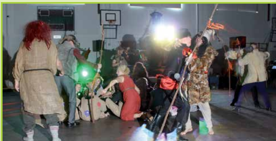
Yhteistanssin pyörteissä erämaakylän miesten juopottelu johti tappelujunakoihin.

Jenny Kärki, Heimo Tu- runen. Kuvat Birgit Tolo- nen ja Heimo Turunen