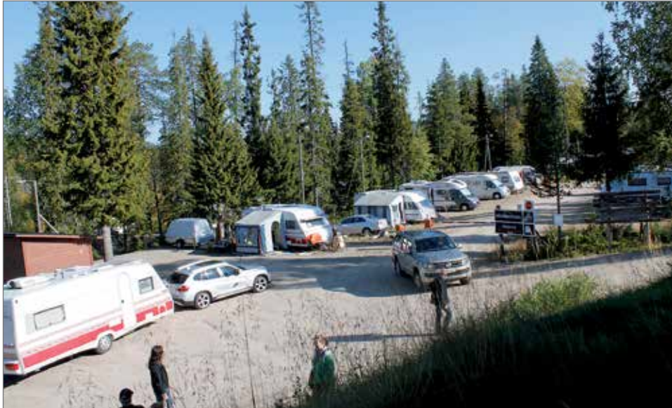
Pärjän karavaanarialueelle on luvassa ennätysyysky. Huippuviikonlopunkin aikana paikalle virtasi kymmeniä karavaanareita.