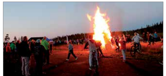
Komean kokon sytytys keräsi runsaan yleisön ympärilleen.