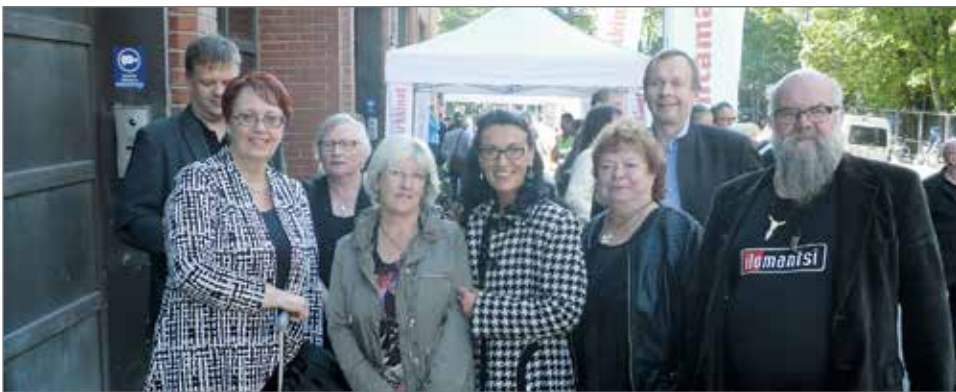
Pudasjärven luottamushenkilöitä ja virkamiehiä Kuntamarkkinoilla 2015.