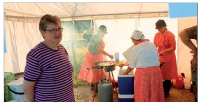
Syötteen Kyläyhdistyksen kojulla ahkerat talkoolaiset paisivat lettuja ja makkaraa.