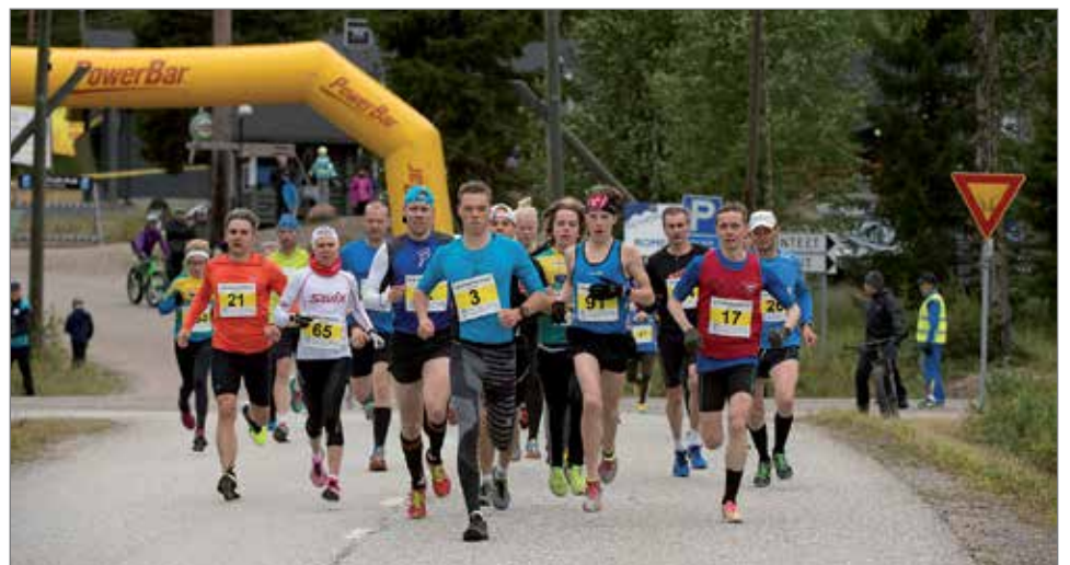
Huippukymppi on muodostunut Iso-Syötteellä perinteiseksi tapahtumaksi, joka kokoaa niin huippujuoksijoita, kuin kuntoilijoita samalle lähtöviivalle.

Isosyöte Classic Trail Run 21 kilometrin polkujuoksu juosti toisen kerran. Siinä pääosan järjestelyvastuusta kantivat Limingan Niittomiehet, josta oli myös runsaasti juoksijoita. Polkujuoksupahtumat ovat kasvattaneet koko ajan osallistujamääriään ja siinä kehityksessä haluttiin ja halutaan olla myös Pudasjärvellä mukana.