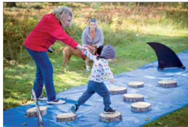
Lapset on huomioitu syysmarkkinoiden ohjelmassa kuten aiemminkin.

Lemmikeistä ja eläimistä kiinnostuneille on uutena ohjelmaa. Lemmikkien harrastajilla on mahdollisuus tuoda oma lemmikki Lemmikkieläinnäyttelyyn. Pudasjärven 4H-yhdistys