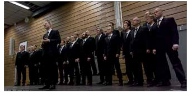
Mieskuoro Huutajien esiintyessä ei kovaäänisiä tarvinnut.

Heimo Turunen