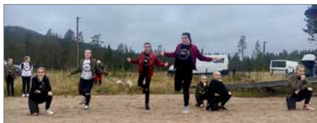
Illan jorasi käyntiin AKdancen tanssijat Oulusta. 11-18 -vuotiaat tanssijanuoret harrastavat pääalajinaan katutanssia.

Illan jorasi käyntiin AKdancen tanssijat Oulusta. 11-18 -vuotiaat tanssijanuoret harrastavat pääalajinaan katutanssia. Tämä tanssiryhmä esiintyy ja harjoittelee ahkerasti kotimaan lisäksi myös ulkomailla. Vastarannan siili -trio viihdytti iltaa levynjulkaisukonsertillaan.