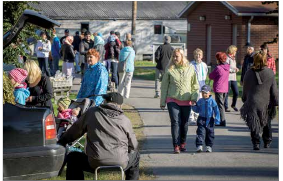
Markkinoille toivotaan runsaasti yleisöä ja kaunista säätä. Kuva vuoden 2014 markkinoilta.

järjestää näyttelyn, mihin voivat osallistua kaikenlaiset lemmikit karvoihin katsomatta. Yleisö äänestää kilpailun voittajan, mutta jokainen osallistuja palkitaan pienellä palkinnolla. Lemmikkieläin näyttely on kello 10-12. Pehmoeläin näyttely alkaa heti Lemmikki-näyttelyn jälkeen. Perheen pienimmät ovat tervetulleita paikalle omien pehmoeläimien kera.