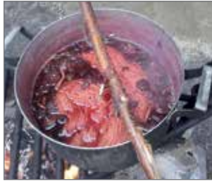
Lankoien värjäystä esiteltiin luontokeskuksen laavulla.