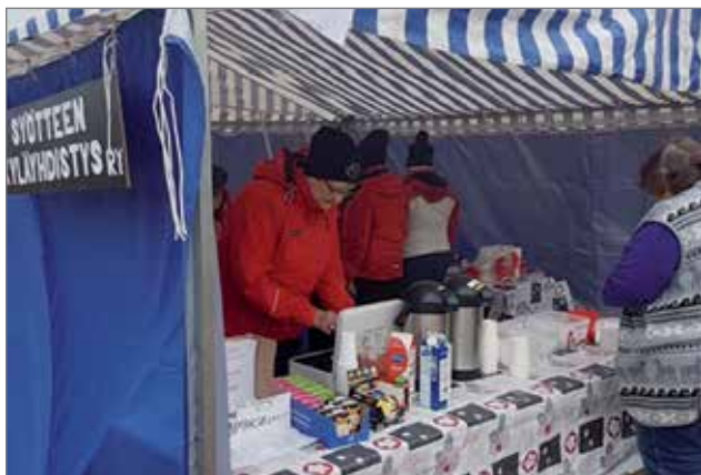
Syötteen kyläyhdistys paistoi makkaraa ja lättyjä ja myynnissä oli myös kahvia ja mehua.