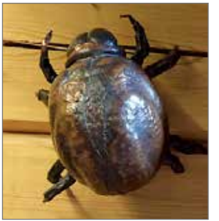
Pölypunkki on taipunut kuparin muotoon.

li tuntui mieluisalta, mutta seuraavaan kokeilukertaan vierähti kymmenkunta vuot- ta; tällöin kansalaisopistolla oli tarjolla taidetaontakurssi. Kurssista alkoi pitkä ja mie- lenkiintoinen rupeama ku- paripakotusten parissa, noin 20 vuotta. Kuparin taontaan kutsutaan pakottamiseksi, mutta ennen vasaratyötä on tehty jo monenlaisia valmis- tavien töitä. Kaikkien esillä olevien töiden raaka-aineena on ollut kuparilevy. Kaavoja ei oikeastaan ollut olemassa, joten leikkaaminen tapah- tui aluksi arvioimalla ja kei- lelemällä. Upeisiin ötököi-