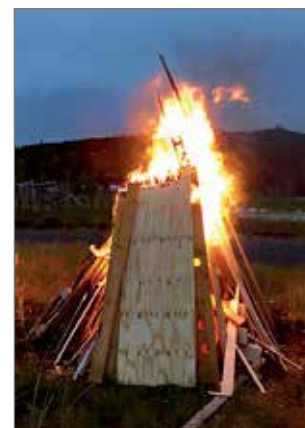
Kokko paloi pimenevässä illassa mukavasti.