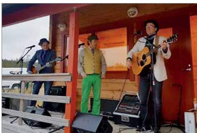
Vastarannan siili -trio viihdytti iltaa levynjulkaisukonsertillaan.