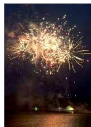
Ilta huipentui upeaan ja värikkäseen ilotulitukseen.

Kokko paloi pimenevässä illassa mukavasti ja ilta huipentui upeaan ja värikkäseen ilotulitukseen.