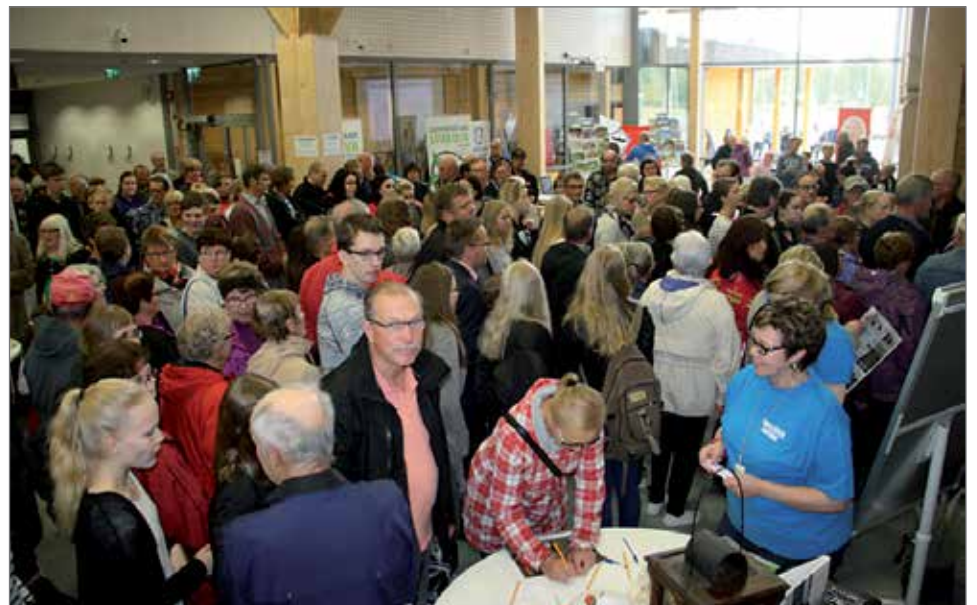
Välillä Hirsikampuksen aulassa oli osallistujia tungokseen saakka.