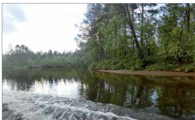
Osa matkasta taitettiin jokiveneillä Lemmenjokea pitkin.