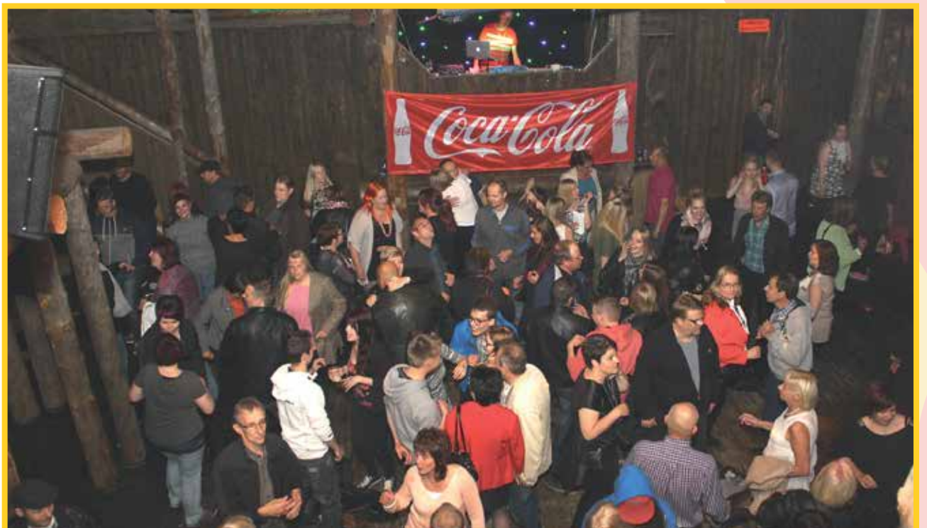
Disco oli koko illan ajan täynnä tanssijoita.

Talkoilla rakennettu kokko sytytettiin puolen yön aikaan veden äärelle, jolloin lieskat lyövät korkealle. Tuli heijastuu edessä olevasta lammesta myös alaspäin. Kokko sisälsi myös Mursunsaaresta saadun veneen. Puut olivat valaistu nättisti ja veden päällä on tulilauttoja.