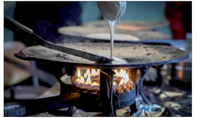
Markkinoilla haukataan tuoreita lättöjä!

Laakso hoksauttaa kaikkia opiskeluintoisia punta-roimaan OSAO Pudasjärven yksikön ammatillisen koulutuksen tarjontaa niin nuorille kuin aikuisille, joille räätilöidään henkilökohtainen