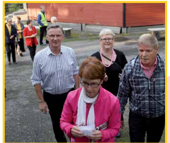
Mökkiläisillasta siirryttiin esiintymislavalle rakennettuun kahvioon kaupungin tarjoamille leipäjuustokahville.