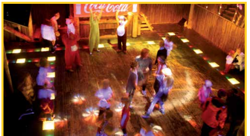
Ipanadisco pyöri koko tapahtuman ajan.