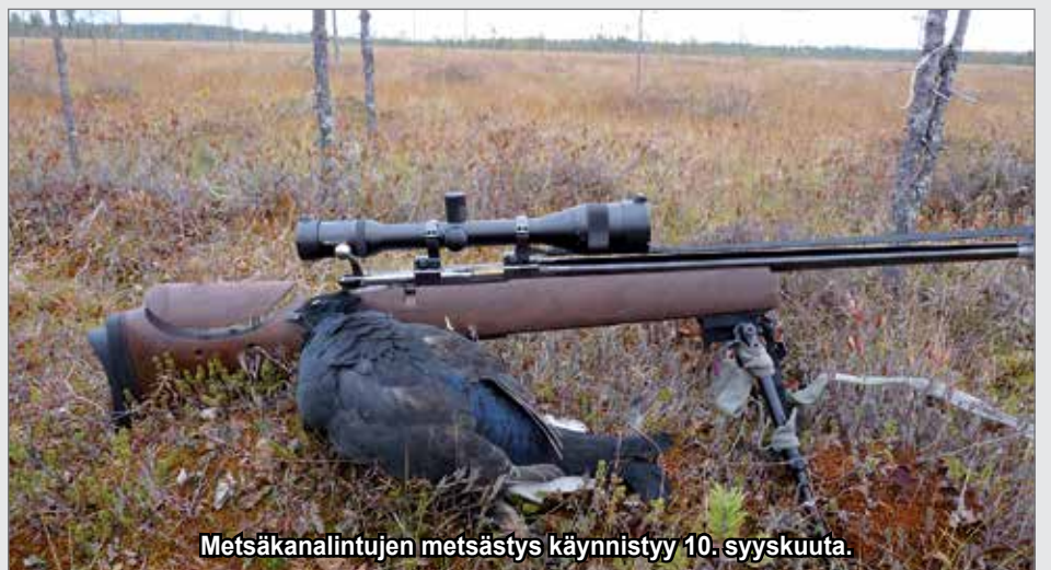
Metsäkanalintujen metsästys käynnistyy 10. syyskuuta.

Syksyn metsästyskausi alkoi jo 1.9. jäniksenmetsästyksen merkeissä ja hirvenmetsästyskausi alkaa syyskuun lopulla, 26. päivänä. JK