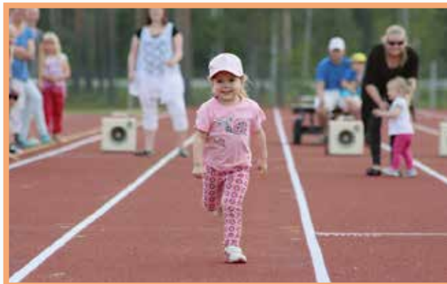
Alle viisi vuotiaiden tyttöjen 40 metrin juoksussa juostiin hymyssä suin.

Suosittu Hippo-yleisurheilukisat käytiin kauniissa kesäsäässä keskiviikkona 26.8. Kisoihin oli ilmoittautunut 168 reipasta kisailijaa, lajeina juoksu, pallonheitto, kuula sekä isoimmille pituushyppy. Kaikki kisailijat palkittiin osallistumismitalilla, parhaat saivat lisäksi mitalin sekä tavarapalkinnon.