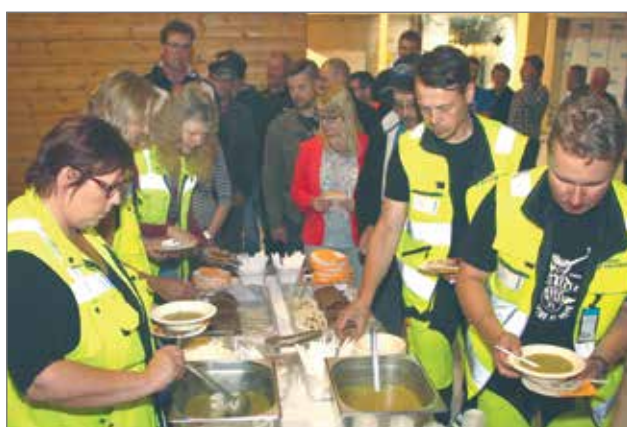
Harjannostajaisiin kuuluu olennaisena osana hernekeit-toruokailu ja hirsikoulun harjannostajaisissa noudatettiin tätä perinnettä.