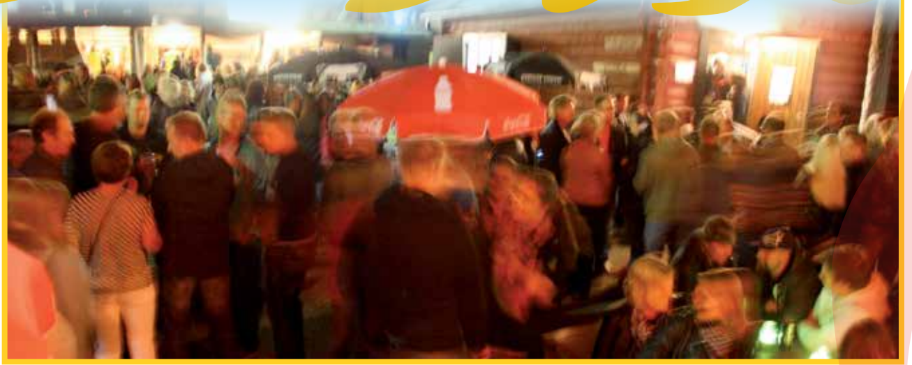
Tapatumailtana oli hieno ja lämmin ilma, mikä omalta osaltaan takasi yleisömenestyksen. Myös komea täysikuu lumosi osallistujat. Yleisöä viihtyi myös Jyrkkäkosken huvikeskuksen pihalla.