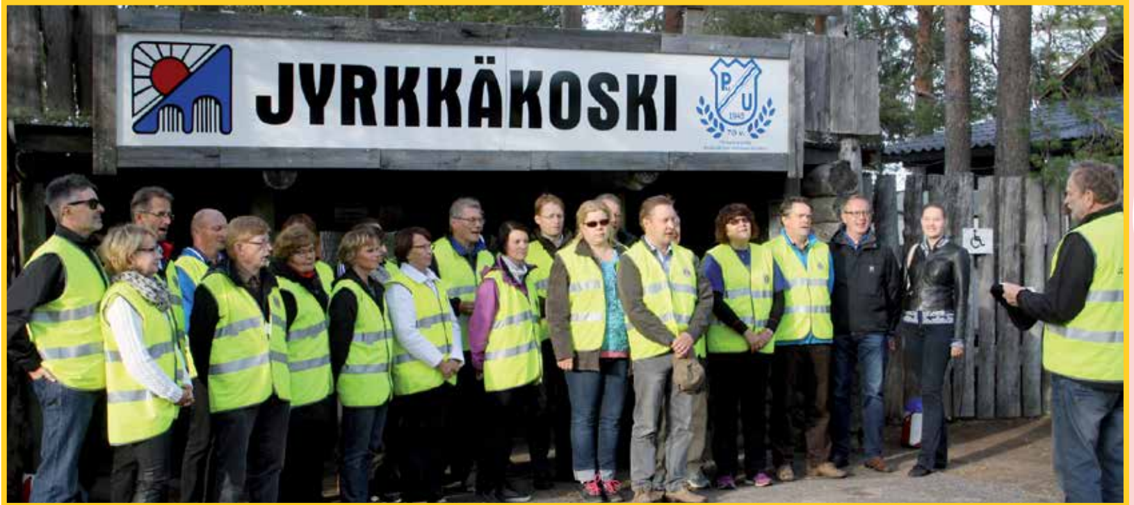
Lionsklubin talkoolaiset nostivat illan aluksi lipun salkoon, lauloivat leijonalaulun ja kokoontuivat yhteiseen kuvaan. Illan mittaan työtä riitti monissa eri tehtävissä. Myös Pudasjärven urheilijoilla oli suuri talkoolaisten joukko huolehtimassa illan onnistumisesta.