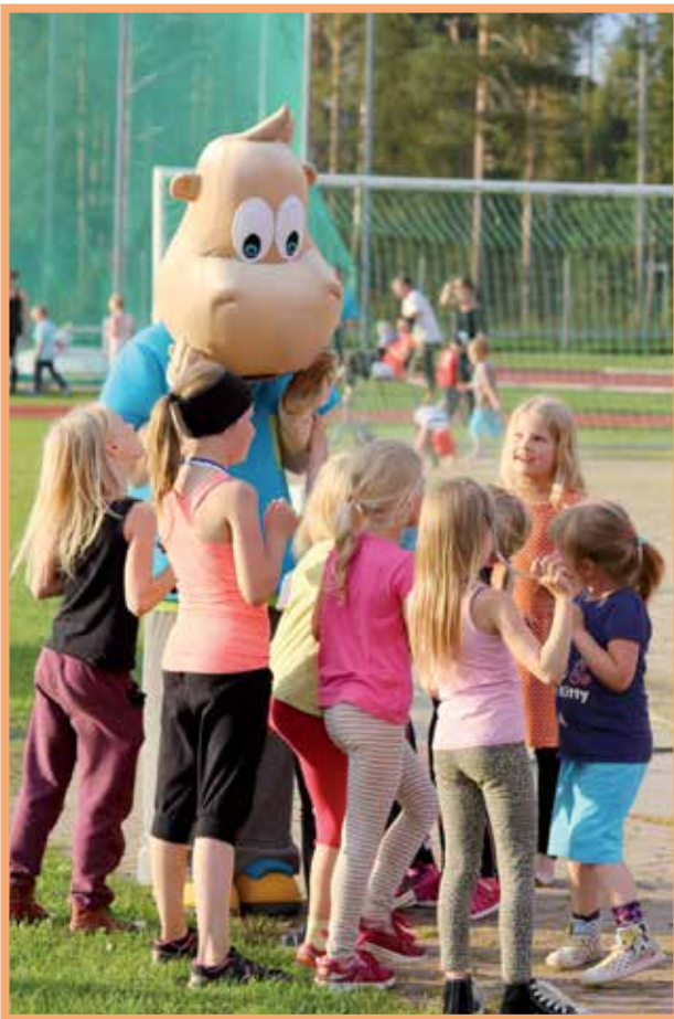
Hipolla paljon ystäviä joita kannustaa.