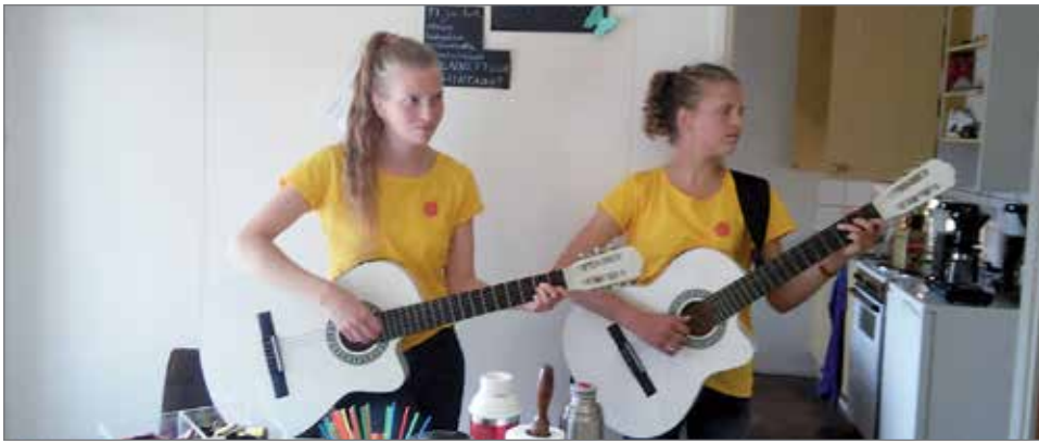
Kuvassa Sarakylän alueen kyläseuran kesätyöntekijät työtehtävissä.

OP Ryhmässä syntynyt ajatus työllistää nuoria osuuspankin tuella poiki töitä menneenä kesänä yhteensä 1131 nuorelle ja työllistäjinä oli 50 Osuuspankkia ympäri Suomea. OP Pudasjärvi lahjoitti kesätyön 14 nuorelle kesällä 2015. Tukea varattiin yhteensä 20 nuoren työllistämiseen ja työllistäviä yhdistyksiä löytyi seitsemän, joista kukin työllisti kaksi nuorta. Yhdistyksiltä tuli kesätyöllistämisestä myönteistä palautetta.