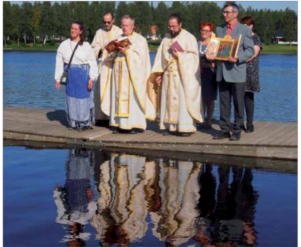
Sunnuntaina 23.8. pidettyyn praasniekkaan kuului veden siunaaminen Rajamaan rannassa

ta ja niin suuria järviä ja niin paljon kalaa, eikä niin monta venettä ja hevosta kuin lapsen mielikuviin äidin luoma kuva kodista Karjalasta piirtyi. Tuota ihmeellistä maa-