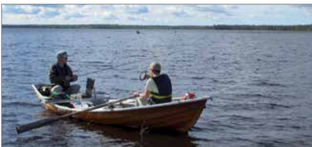
Kalastajat ovat lähdössä kalastamaan sunnuntai-iltana Panumajärven rannalta. Kuva Ala-Kollajan Osakaskunta.

Kuvat ottanut Mika Niskasaari Iijoen Koivukarilta, Kellolammen alueelta (Ylikurki). JK