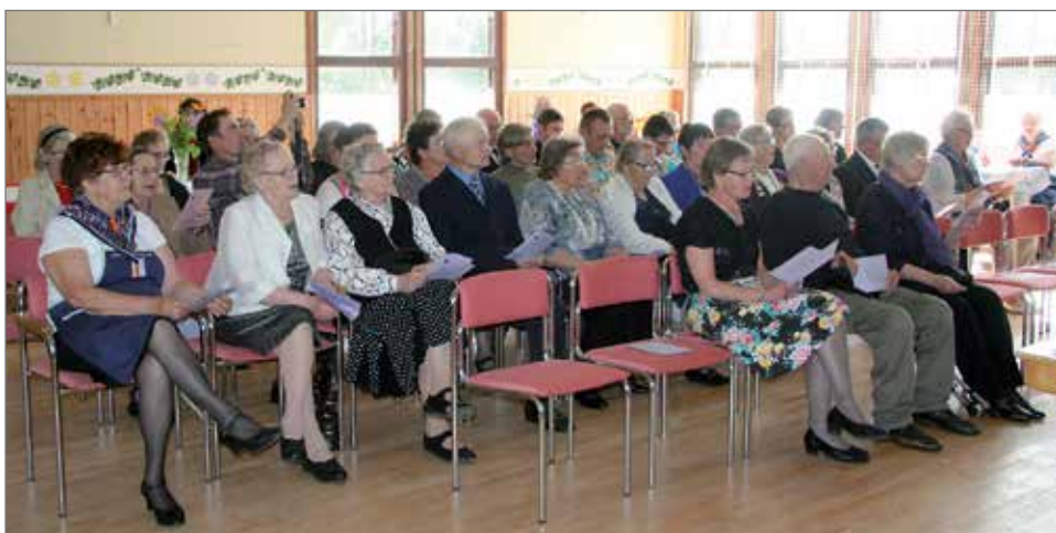
Kotimaani ompi Suomi, Suomi armas synnyinmaa...