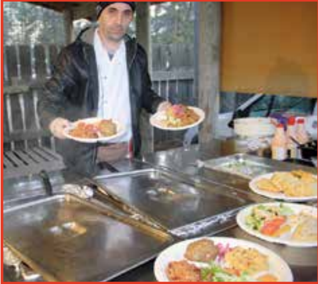
Ruokana oli tarjolla kala- tai lihavaihtoehtoja, joita Gasri Basri Ravintola Meritasta oli tarjoamassa illan jo pimentyessä.