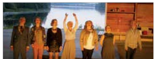
Katri Helena -kesäteatteri.