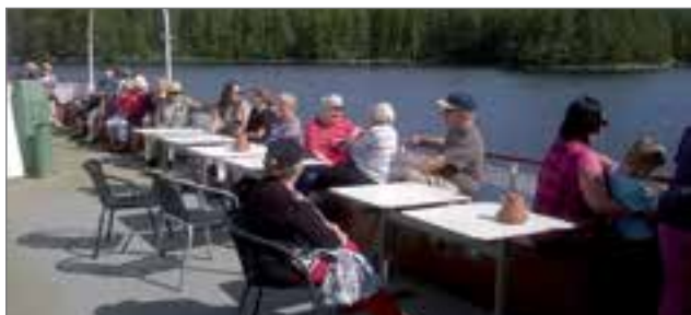
Kuva laivan kannelta.