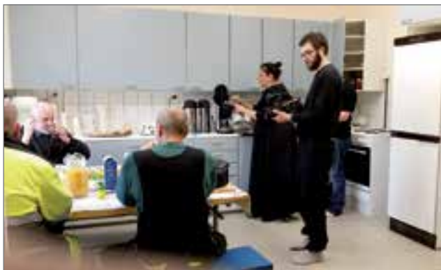
Jongun työntekijöiden päivän kohokohta on ruokailu. Sekin laitettiin filmille.