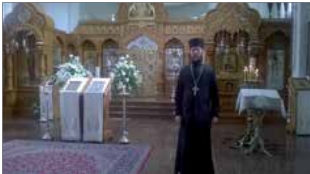
Valamon luostarin kirkko ja esittelijä Heinävedellä.

Kerhot jatkavat Palvelukeskuksessa joka kuukauden viimeinen sunnuntai kello 17. Seuraava kokoontuminen on 24.9.2017, jolloin katsellaan retkikuvia ja suunnitellaan syksyn toimintaa. Tervetuloa mukaan toimintaan!