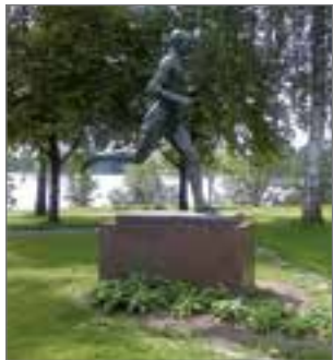
Hannes Kolehmainen patas Kuopion Väinölänniemellä.