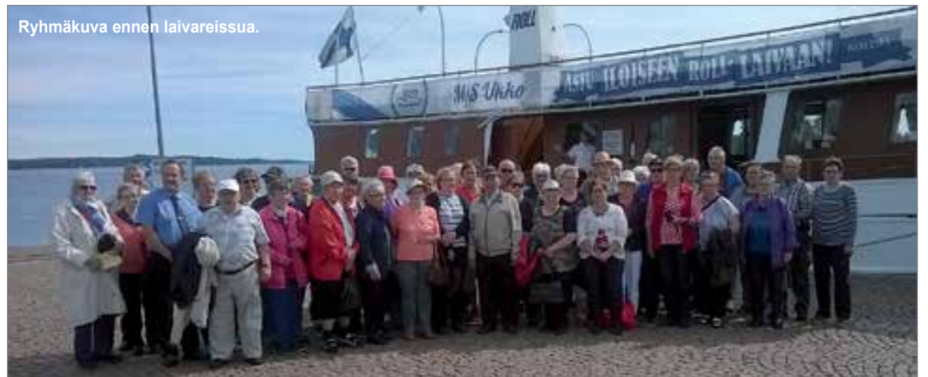
Ryhmäkuva ennen laivareissua.

Syöpäkerhon tämänvuotinen matka suuntautui 10.-13.8. Kuopion Rauhalahteen, josta käsin kävimme myös tutustumassa Valamon munkkiluostariin Heinävedellä.