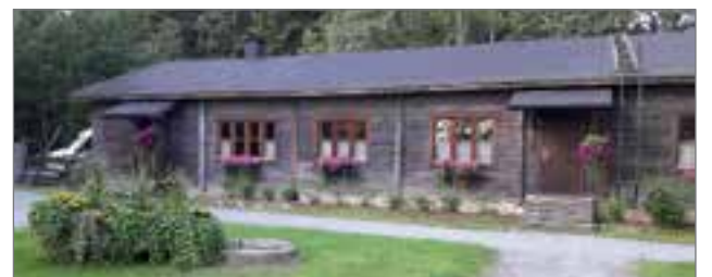
Jätkänkämpä Kuopion Rauhalahtessa.

Katri Helenan laulut ja hänen elämäkertansa oli nidottu esityksessä mukavasti yh-