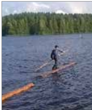
Tukkijätkä seilaa Kallavedellä.