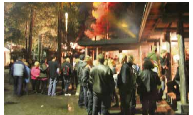
Jyrkkäkosen alue oli valaistu näyttävästi ja täyttyi Venetsialaisjuhlijoukosta, joita oli myös tanssimassa ja Revontuli diskossa. Kuva otettu pitkällä valotusajalla ilman salamaa.