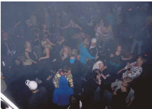
Diskon lattia täyttyi tanssijoista