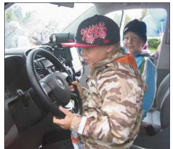
Poliisiauto oli erityisesti lasten mieleen