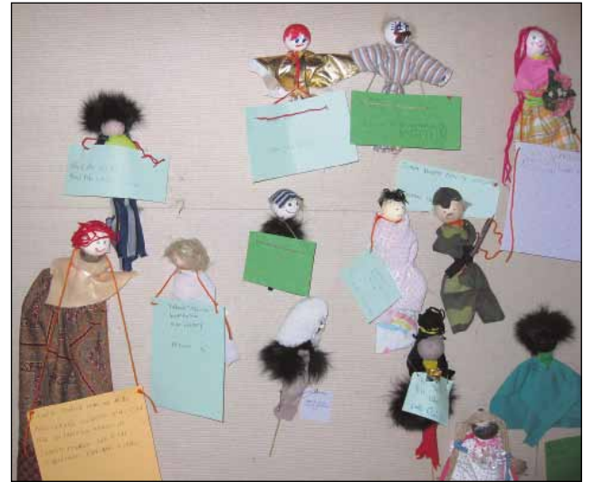
Lasten tekemiä käsinukkeja tarinoidensa kera.