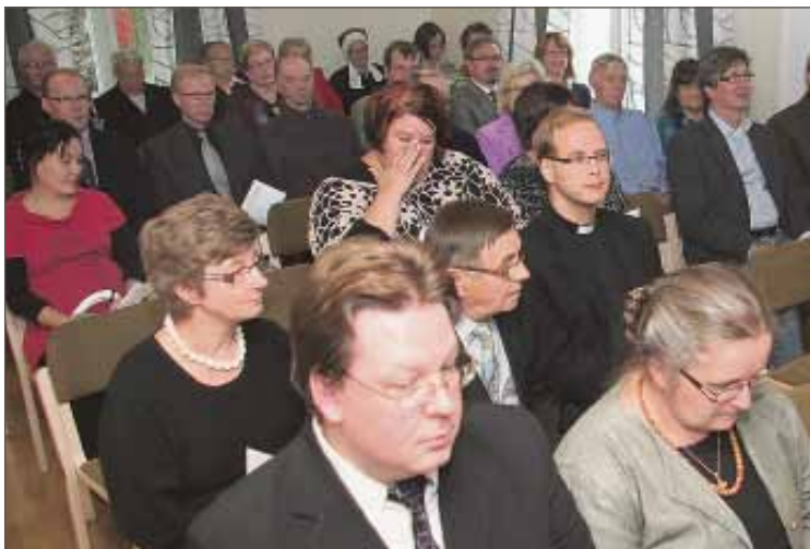
Käyttöönottojuhlaan osallistui viitensikymmentä henkeä. Päivällä tiloihin oli jo käynyt tutustumassa noin 150 seurakuntalaista.