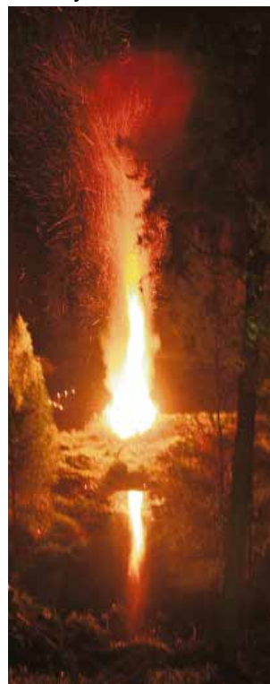
Kokko veden äärellä sytytettiin klo 23 ja loisti pimeässä. Lisäloistoa antoi kokon edessä oleva vesilampare, josta kokko heijastui ja näytti palavan myös alaspäin.