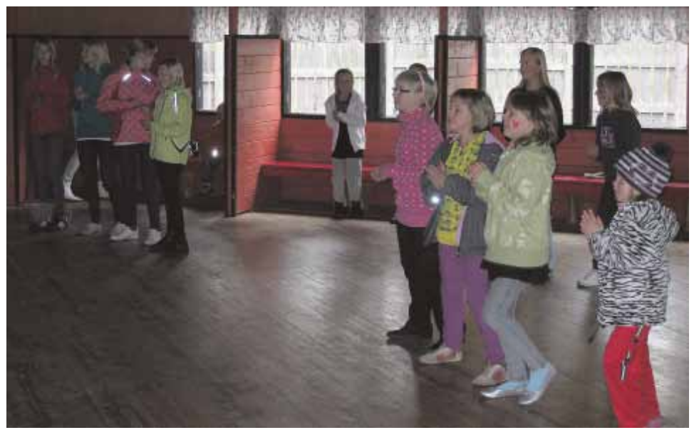
Zumbaa oli päivän aikana kahdesti. Paikalla oli runsaasti väkeä, vaikka samaan aikaan torilla oli myös ohjelmaa lapsille poliisin päivän merkeissä.