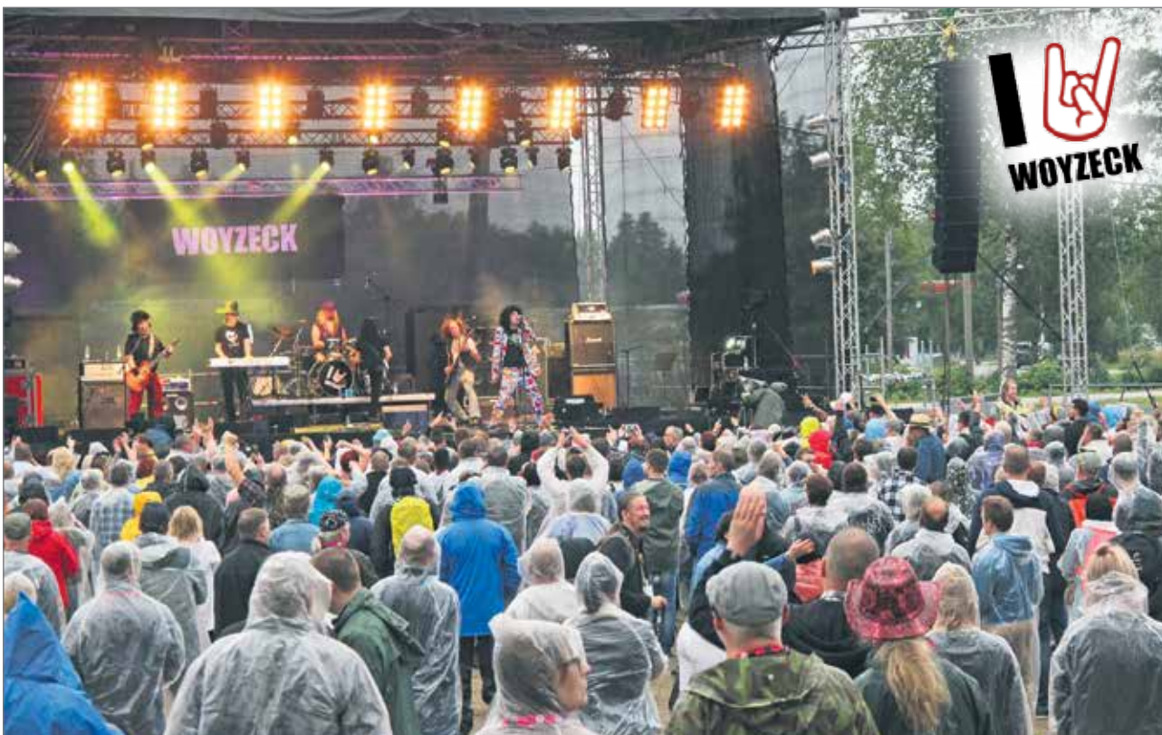
Bilebändi Woyzeck esiintyi lauantaina ennen Eppu Normaalia ja sai yleisöltä suuren suosion. Illan aikana kuultiin runsaasti viime vuosien hittikappaleita.