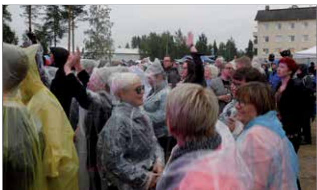
Sade ei pilannut tapahtumaan osallistujien riehakasta mielialaa.