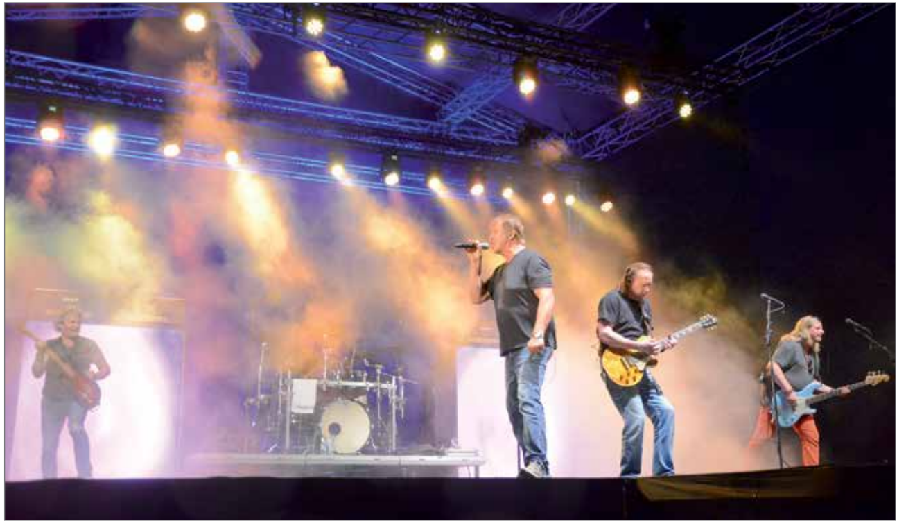
Suomi-rockin suuryhtye Eppu Normaali esiintyi Pudasjärvellä pitkän tauon jälkeen. Lisää kuvia Eput Pudiksella -tapahtumasta voit käydä katsomassa osoitteessa www.iijokiseutu.fi .

ma-, opastus- ja muu palvelu sujuivat kuin ajatus. Ammatimaiselta palvelulta tuntui, kun kohtelias hyvin nuori poikatoimitsija tuli eritoten kysymään, joko VIP-vieras on käynyt syömässä.