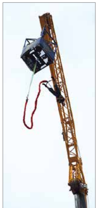
Jännitystä ja vatsan pohjan kouristuksia saivat rohkeille hyppääjille ja katsojille aikaan K-supermarketin pihalla toteutetut benjihyppyt.

Puolenyön aikaan rävähti taivaalle ilotulitus miltei suuren maailman malliin. Pimeä elokuinen yötaivas sai hetkeksi monenmoisia uusia värisävyjä ja vaihtelevia kuvioita mahtavan paukkeen