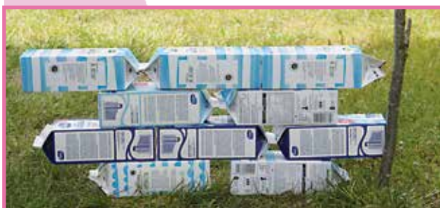
Lasten keppihevosradan esteitä oli tehty egolokisesti.