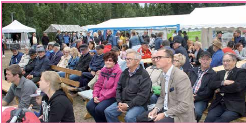
Sarakylän Vattumarkkinoilla on jo 28-vuotinen perinne. Kuva sunnuntain päiväjuhlasta markkinatorilla.

Marjat ja luonnontuoteala - metsät kaikin tavoin ajatellen - ovat osa suuren biotalouden kokonaisuutta. Biotalous avaa meille suuria mahdollisuuksia. Sen puo-