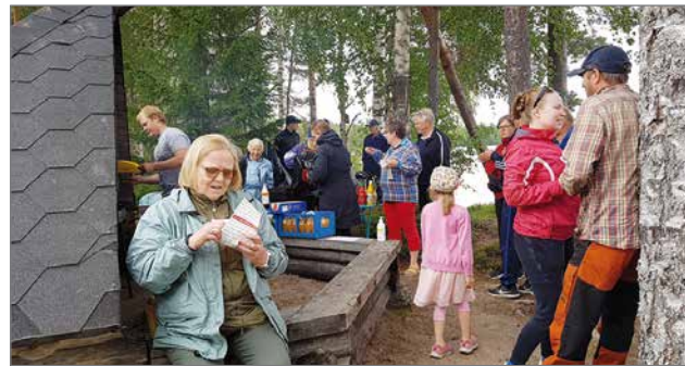
Avajaispäivän kävijämäärä yllätti myönteisesti kyläseuran.