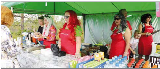
Siuruan kyläyhdistys oli pystyttänyt kahvioteltan, josta sai kahvia, munkkeja, juomia ja grillimakkaraa.