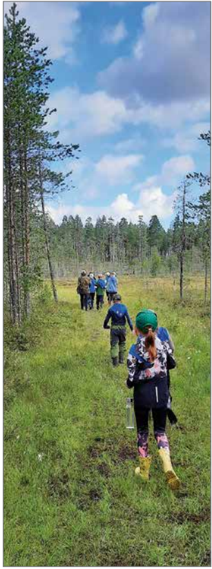
Leirin toisena päivänä tors- taina oli retki Miikanlammelle.

Partiolippukunta Pudasjärven Mesikämmentällä oli partioleiri Hamppulammen partiomajalla elokuun ensimmäisellä viikolla. Koronan takia Suomen partiolaisten suositus oli, että leireillä majoittuminen tapahtuisi teltoissa. Leirin lounaat valmistettiin retkikeittimellä ikäkausiryhmissä. Joka päivä yhdellä ryhmällä oli myös vastuu toisen lämpimän ruuan valmistamisesta.