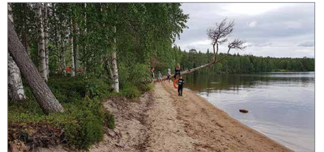
Kyläseuran väki kutsuu vieraita tutustumaan pitkään hiekkarantaan.