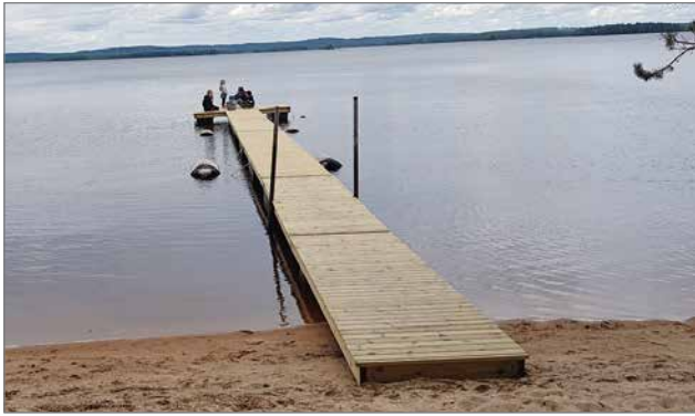
Uusi laituri paikallaan.

Puhoskylässä, Pääahontien varrella on useiden vuosikymmenien ajan ollut paikallisten ja mökkiläisten suosima hiekkainen ja pitkä uimaranta nimeltään Marjonhieda, jota kyläseura on kunnostanut viime vuosina. Sinne on tehty muun muassa uusi laituri. Kunnostustyön valmistuttua, avajaisia vietettiin lauantaina 25.7. ja se oli menestys kävijämäärän suhteen.