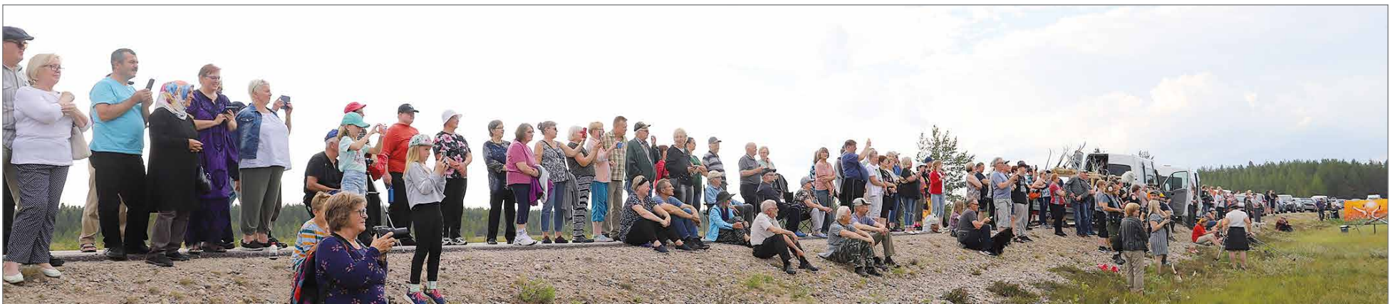
Suokisapaikalle oli sadoilla katsojilla hyvä näkymä Ranuantien penkalta. Tien varressa oli myös yli kilometrin pituinen autojono.