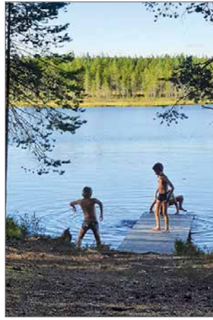
Hampuslammen partiomajalla on hyvä hiekkapohjainen uimapaikka.

Torstaina lähdimme aamutoimien jälkeen pienelle kävelyretkelle Miikanlammelle. Retken aikana kerättiin ja syötiin mustikoita, kuunneltiin kurkien laulua suolla ja tunnustettiin erilaisia metsän kasveja. Lounaaksi tehtiin retkikeittimillä perunamuusia ja lihapullia. Tarpojat suorittivat leirillä keväällä aloittamaansa Luovuus-tarppoa loppuun. Suo-