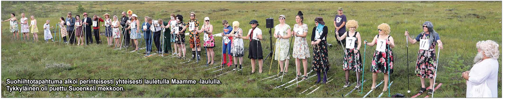
Suohiihtotapahtuma alkoi perinteisesti yhteisesti laulettualla Maamme -laululla. Tykkyläinen oli puettu Suoenkeli mekkoon.