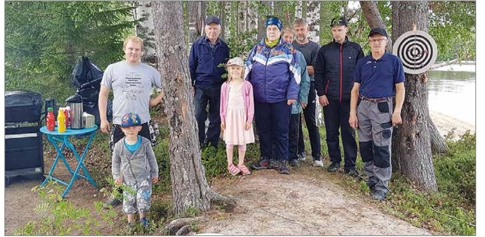
Avajaispäivän talkooporukkaa yhteisessä kuvassa.

makkaraa, juotiin kahvia ja limpparia, sekä kisailtiin tikkanheitossa. Lapsiperheitä oli liikkeellä runsaasti, ja uskaltautuipa jotkut hurjapäät uimaankin, huolimatta todella kovasta tuulesta. Laituri on ollut sittemmin kovassa käytössä, ja mökkiläisiltä on