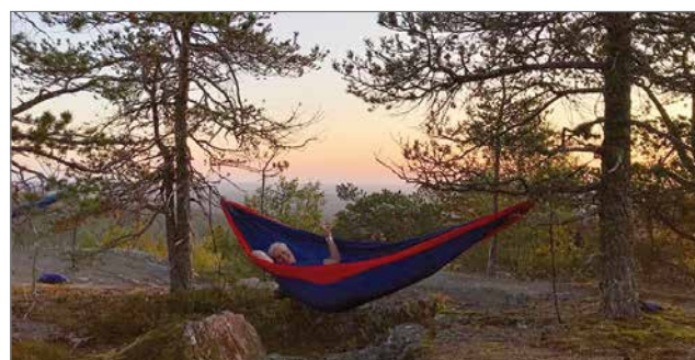
Syötteen huipulla viime vuoden elokuussa ripustettiin riippumatot ja nukuttiin yö mahtavissa maisemissa.