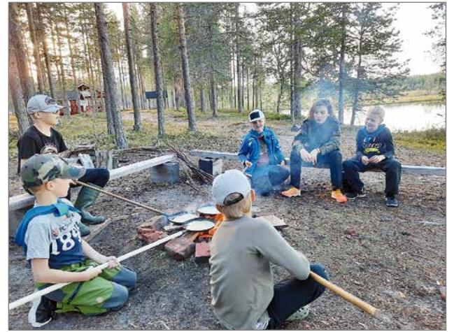
Lettujen paisto onnistui nuotiolla seurakunnan varrellisilla lettupannuilla.

ritukseen kuului mm. näytelmän teko iltanuotiolle Pyhän Yrjön tarinasta. Seikkailijat harjoittelivat kirveen käyttöä, puiden halkomista ja sytykkeiden tekemistä ja sudenpennut treenasivat puukon käyttöä ja kiehisten tekoa. Jokainen sai myös harjoitella sytyttämään tulen tuluksilla. Päivällisenä oli seikkailijoiden tekemää ma-