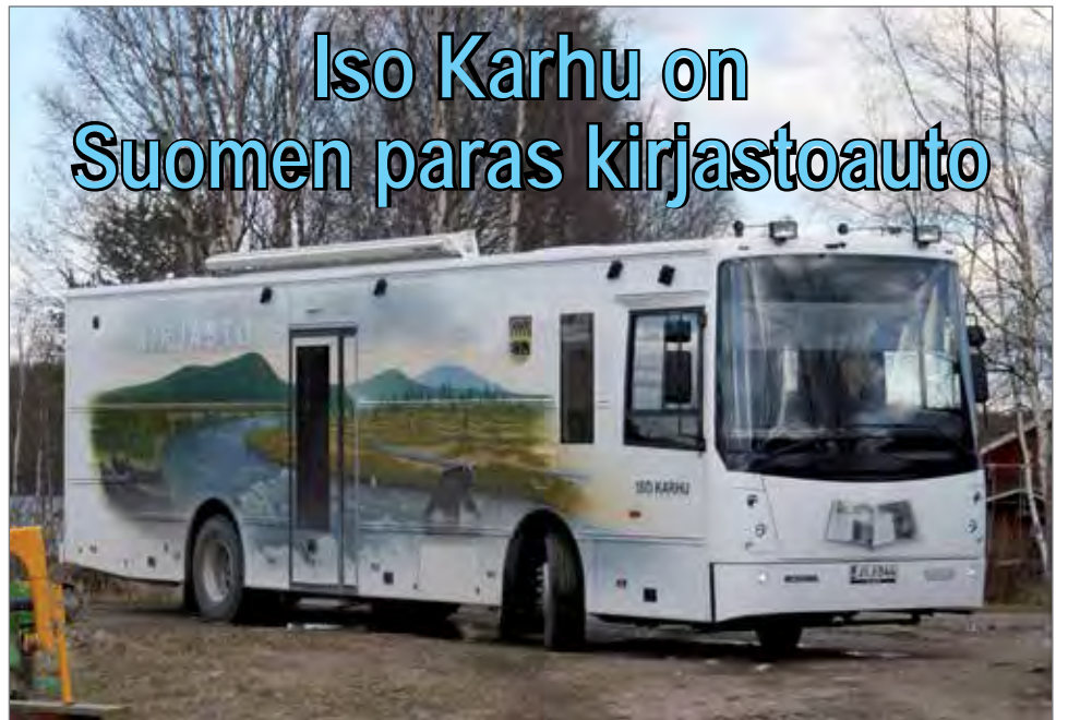
Kirjastoauto Iso Karhu liikennöi vilkkaasti Pudasjärven eri kylillä. Kuvassa auto kaartamassa kuluneena keväällä Putuloiden pihaan Korpisella.

Kirjastoautot kisasivat paremmuudesta Joensuussa 8.-10.8. kirjastoautopäivien yhteydessä. Yleisöäänestuksessa Suomen parhaaksi kirjastoautoksi valittiin Pudasjärvellä tänä vuonna käyttöön otettu Iso Karhu. Suomessa on noin 150 kirjastoautoa ja Joensuussa niistä oli paikalla noin kymmenen.