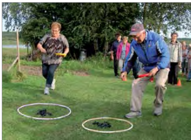
Pyykkipoikien keruussa piti kiirettä (Korento).

mukavassa kesäsäässä mieliä vakavaksi vetänyt yhdesäkään nuotioillassa.