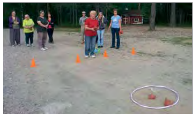
Kuussa oli tarkkakätisiä heittäjiä.

iltahetki. Hartauden ja nuotiolla jutustelun lisäksi ohjelmassa oli leikkimielisiä kisailuita, joista mainittakoon esimerkkinä käpyjen heitto linnunpönttöön, kuormauton veto ja pyykkipoikien kerääminen frisbeekiekoon. Monta naurunpyrkähdystä ja iloista hymyä nähtiin kisailuiden aikana. Eikä makkaranpaisto ja makkaran syöminenkään