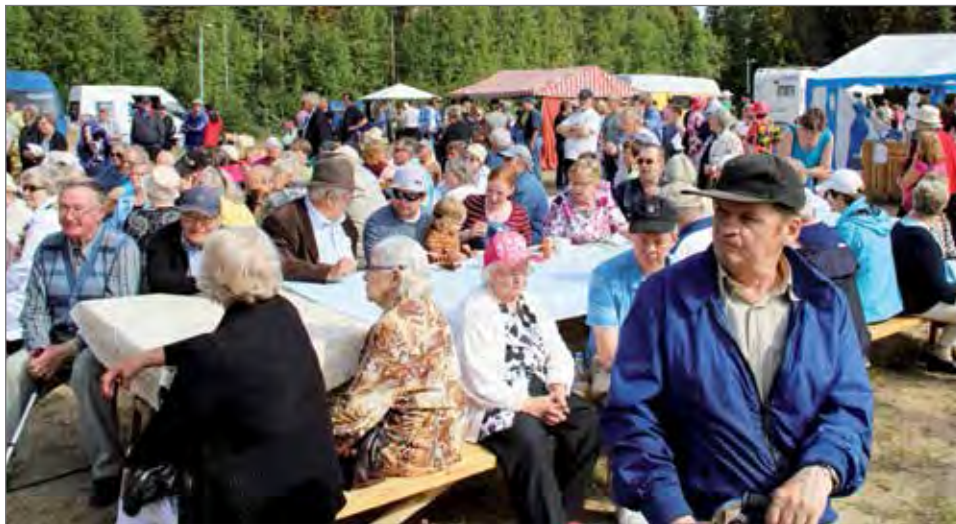
Markkinayleisöä viime vuoden Vattumarkkinoilla.