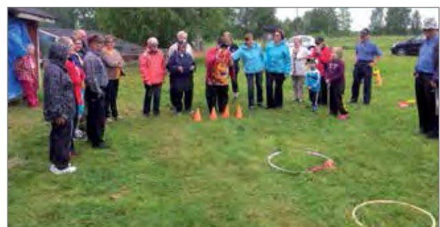
Herne pussin heitto sokkona alkamassa (Livo).