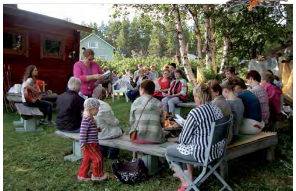
Korenossa valmistauduttiin laulamaan yhteislauluja