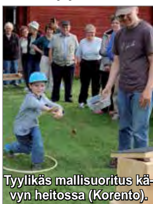
Tyylikäs mallisuoritus kävyn heitossa (Korento).