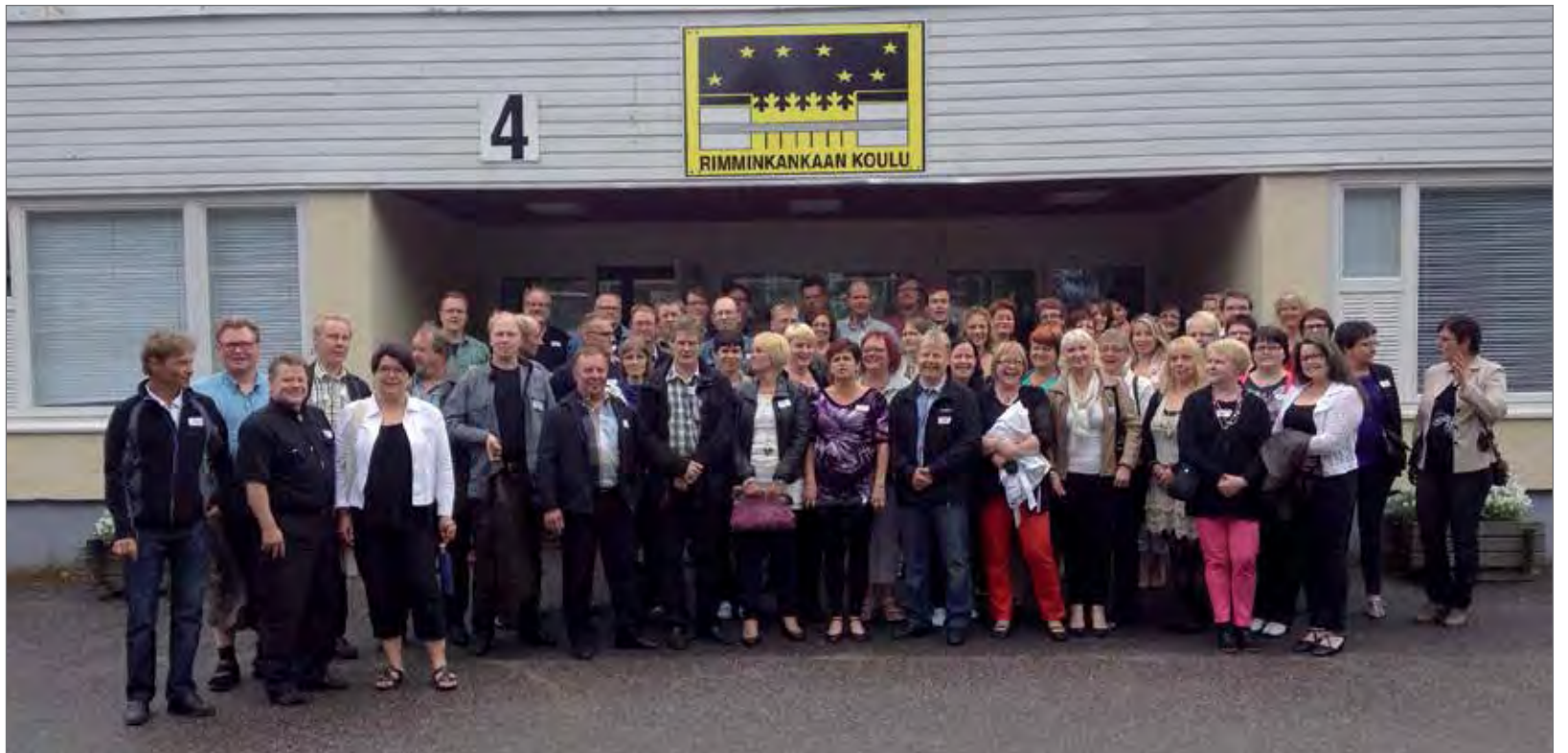
Yhteiskuva vuonna -79 valmistuneista

Pyysimme Rimmiltä listauksen luokittain, kymmenen luokkaa, keskimäärin 30 oppilasta per luokka. Perustimme Facebookiin ryhmän, etsimme luokista vastuushenkilöt, jotka sitten ottivat yhteyttä luokkatovereihinsa. Saimme yhteyden yli 220 henkilöön, joille sitten pistimme kutsut menemään.