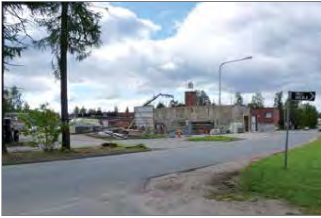
Paloaseman laajennustyöt ovat meneillään, jonka vuoksi tuli kaupungintalon parkkipaikka rakennetaan uuteen paikkaan.