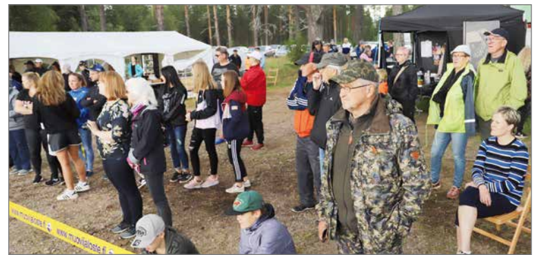
Yleisöä oli joka päivänä paikalla seuraamassa kisa. Eniten sunnuntai-ilta finaalin palkintojen jaon aikana.