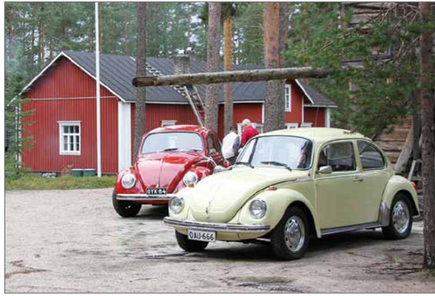
Kuplat olivat kuin kaksi marjaa

Kotiseutuviikon perjantaina oli museolla teemana "Vanhojen autojen, rattorien ja Pappa-Tunturien päivä". Paikalla oli näytillä ainakin kaksi kuplavolkaria, Anglia, Triumph, kaksi ratoria, kuorma-auto ja Pappa-Tunturi.