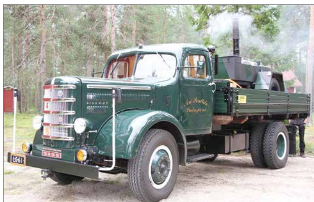
9-tuumaiset Sisun eturenkaat ovat lukkovanteilla, jollaisia ei länsimaista enää saa hankittua.