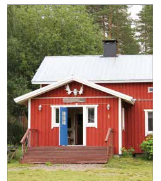
Löytyihän sitä sinistä!