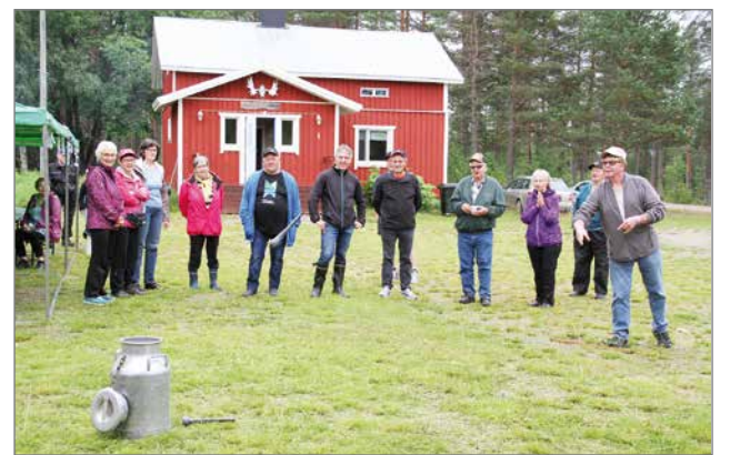
Ensimmäistä nännärimestaruutta ratkottiin heittelemällä lypsykoneen nännikumia 30-litrin maitotonkkaan – ei niin helppoa ensinkään.