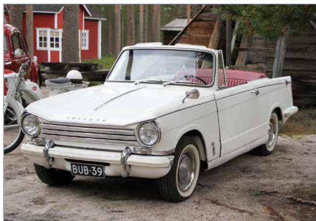
Triumph Herald 13/60 kojelaudassa oli varoituskyltti: "Suuteleminen kuljettajan kanssa ajon aikana ankarasti kielletty". Varoitus on pätevä yhä edelleen!