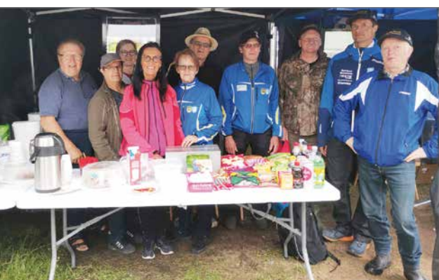
Perjantaina oli Kuntourheilujaoston talkoopäivä. Keskipäivällä oli mukavasti talkooporukkaa paikalla.

Siuruan Kylä ry. kutsui sunnuntaiksi 26.7. suuren joukon vieraita katsomaan ja kokeilemaan erilaisia puuhasteluja sekä ratkomaan mestaruuksia sähkökäsineen Koko perheen Kesätapahtumaan. Paikkana oli Yli-Siuruan Metsästysseuran hirvipirtti Liekokylässä.