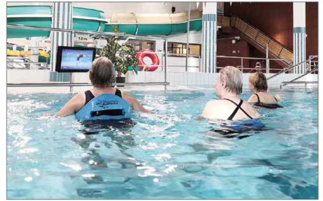
Käyttäjiltä on tullut kiitosta, että pääsee jumppaamaan silloin kun itselle sopii ja voi jumpata myös lyhyemmän jumpan.

tiin keskimäärin 26 kertaa päivässä ja mukana on vain yli kahden minuuttia pyöriineet toistot. Viikkaimpina päivinä toistoja tuli jopa 60 päivässä. Useissa referenssiuimahalleissa on huomattu, että virtuaalivesijumppan myötä on saatu uusia ihmisiä mukaan vesijumppaan pariin ja saatu lisää kävijöitä myös liveohjattuihin ryhmiin. Myös uimahallien kävijämäärät vuositasolla ovat virtuaalivesijumppan myötä nousseet.