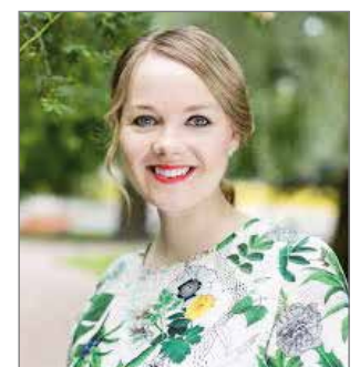
Keskustan puheenjohtaja Katri Kulmuni vieraillee torstaina 30.7. kello 15 S-marketin pihalla pidettävässä ulkoilmatilaisuudessa.