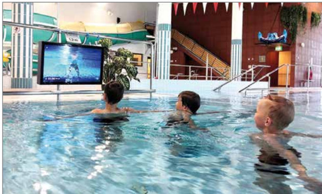
Virtuaalivesijumppan myötä on saatu uusia ihmisiä mukaan vesijumppaan pariin.