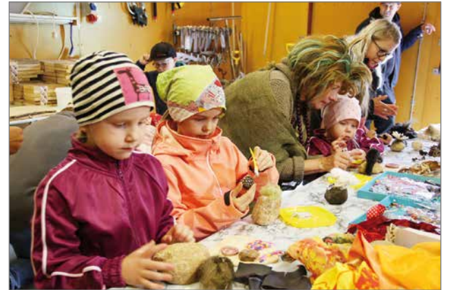
Syötteen Peikkopolulle on valmistumassa uusia asukkaita.