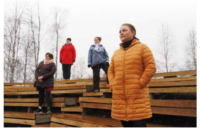
Korona laittoi suunnitelmat uusiksi. Kesäteatteri vaihtui syyssteatteriksi.

Suomen kesä on monesti sateinen ja syksy tuo mukanaan myös koleutta ilmaan.