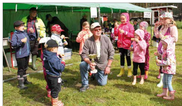
Aarteet saivat arvoisensa avauksen, kun lapset pääsivät puhaltamaan saippuakuplia Nännärimestarin kunniaksi.