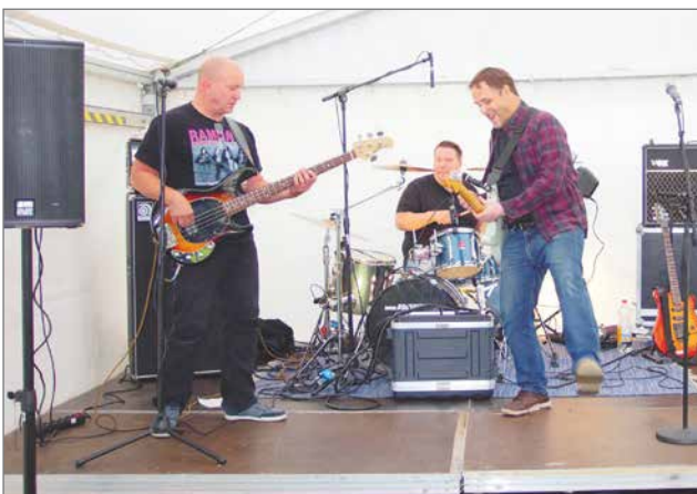
Ronski Beat Trio viihdytti kesäillan vieraita.