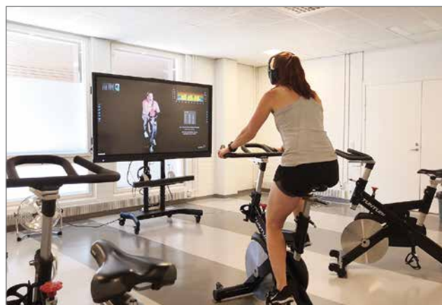
Virtuaali spinning on alkanut heinäkuun alusta liikuntahallin spinningtilassa.