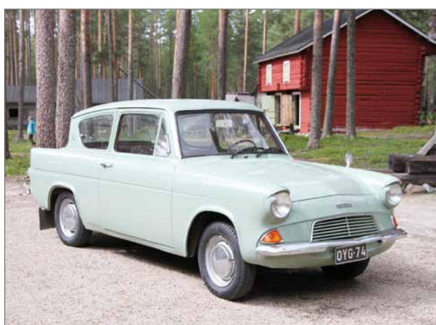
Anglia kaikessa kauneudessaan.