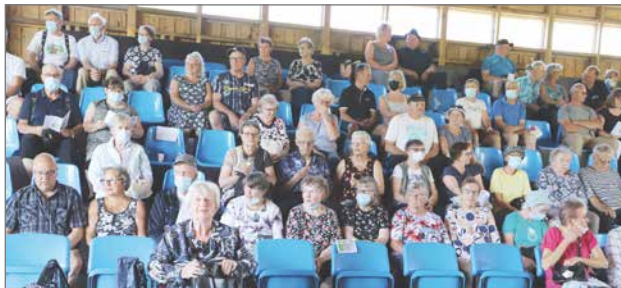
Pudasjärvisille oli varattu paikat keskeltä katsomoa.