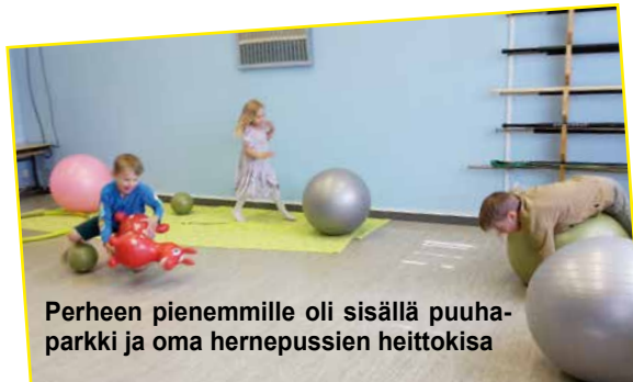
Perheen pienemmille oli sisällä puuhaparkki ja oma hernepussinheitokisa