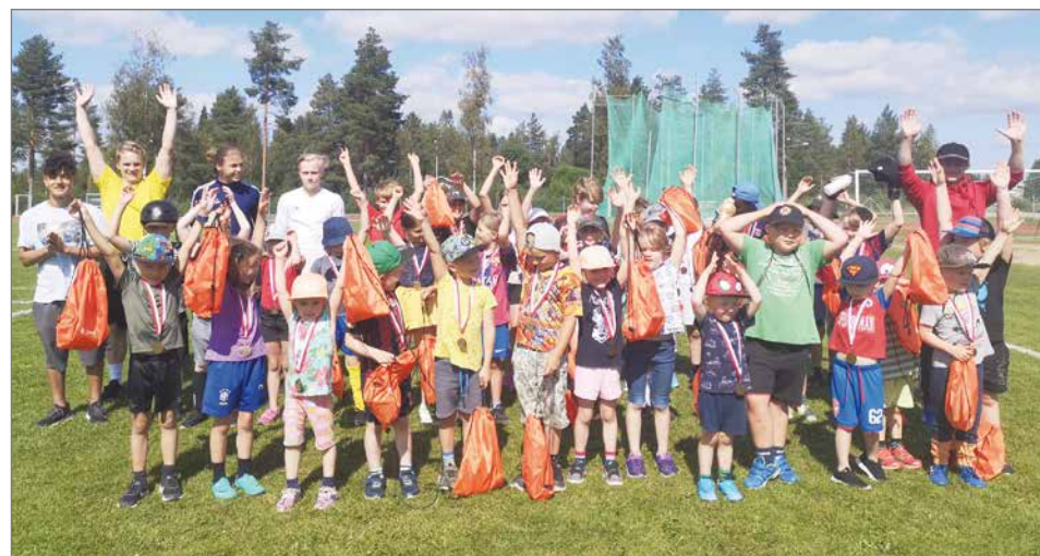
Osallistujat ja ohjaajat yhteiskuvassa koulun päättäneen yhteisviestin jälkeen.