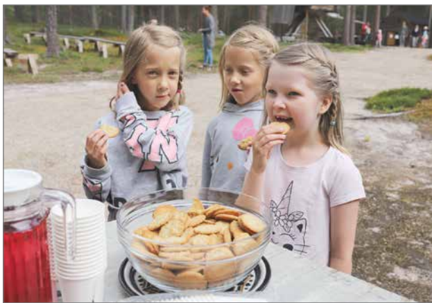
Kotiseutuviikolla lauantaina 24.7. oli lasten museopäivä, jonka ohjelmassa oli mm. askartelua, pihapeljä, museorastit, museotontun tarinoita Niemelän pirtissä sekä kaikille tarjottiin mehua ja keksejä.