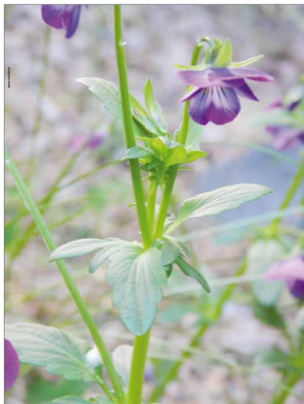
Keto-orvokin varsi on toisinaan hyvin haarainen ja rönsyilevä.

tehokkaampien lääkkeiden kehittymisen myötä. Silti monet ovat pitäneet luonnonrohtoja pehmeämpä-