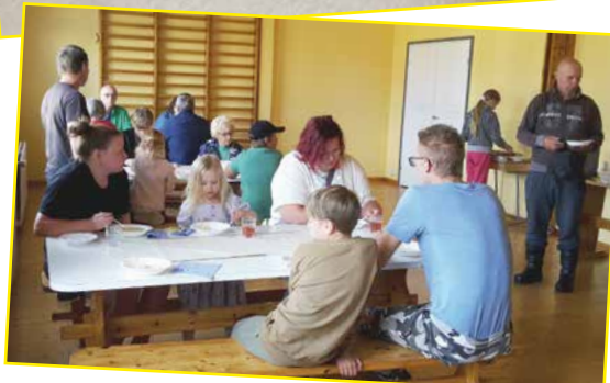
Lohisoppa maistui kesäpäivän kävijöille.