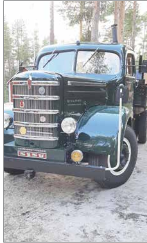
Tumma Sisu K25. Se näytti voimakkaalta ja silti tyylillä kiiltävässä maskissaan.