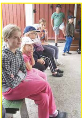
Lapset seurasivat tikankheittoa jännittyneinä.