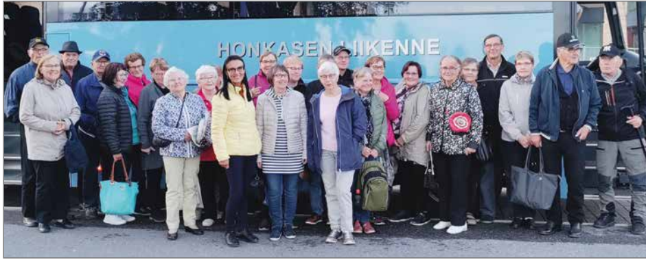
Tyytyväisiä ja iloisia teatteriretkeläisiä kotiutui Suomussalmelta.

Eläkeliiton Pudasjärven yhdistys järjesti 20.7. kovasti toivotun ja kaivatun teatterimatkan Suomussalmen kesäteatteriin Konnat-näytelmän kiemuroita katsomaan. Eihän kulttuurimatka ole mitään ilman kunnon kulttuuriruokailua. Ruokapaikka Herkkusuun seisovastapöydästä jokainen löysi mieleistään syötävää. Ruokailun jälkeen käytiin tietenkin ostoksilla viereisessä karkkitehtaan myymälässä ja muissa ostospisteissä. Näppärästi sujuneen ruokailun jälkeen jäi sopivasti aikaa käydä tutustumassa varsin mainioon parin kilometrin pituiseen Soiva metsä-polkuun. Polun varrella oli rakennettu monenlaisia puusta ja metallista koottuja vempaimia, joita jokainen sai soitella mielensä halusta ja innolla. Perinteiset puiden väliin rakennetut kiikut