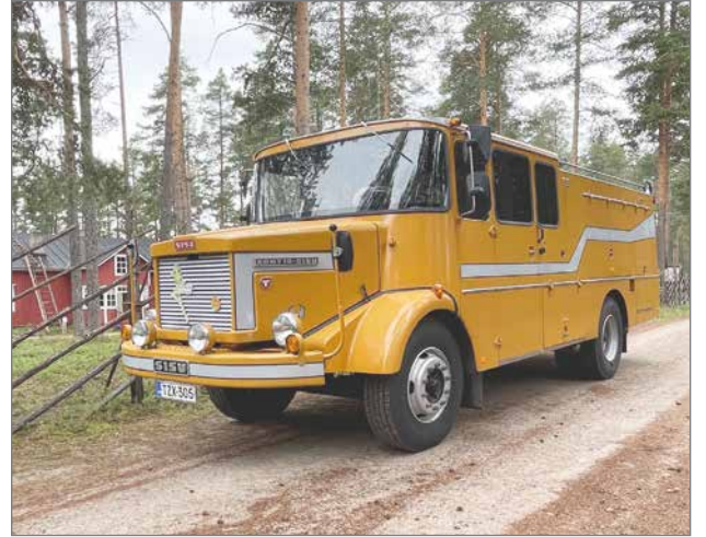
Entisestä paloautosta rakennettu kuorma-auto, joka olikin itseasiassa matkailuauto