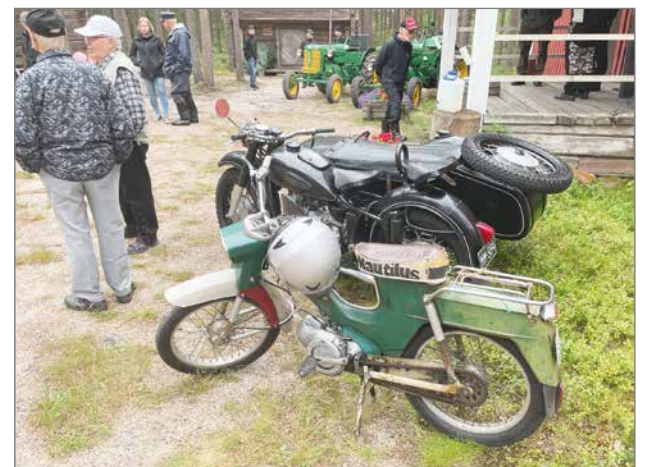
Vanhojen kulkuneuvojen näyttelyssä oli museon pihapiirissä esillä mm. Tunturi mopo, entisöity moottoripyörä sekä kaksi Zetoria, joita paikalle saapunut yleisö ihaili.