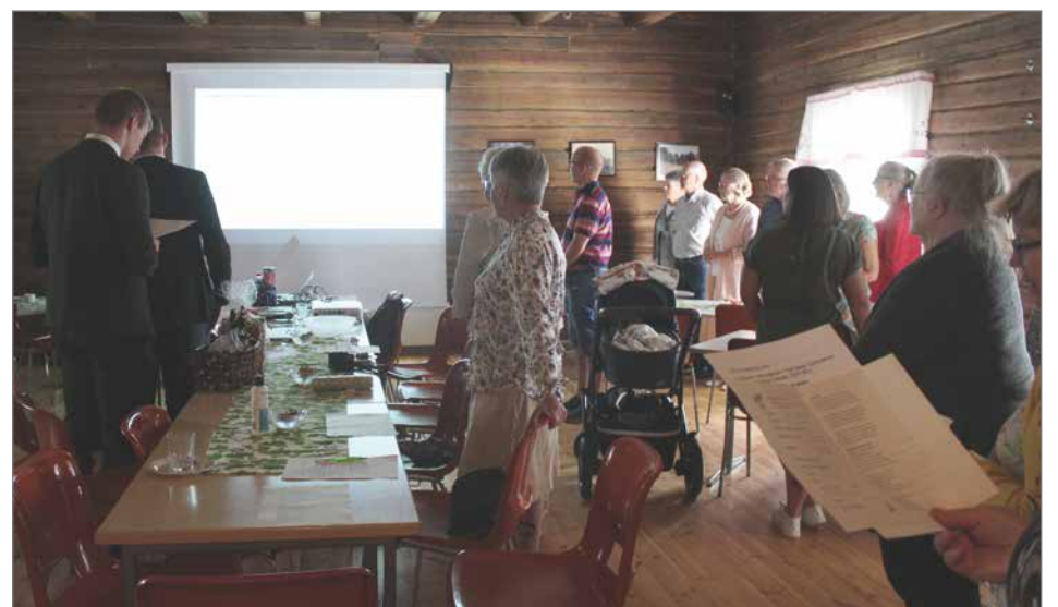
Yhteislaulu Kymmenen virran maa päätti tilaisuuden.