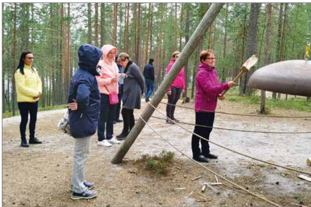
Teatteriretkeläiset Soiva metsä-polulla soittopuhissa.