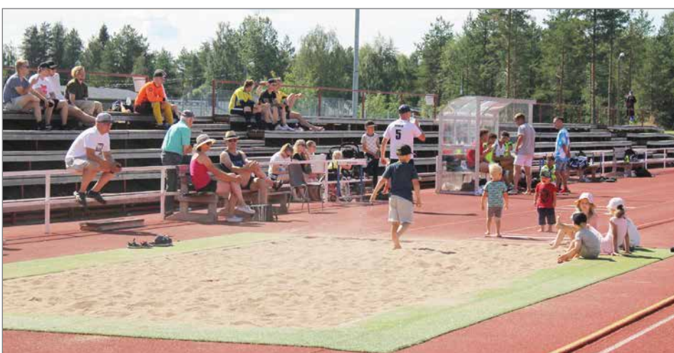
Heinäturnaus on mukava koko perheen tapahtuma, jossa tavataan tuttuja ja sukulaisia vuosienkin takaa.

ja kehuivat Heinäturnauksesta tulleen tilaisuus tavata tuttuja ja sukulaisia kotiseudulla. TN