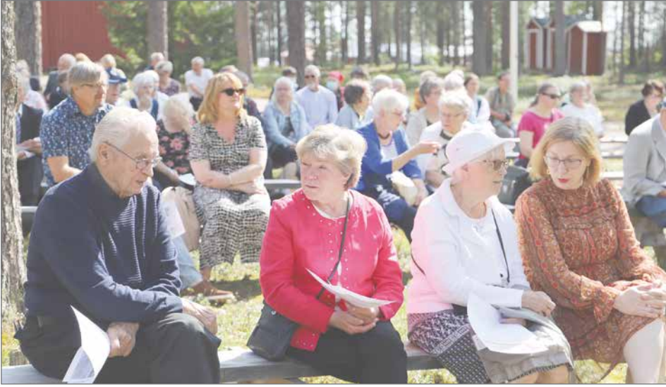
Kotiseutujuhlaan osallistui noin 100 henkeä.