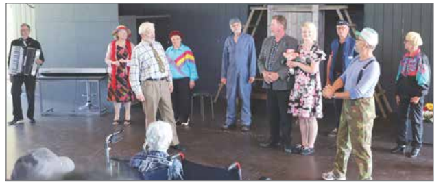
Jokijärvellä on näytelty jo vuodesta 2010. Käytössä on kalettu näyttämö. Tänä vuonna esityksenä on Avioliittosimulaattori.