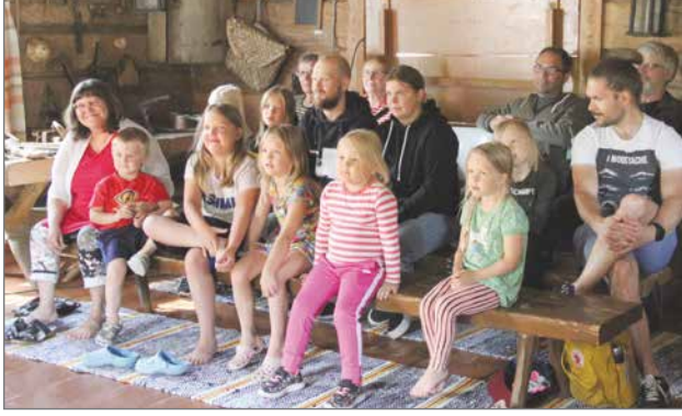
Innostunut ja välillä hieman jännittynyt yleisö eli tarinoiden mukana.

säästy monelta juoksuaskeleelta näyttämötilan rajallisuuden vuoksi.