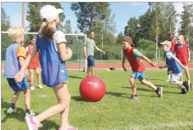
Norsupallo oli alaluokkalaisten suosikkipeli.

FC Kurenpojat ja Pudasjärven Osuuspankki ovat solmineet jo vuosien ajan yhteistyösopimuksen, johon kuuluu mm. Hippo -jalkapallokoulun järjestäminen