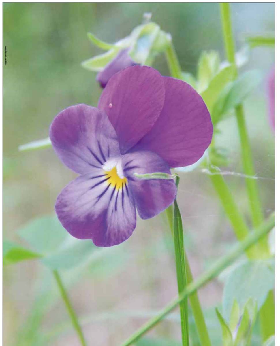
Keto-orvokin väri voi vaihdella hieman, mutta tavallisesti se on violetin sävyinen. Alaosaltaan valkoinen tai kellertävä.

Keto-orvokille läheistä sukua oleva pelto-orvokki on myös runsaasti vähentynyt samoista syistä. Pohjois-Suomessa on ollut vähemmän avoimia ketoja ja niittyjä ja keto-orvokki on joutunut etsimään kasvupaikkoja muun muassa peltojen ja teiden pientareilta. Kasvit, kuten monet muutkin orvokit, ovat myrkyttömiä. Sitä on käytetty myös hyötykasvina. Rohdoskasvina sitä on käytetty niin sisäisesti kuin ulkoisestikin erilaisiin vaivoihin. Kasvi on desifioiva ja soveltuu erilaisiin ihosairauksien hoitoon kuten maitorupeen ja kutinaan. Kasvilla on myös hoidettu yöhikoilua ja ripulia. Keto-orvokkia on saanut kaupparohtona aivan näihin päiviin saakka. Uutteenä ja teenä keto-orvokkia on perinteisesti käytetty yskänlääkkeenä ja kihtilääkkeenä. Nykyisin keto-orvokin käyttö on rajoittunut kuitenkin lähinnä kukkapenkien ja kakkujen koristekäyttöön