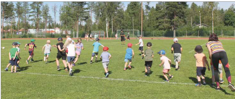
Pienimpien toiveleikki oli Kuka pelkää Huuhkajaa.