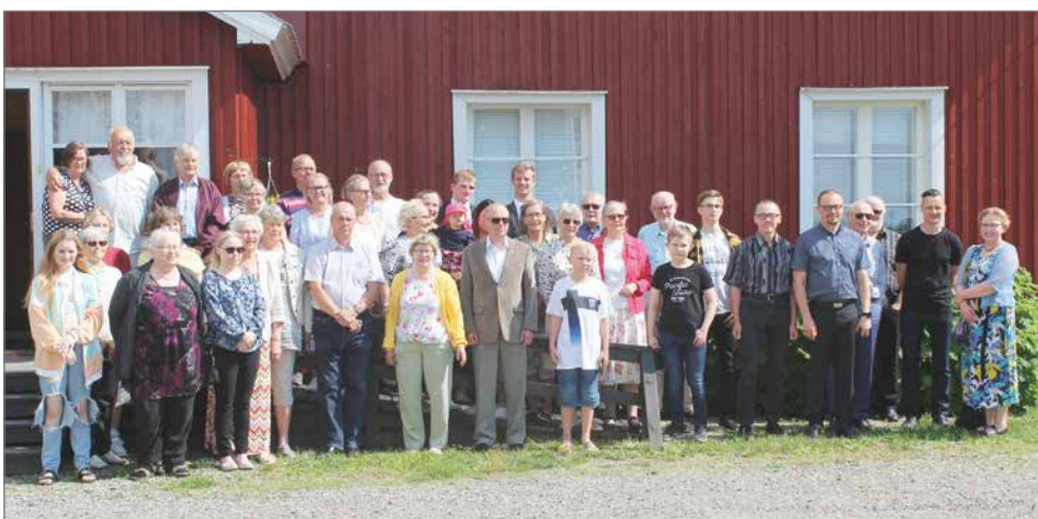
Yhteiskuva Koskenhovin edessä.