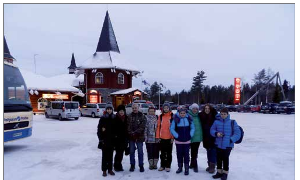
Pääosin leiriläiset viettivät aikaansa Pudasjärvellä, mutta yhtenä päivänä he tutustuivat Rovaniemeen. Siellä he pääsivät Joulupukin juttusille napapiirillä.