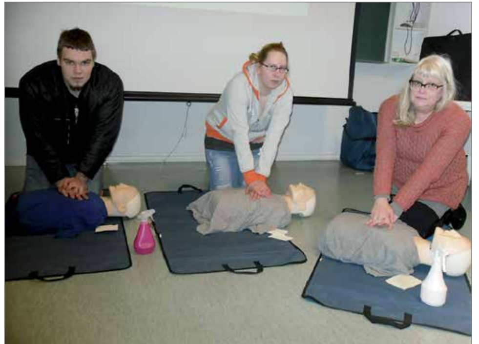
Karhupajan väkeä opettelemassa puhallus-painallus-tekniikkaa ensiapukurssilla.