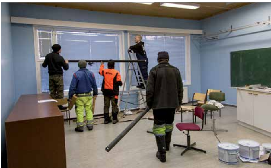
Sinistä touhua. Jonkulaisen kylätalon sinisen salongin viimeistelyä ammattitaitoisen työporukan voimin.

Tulevina hankkeina työporukalle on luvassa muun muassa halon tekoa ja pieniä korjauksia mökkiläisille, jossain vaiheessa kesempänä kylätalo saa uutta maalipin-