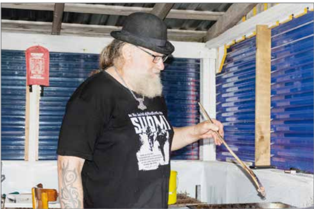
Sika-annokset valmistuivat nopeasti ammattilaisen otteella.