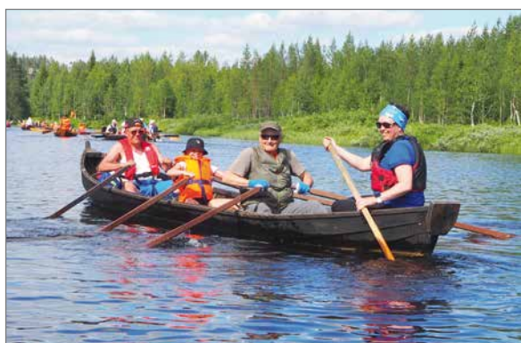
Moni tuli lijoelle koko perheen voimin.