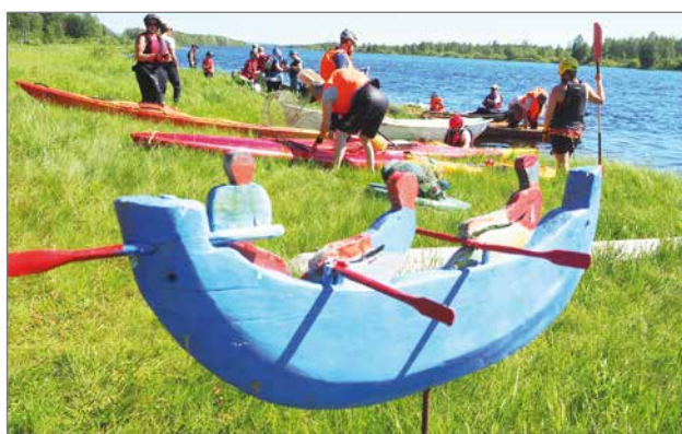
Eeteni on mieluisa pysähdyspaikka. Soutaja-veistoksen taustalla soutuveikää.