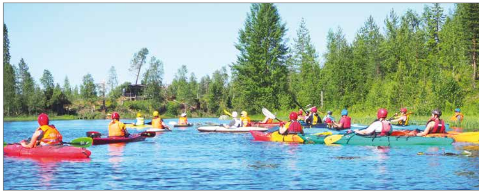
Jokijärveltä lijoelle siirryttäessä saimme todistaa Paula-myrskyn tuhoja.