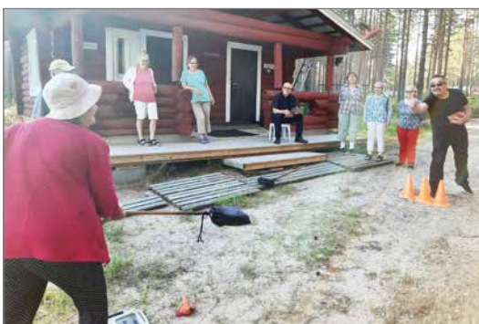
Marikaisjärvellä lätyn heitto sujui onnistuneesti.