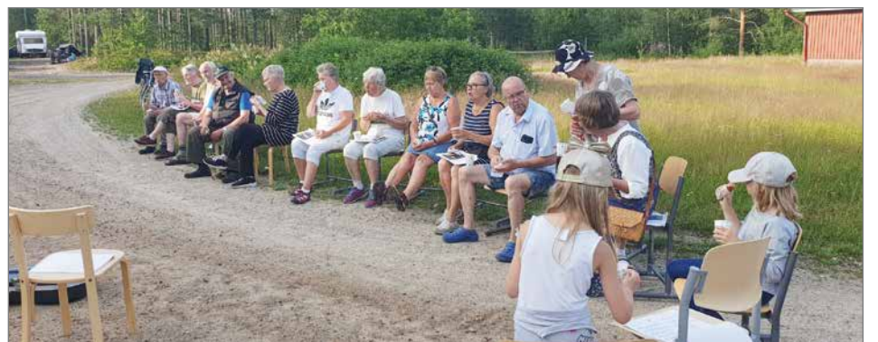
Aittojärven koulun pihalla istuttiin tyylikkäästi penkkirivissä.