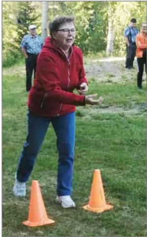
Tästä se heitto lähtee - saatkohan kiinni.

Mukavan leppoisaa seurakunnan nuotioiltaa vietettiin heinäkuun 8. päivänä Siuruan Osakaskunnan laavulla. Sää oli aurinkoisen lämmän, mutta onneksi mukava tuulenhenki vilvoitti olotilaa ja piti "öttiset" loitolla.