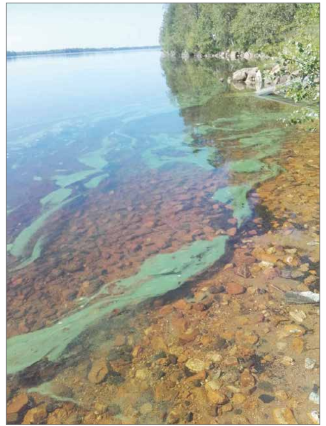
Puhosjärvestä S. Kumpumäen ottama kuva 4. heinäkuuta.