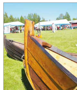
Puuveneet nostettiin rannalle ja väki siirtyi nauttimaan Kipinän kyläjuhlasta.