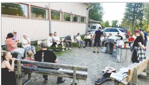
Syötteen kylätalolle kokoontui parikymmentä kyläläistä ja lomalaista.

Seurakunnan nuotioillat jatkuvat sivukyillä. Marikaisjärvellä puhalteli mukavan vilvoittava tuuli pitkän hellejakson jälkeen. Edelleenkin emme päässeet nuotiota sytyttämään metsäpalovaroituksen vuoksi. Herkulliset makkarat kypsentyivät kaasugrillin lämmössä. Illan aikana vaihdettiin kuumimmat hillauutiset ja vietettiin leppoisa ilta Marikaisjärven rannalla.