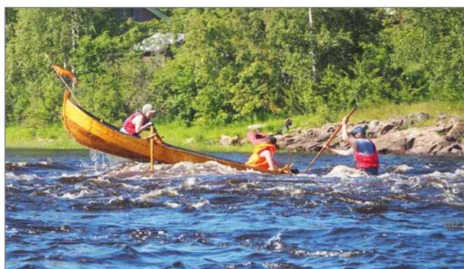
Kaikki veneet tulivat Kipinänkosket hienosti alas. Suurimmat loikat koskessa otti Estelle-vene.