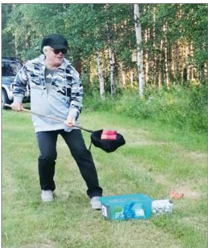
Vaatii tarkkuuta, että saa "lätyn" kiinni.

Tälläkin kerralla väki oli liikkeellä iloisella mielellä ja lähes jokainen osallistui leikkimielisiin kisailuihin. Kisailulajeina olivat onginta kuivalla maalla, sekä "lättyjen paistaminen" parityökentelynä. Makkarat paistuivat grillissä ja Siuruan Kylä ry tarjosi munkkikahvit kaikille osallistujille. Kiitos kaikille mukana olleille mukavasta illasta. HK