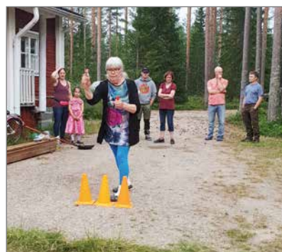
Metsälässä heitettiin maatikkaa.