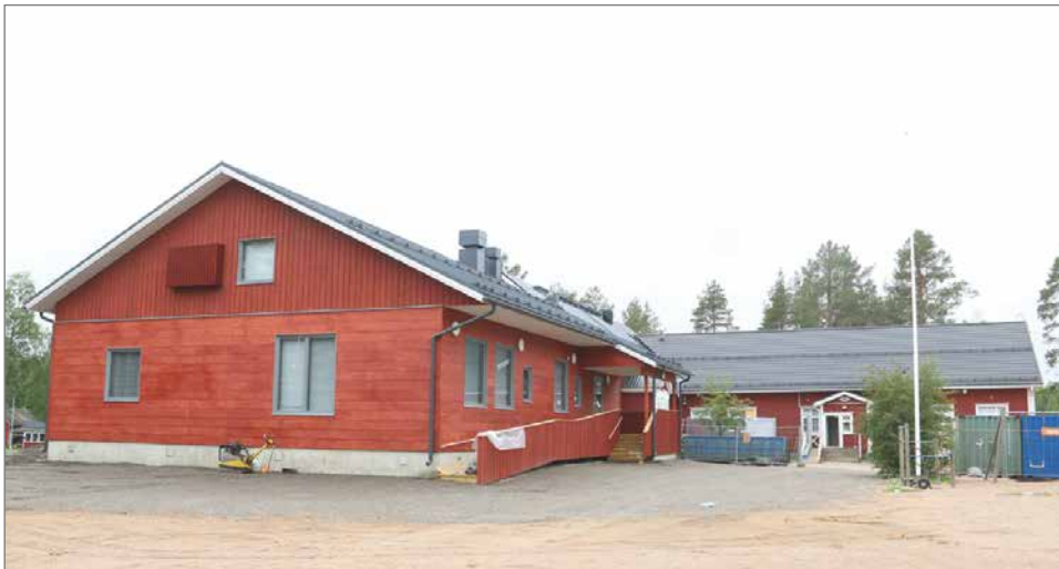
Kipinän hirsikoulu on rakennettu vuonna 1930. Nyt on valmistumassa noin 390 neliön laajennus hirrestä.