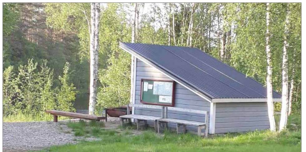
Siuruan osakaskunnalla on vuonna 2011 rakennettu laavu. Laavualueella on järjestetty muun muassa onkitahtumia ja nuotioiltoja ja siellä saa vapaasti vieraila.