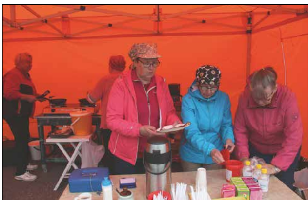
Pudasjärven Eläkeläiset huolehtivat tarjoilupuolesta.