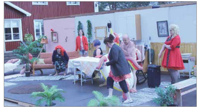
Aurinko paistoi kauniisti maalaistalon pirttiin, johon koko teatteriesitys on rakennettu.

rastajateatteri liitto, Pudas- järven Osuuspankki, Kontio- tuote Oy, Työpetari, Jongun kyläyhdistys, Pudasjärvi- lehti, Apetit ja Perhemarket. Teatteriväki kiittää myös kaikkia talkoolaisia.