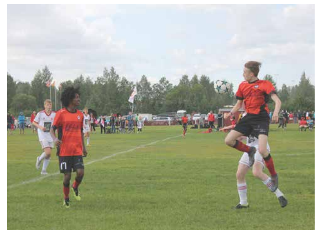
P15 kannusti omien pelien ohella nuorempia seurakavereita ja toimi esimerkkinä pienemmille pelaajille.