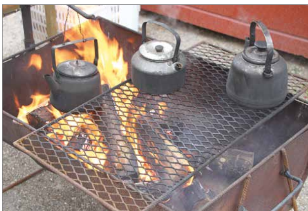
Kurenalan Kyläyhdistys tarjosi rannalla aidot nokipannukahvit.