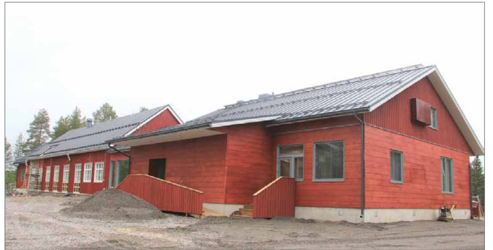
Kipinän koulun laajennuksen seurauksena tulee uutta tilaa koulua ja päivähoitoa varten.

– Samassa yhteydessä on hyvä todeta, että hirsituotannon tuplaaminen ei kasvata painetta hakkuiden lisäämiseen, sillä hirren raaka-