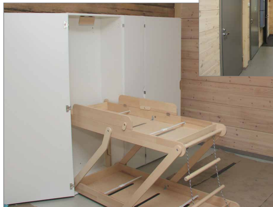
Päiväkodin puolella ovat käytössä kätevät sänkyratkaisut. Ovat kaapin näköisenä pystyssä ja otetaan käyttöön kääntämällä ne alas.

käytöstä esimerkkeinä Kempainen mainitsee iltapäiväkerhotoiminnan, kansalaisopiston kurssit, nuorisotoimen liikuntapiirin