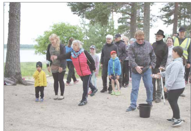
Tarjolla oli erilaisia kilpailuja.