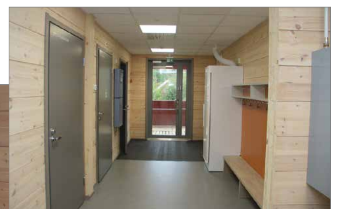
Kipinän koulun valoisa käytävä.