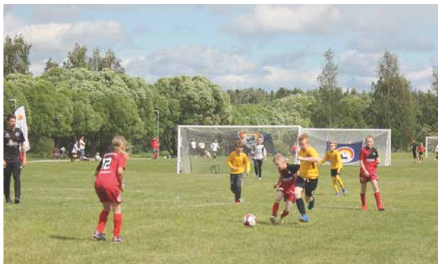
Piteässä pelit pelataam luonnonnurmikentillä. Nurmikenttiä kaupungista löytyykin 19 eri alueella. Jokaisella on 4-10 pelikenttää.