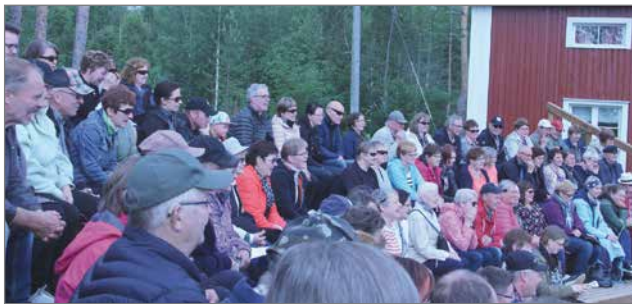
Katsomo oli täynnä yleisöä ja ylimääräisiäkin istuimia tar- vittiin.

12.7. Koskenhovilla. Seuraa- va näytös on keskiviikkona 17.7. sekä ensi viikon lopulla kolme esitystä perjantaina, lauantaina ja sunnuntaina.