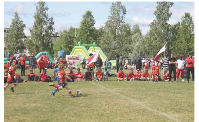
Kurenpojat näkyivät hyvin edustettuina PSG2019-turnauksessa.

Turnaus oli jälleen useimpien pelaajien ja perheiden kohokohta. Turnausjärjestelyt toimivat ja Kurenpojat vakiovieraana saavat loistavan majoituspaikan kisakeskuksen ytimessä. Kotimatalla pienet pelaajat totesivat, että onneksi näitä ei pelata neljän vuoden välein kuten aikuisten arvokisoja, vaan jo vuoden päästä päästään kokemaan jo suurturnaus uudestaan. TN