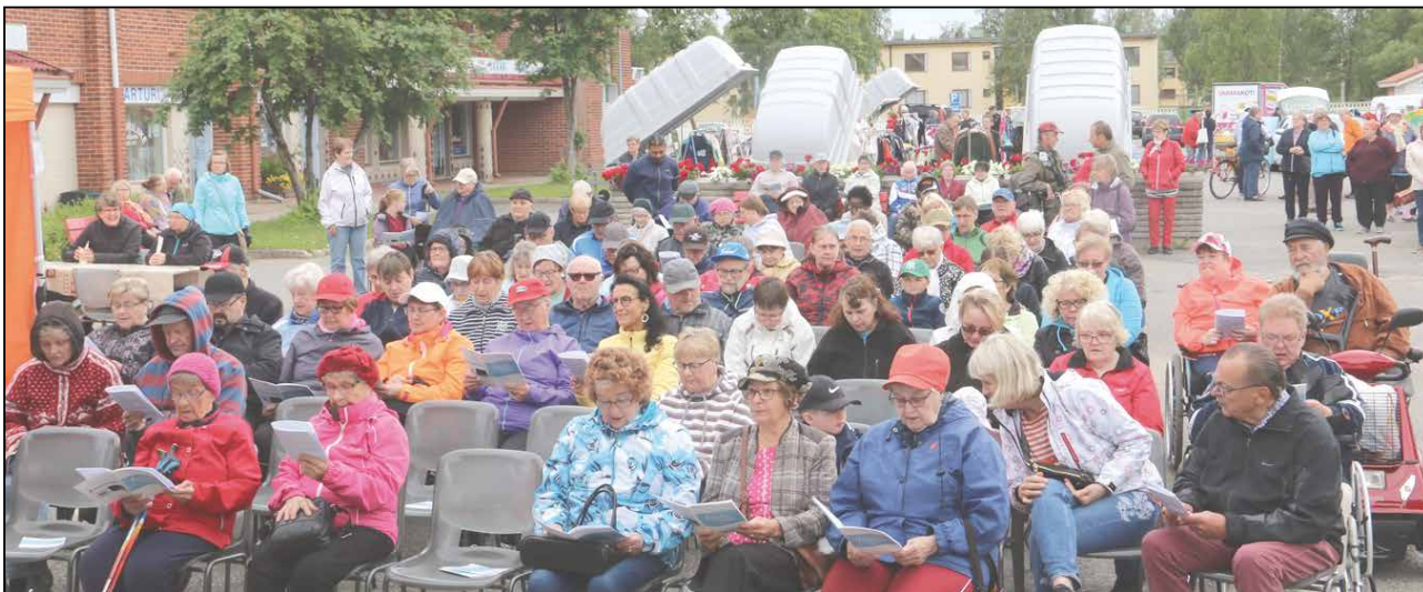
Yhdessä laulaminen toimii tehokkaana tunnelman luojana, vapauttajana ja virkistäjänä!