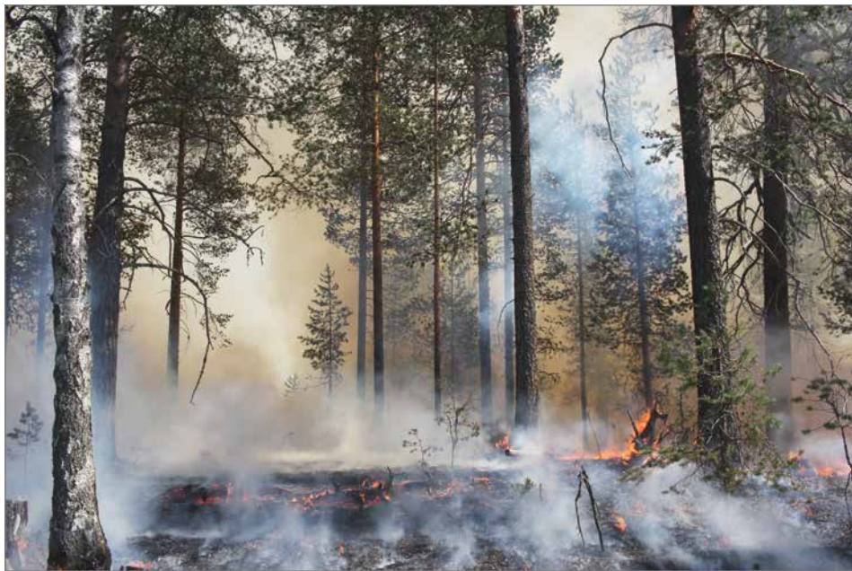
Olvassuon metsänpoltto toteutui 5.7.

Pudasjärven Olvassuolla parannettiin metsien tilaa ennallistamispoltoilla maanantaina 5.7. Metsähallituksen Luontopalvelut poltti noin kymmenen hehtaarin kokoisen alueen. Ennallistamispolto hyödyttävät palaneesta puusta riippuvaisia lajeja ja parantavat siten luonnon monimuotoisuutta.