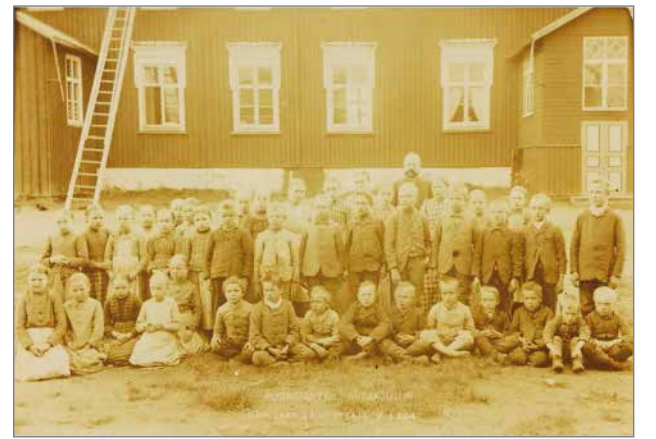
Pudasjärven kansakoulun opettaja ja oppilaita vuodelta 1894.

-Peruskorjauksen hankeselvityksen käynnistysvaiheessa totesimme selkeän tarpeen rakennushistoriaselvityksen laatimiselle. Lakarin vanhat koulurakennukset ovat rakennus- ja kulttuurihistoriallisesti arvokkaita, mikä tulee tiedostaa ja tarkkaan huomioida peruskorjauksen suunnittelussa, jotta voimme säilyttää vielä käyttökelpoiset kokonaisuudet myös jälkipolville. Tehty diplomityö toimii erinomaisena lähtökohdaksi suunnittelulle ja tarjoaa muutenkin mielenkiintoisen katsauksen Pudasjärven