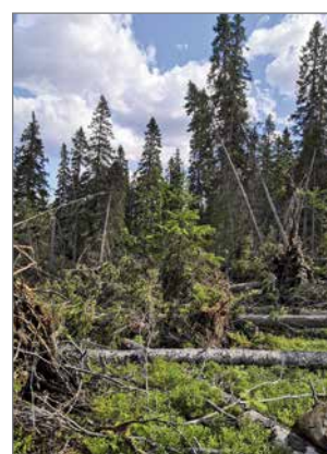
Kupson Kutsun luontopolku on toistaiseksi suljettu myrskyn kaatamien puiden vuoksi.