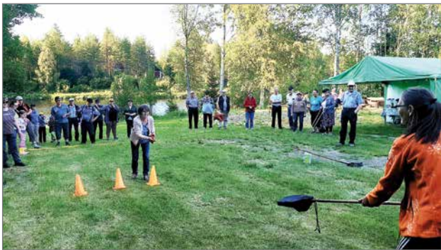
Siurualla jännitettiin toisten kisailusuorituksia. Väkeä oli mukavasti.