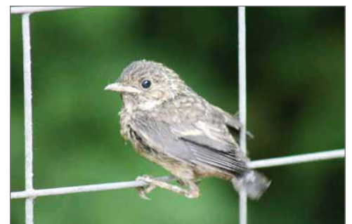
Kaisu Heikkinen lähetti ottamia luontokuvia läheltä pihapiiriään. Orava ja kirjosiopot ovat kesäisissä puhissaan.