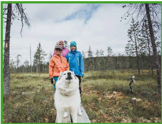
Syötteeltä löytyy runsaasti eri patikointireittejä, joita voi vaihdella ja valita mieleisensä. Kuva Maari Vaahteranoksa.

kesämökkiläisenä lijoen varressa jo 21 vuotta