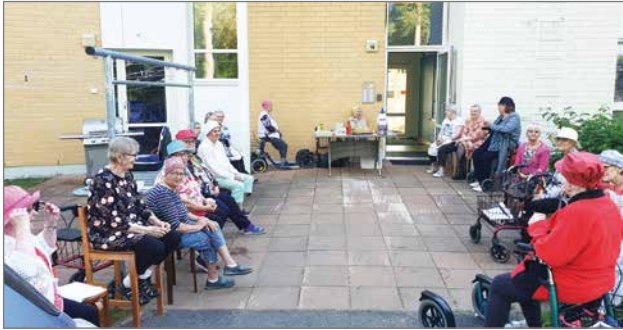
Kaupunginkartanossa nuotioilta on muodostunut jo perinteeksi. Tämän kesän kokoontuminen oli varjoisalla takapihalla