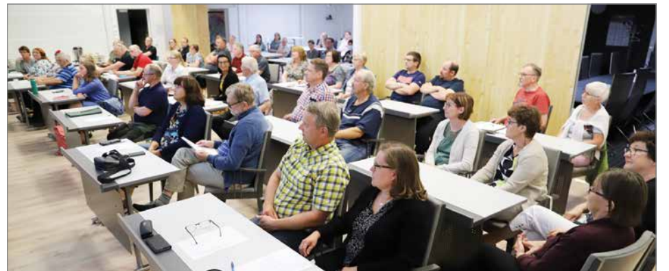
Keskustan ylimääräinen kokous hyväksyi teknillisen vaaliliiton pienpuolueiden kanssa luottamushenkilöpaikkojen valinnassa.