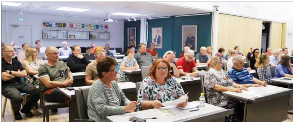
Valtuustosalin täytti Keskustan kunnallisjärjestön kokouksen osallistujia. Lisätalakin otettiin käyttöön salin periosasta.