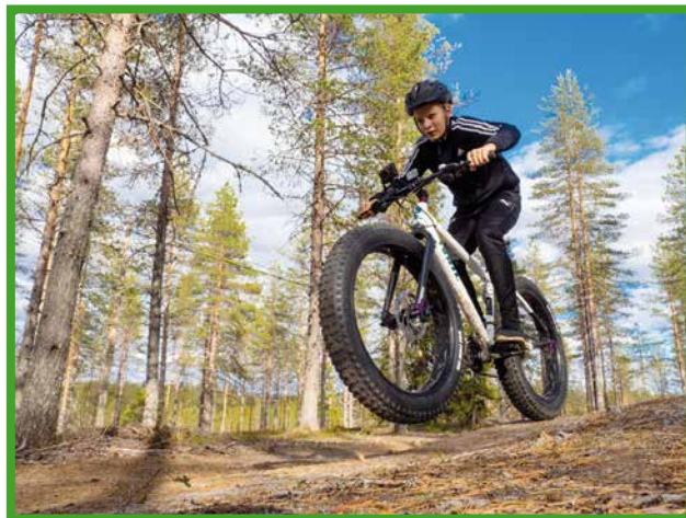
Pyöriä voi vuokrata muutaman tunnin mittaisille reissuille tai useamman päivän pyöräilyretkille.