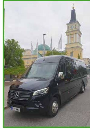
Saaga Travel liikennöi päiväretkibusseja Oulusta Syötteelle kuutena lauantaina 3.7.-7.8.

Elämyksistäajien paikalliset ja lähiseudun asukkaat voivat hakea testatajaksi ja perustella, miksi juuri he ovat rooliin erityisen sopiva. Tärkeintä on, että elämyksistäaja on valmis kertoamaan ja jakamaan omia aitoja kokemuksia koetusta elämyksestä. Elämyksistäajat sitoutuvat tuottamaan lyhyen palautteen elämyksestä sekä ottamaan kuvia ja videota. VisitOulu tarjoaa elämyksen. Sisältöjä jaetaan muun muassa VisitOulun, matkailualueiden sekä matkailuyritysten sosiaalisen median kanavissa. Tavoitteena on, että elämyksistäajiksi saadaan mahdollisimman erilaisia kuluttajia. Elämyksistäajiksi haki tänä vuonna yli 400 innokasta. Tästä joukosta löytyy hyvin eri ikäisiä ja taustaisia ihmisiä. Mukana on niin yksittäisiä ihmisiä kuin perheitä ja kaveriporukoita.