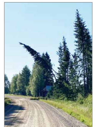
Jaana Hiltulan lähettämä kuva.