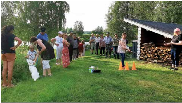
Livolla oli nelijalkaisetkin mukana illanvietossa.