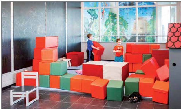
Lasten leikkinurkka on suosittu linnojen rakennuspaikka.

mana jousiammuntaa. Toisen rippileiri hiljentyi illanviettoon maisemaluokassa. Hollolasta asti saapunut esivän nuorisotyön poikaporukka paistaa kodalla pytipannua. Hetken aikaa keskuksen respassa on hiljaista. Nyt on hyvä hetki suunnitella tulevaa: loppukesästä Pikku-Syötteelle on