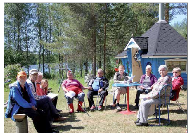
Laulu- ja tarinatuokio.