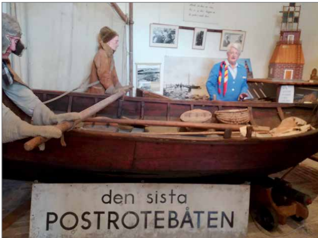
Viimeinen postivene Posti- ja tullitalon museossa. Kuvassa oppaamme kertomassa tarinoita postinkuljettajasta.