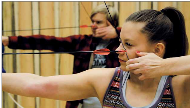
Jousiammunta on yksi ryhmien suosituimmista aktiviteeteista Pikku-Syötteellä.

Rippileirien lisäksi kesällä Pikku-Syötteellä käy useita urheiluseuroja treenileireillään. Syötteen kesäiset maastot tarjoavat urheilijoiden toivomaa haastetta esimerkiksi hiihtäjille, suunnistajille ja pyöräilijöille. Syötteen maastopyöräreitit tunnetaan valtakunnallisesti, mutta monille saattaa olla uusi tieto, että alueen maantiet profiileineen tarjoavat yhden parhaimmista maantienpyöräilykohteista Suomessa. Pikku-Syötteen tilat mahdollistavat urheilijoille myös hyvät puitteet sisäliikuntaan ja kuntosaliharjoitteluun. Nuorisokeskuksen henkilökunta haluaa varmistaa, että puitteiden ja päiväohjelman lisäksi ruoka on terveellistä, monipuolista ja kullekin ryhmälle sopivaa. Keittiö miettii ruokalistat kunkin leirin osalta toimiviksi. Kaikille Syötteen nälkäisille lounaspöytä on avoinna vuoden jokaisena päivänä, myös kesällä. Riparilaille on iltaohjel-