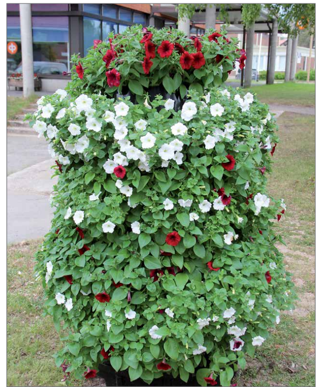
Toria ja ympäristä komistavat kesäkukat.

4H järjesti kukkaset Kurenalan keskustaan ja kyläyhdistys on mukana kuk-