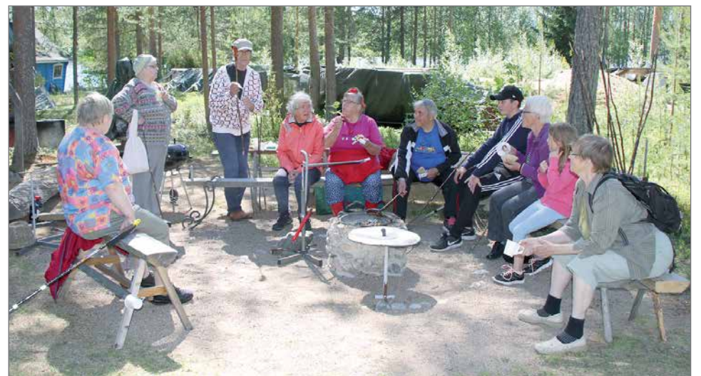
Päivän päätteksi nautimme nuotiomakkaroista.