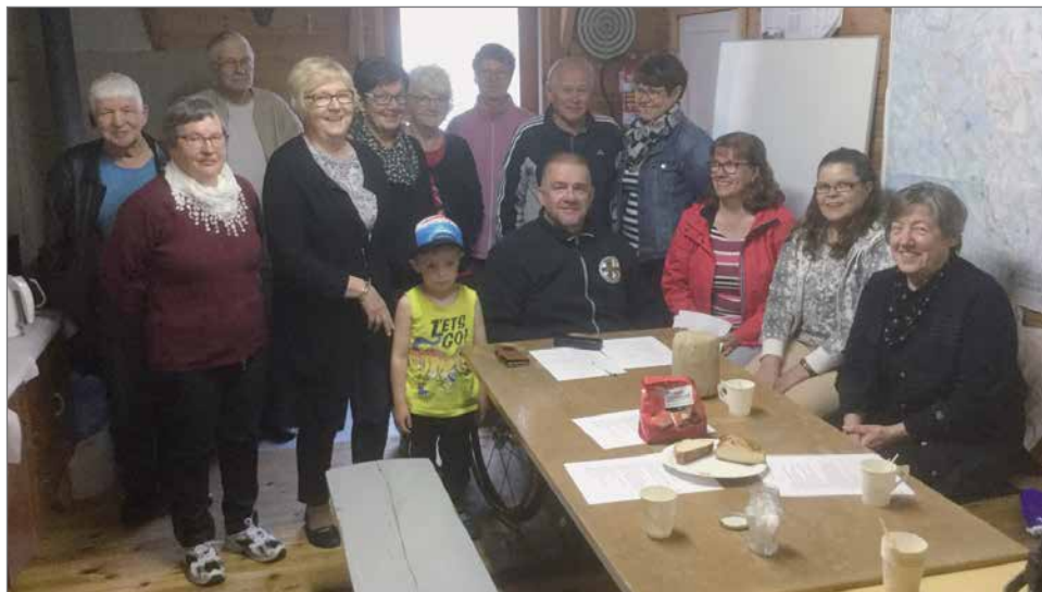
Pärjänsuon entisten oppilaiden aktiivijoukko suunnittelupalaverissa lauantaina 30.6. Hirvihallilla.

Muutama vuosikymmen sitten, kun suuret ikäluokat tulivat oppivelvollisuuskään, tuli Pudasjärvelläkin kiire rakentaa kouluja lisää. Pärjänsuon lapset kävivät pitkien etäisyyksien takana koulua mm. Suvannon vanhalla koululla ja Lapion talossa Pärjänsuon perillä. Ensimmäinen koulurakennus rakennettiin vuonna 1949. Kyseinen koulu paloi keväällä 1954 ja jälleen ol-