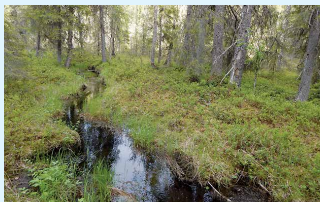
Luonnon muovaama kaunis ja kirkasvetinen puro virtaa Portinkurun pohjalla.

Vanhoissa saaliskarsikkopuissa on merkintöjä onnistuneista karhunkaadoista. Lintulajisto on myös osin sen mukainen ja alueella pesii