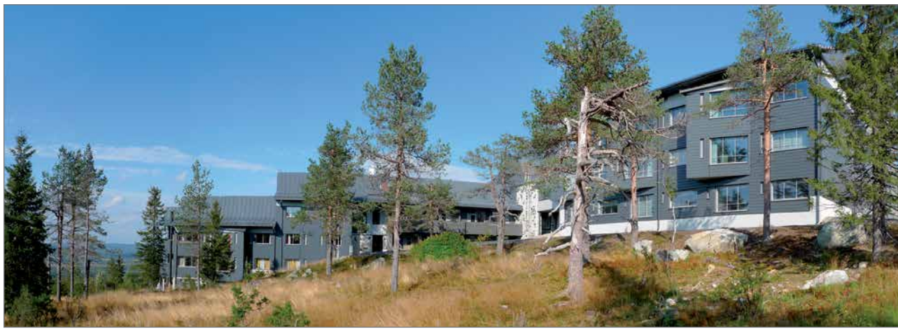
Nuorisoryhmien lisäksi Pikku-Syötteellä voi majoittua kuka vain: valikoimaa löytyy perhehuoneista poremmeellisiin su- periorhuoneisiin.