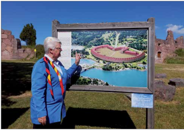
Bomarsundin rauniot. Taulussa näkyy aikanaan rakennettu linnoitus. Taustalla näkyy raunion osia.