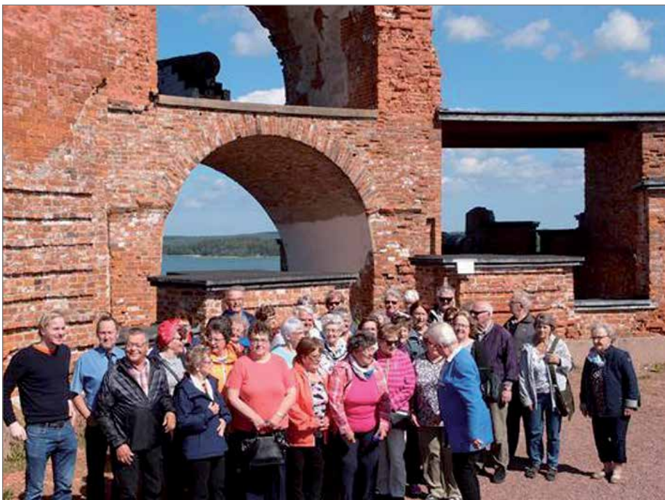
Ryhmäkuva Oolannin sodan alkamispaikalta, josta laukaukset ammuttiin.