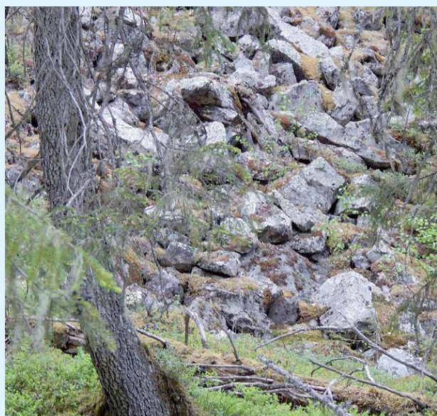
Muinaiset joet ovat huuhdelleet rakkakivikon päältä moreenikerroksen pois.

Portinkurulle pääsee niin pyöräreittejä pitkin kuin patikoiden. Hieman ennen Portinkurua sijaitsee Portinonjan laavu, joka on niin