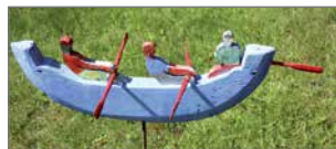
Iijokisoutu on jokavuotinen kesätapahtuma.