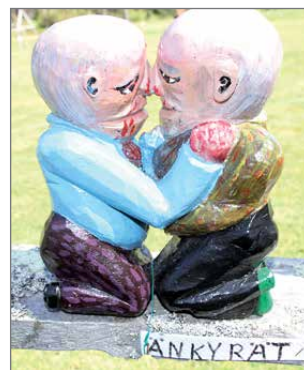
Nimikin sen sanoo....