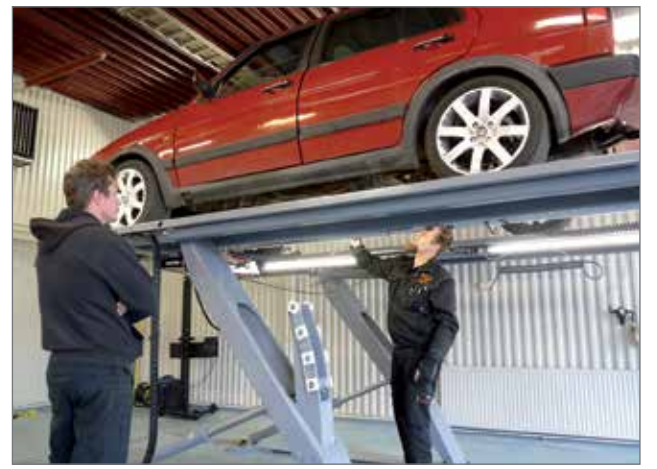
Katsastus Team on toiminut Pudasjärvellä syyskuusta 2015 lähtien Teboilin kiinteistössä.