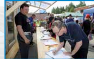
Arpojen myyntiä markkinoilla