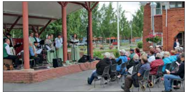
Keskiviikko illalla järjestettiin Laulu ja siirtolaisuudesta -konsertti Pudasjärven torilla. Aiheeseen liittyvien yhteislaulujen lomassa esiintyivät Iin laulupelimannit.

tolaiselämänsä vaiheita "tis- karista sosiaalityöläiseksi".