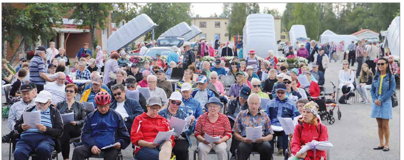
Kuva viime kesän elokuun alun kesätoripäivästä, jossa yhteislaulut veti Suopunkiyhtye ja Sydänyhdistys oli pitämässä lettukahvilaa.