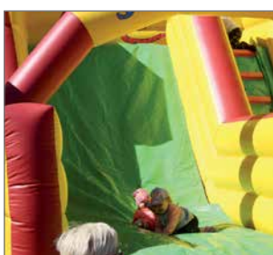
Lapset on pyritty huomioimaan markkinaohjelmassa muun muassa, että alueella on pomppulinna.