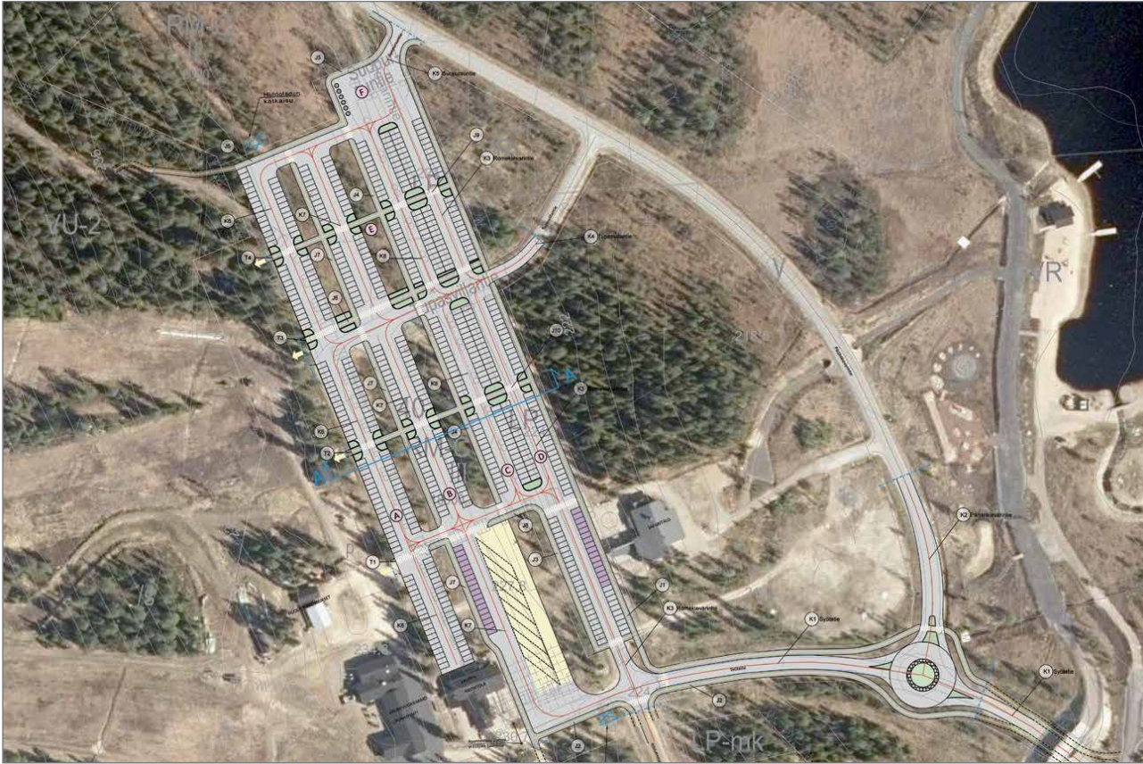
Ramboll Finland Oy:n on laatinut Syötteen tulevista liikennejärjestelyistä alueen suunnitelmakartan.