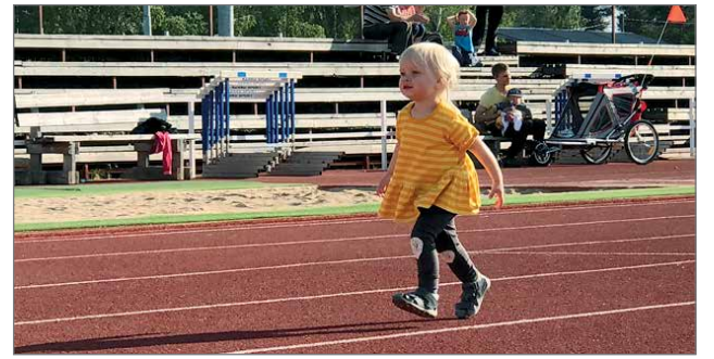
Tyttöjen 5v 60 metrin juoksusta tyylinäyte.