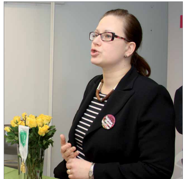
Kansanedustaja Marisanna Jarva vieraili Pudasjärvellä viime eduskuntavaalien aikaan.

Tavoitteena on purkaa turhia normeja, ei lisätä niitä myöskään jatkossa. Tästä ja kansalaisten kuulemisesta päätöksenteossa viimeisin esimerkki on liikennepalvelulaki, johon oli tulossa matkailuyrityksille kuljettajakohdainen ajolupa. Tämä olisi vaikeuttanut merkittävästi matkailuyritysten toimintaa kausiluonteisten työntekijöiden suuren määrän vuoksi. Kuljettajalupien haku olisi ollut lisäbyrokratiaa ja kallis investointi matkailuyrittäjille. Matkailijoita on voitava palvella jatkossakin jouhevasti ja heti kesän matkailusesongin aikana. Liikenne- ja viestintäministeriö ei toivonut kuljettajalupia aiemminkaan, mutta lau-