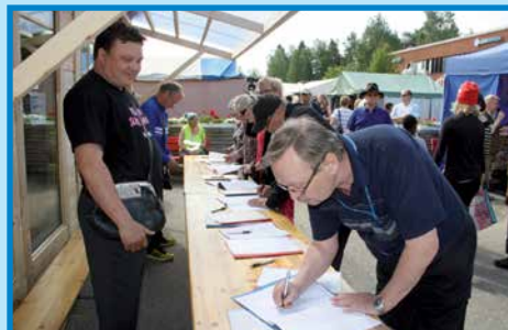
Arpojen myyntiä markkinoilla