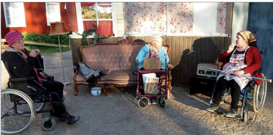
Palvelutalo Iltakuutamon asukkaita askarruttavat monetkin ongelmat.