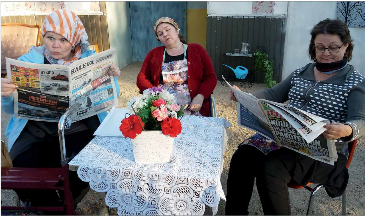
Rapistuneeseen palvelutaloon silloin tällöin ilmestyvistä sanomalehdistä saa lukea Euroopan Unionin uusista hömpötyksistä.