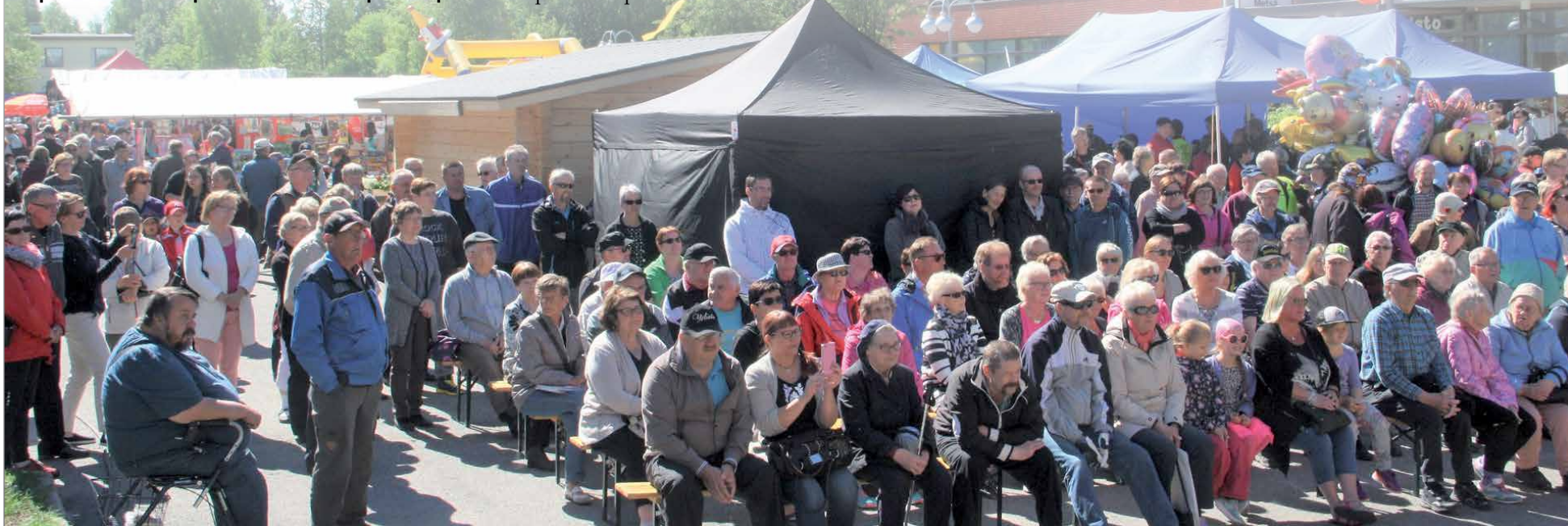
Markkinoilla arvioidaan vierailevan 10 000 henkeä. Viime vuoden markkinayleisöä oli aika ajoin jopa tungokseen saakka. Viime kesän tapaan markkina-alue on laajennettu torilta myös viereiselle ns. Hartsun alueelle.

sa. Pienen alun jälkeen Pudasjärven markkinat ovat nousseet paikkakunnan suurimmaksi kesätapahtumaksi. Markkinoiden järjestäjänä on edelleen Pudasjärven Yrittäjät ry. HT