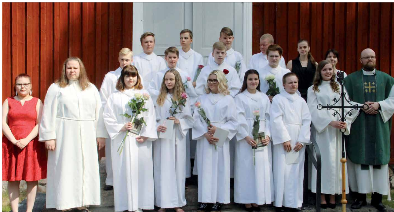
Sunnuntain 17.6. konfirmoitiin 13 rippikoululaista.