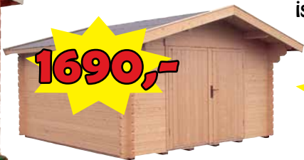
LilleVilla VARASTO/LITERI 390x300 cm