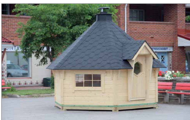
Markkinoilla on perinteisesti Pudasjärven Yrittäjien järjestämät arpajaiset, jossa pääpalkintona on tänä vuonna grillikota, joka on ollut torilla jo kesäkuun puolivälistä nähtävänä. Lisäksi voittoina on kylpytynnyri ja soutuvene. Arpoja on ollut myytävänä pudasjärveläisissä liikkeissä ja markkinoilla yrittäjillä on arpalistat eri kansioissa, jonne voi kirjoittaa nimensä sopivaksi katsomansa arpanumeron kohdalle. Arvonta on toisena markkinapäivänä lauantaina kello 15.