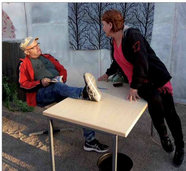
Herra johtaja. Joku eläkeläisryhmä pyrkii puheillenne...