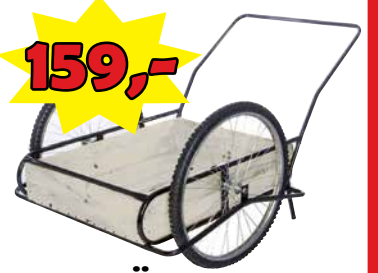
KOTTIKÄRRYT 90 l puhkeamattomalla renkaalla