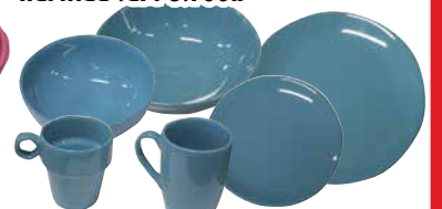
Kaisa ASTIASTO harmaa tai petrooli

MUKI 1,90 Pinottava MUKI 1,70 MUROKULHO 2,10 SYVÄ LAUTANEN 2,30 LEIPÄLAUTANEN 1,90 RUOKALAUTANEN 2,60