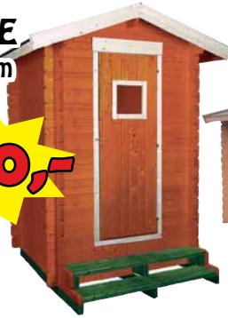
LilleVilla MIKKELI 300x300 cm