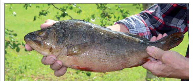
Lähes 1,5 kg ahven laitetaan ruoaksi savustuspöntössä.