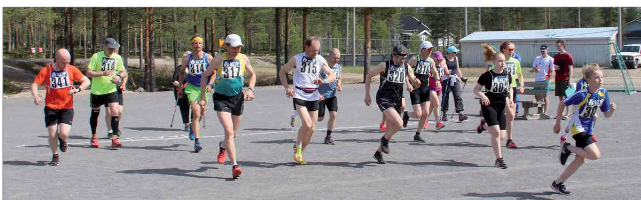
Lähtölaukaus on pamahtanut juoksijoille ja sauvakävelijöille.