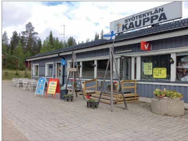
Tihiset ovat uudistaneet myymälää ahkerasti kolmen vuoden aikana. Kaikki pinnat sekä hyllyt on uusittu.

siaalinen elämämme pyörii pääasiassa kaupan tiloissa, hymyilee Tarja ja toivottaa kaikki kyläläiset, mökkeilijät ja muut matkalaiset kahville ja jäätelölle rupattelumaan. RM