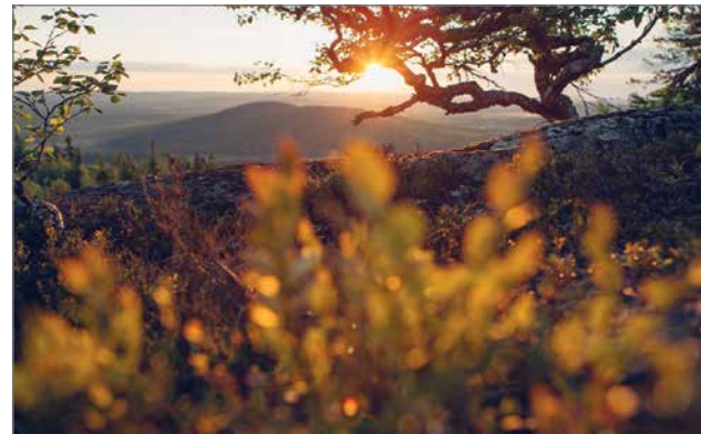
Pikku-Syötteeltä löytyy perheille monenlaista tekemistä. Tarkemmat tiedot hotellin vastaanotosta.

pattaa kannattaa suunnata Pikku-Syötteelle heinäkuun lopulla, kun kyläyhdistys järjestää tanssitapahtuman Kesäjamit, jossa voi opetella uusiakin tansseja.