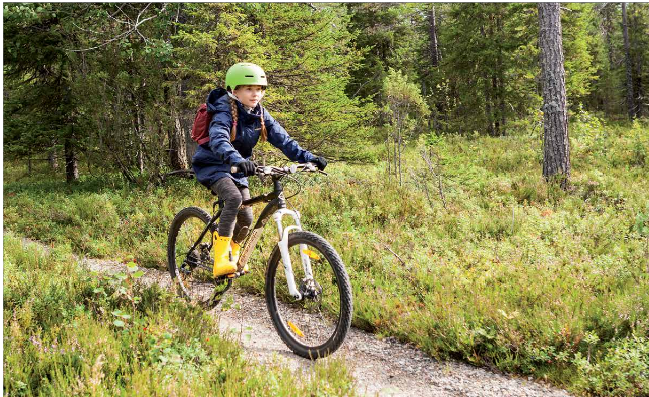
Nuoriso- ja vapaa-ajankeskus Pikku-Syötteeltä voi lähteä maastopyöräilemään. Tänä kesänä voi vuokrata myös fatbiken.

Pikku-Syötteen kausi jatkuu läpi kesän monipuolisen toiminnan kautta. Kesäisin Nuoriso- ja vapaa-ajankeskus on hyvä paikka viettää myös vaikkapa kesähäät tai sukujuhlat. Pikku-Syötteellä ollaan syystäkin tyytyväisiä lisääntyneestä kesämat-