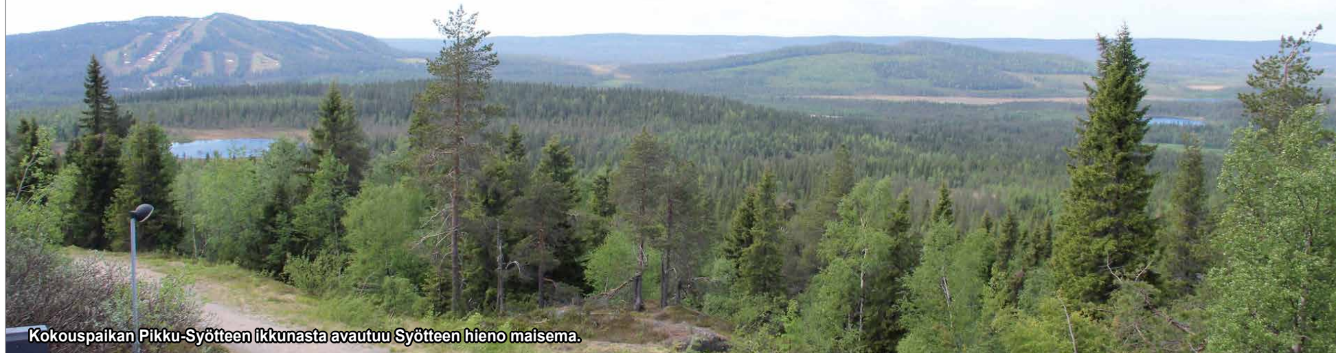
Kokouspaikan Pikku-Syötteen ikkunasta avautuu Syötteen hieno maisema.

mielikuva Syötteen matkailualueesta tulee olla Ketolan mukaan mielenkiintoinen ja haluttava, turvallinen ja lapsiystävällinen, lähin ja hel- poiten saavutettava tunturi-/ lappielämysalue sekä ympärivuotisesti houkutteleva. HT