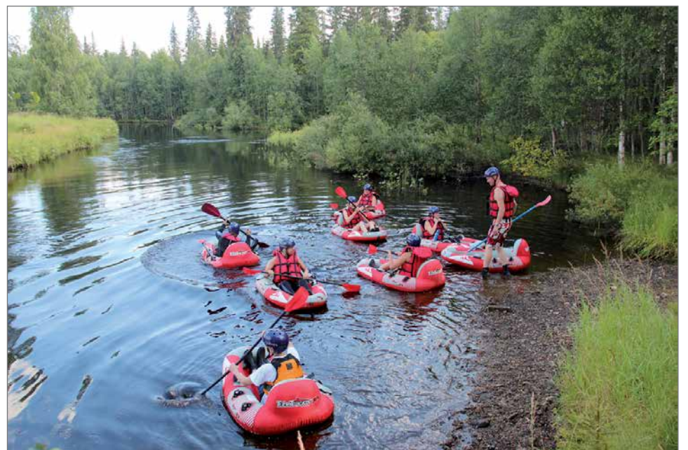
Rivertubing on kesän hittituote ja se sopii urheilumuotona kaikille.