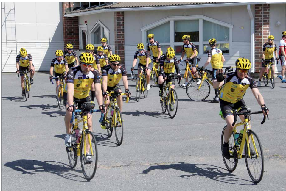
Tauko on ohi ja edessä Livon kautta 70-80 kilometrin polkeminen Iso-Syötteelle.

Profin Oy:lle kurvasi lauantaina 16.6. Kuusamon tieltä lähes 100 reipasta ja hyväkuntoista Syöte-pyöräilyyn osallistujaa sekä heidän huoltajat. He olivat lähteneet Oulusta ja päämääränä oli Iso-Syöte, josta pyöräilivät sunnuntaina takaisin Ouluun. Koska tavoitteena oli noin 200 kilometrin päivämätkä, pyöräilijäryhmä teki mutkan Yli-Iissä ja Profinilta lähdettiin Syötteelle vielä Livon