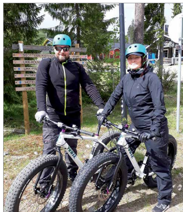
"Nyt pyöräillään Syötteen kierros" tuumasi keskusvaraamolta Fatbiket varannut pariskunta.