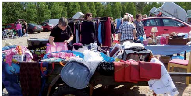
Kirpparikansaa tekemässä löytöjä.