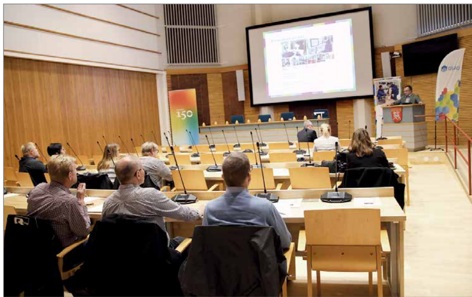
Tiedotustilaisuus keräsi paikalle yrittäjiä ja muita koulutuksesta kiinnostuneita.