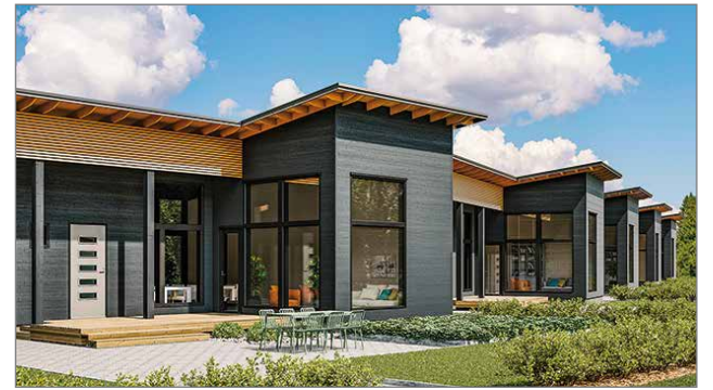
Rivitaloissa ja palvelurakennuksissa teollisen hirren käyttö on vasta alkanut, mutta on nyt markkinakatsauksen mukaan selkeässä kasvussa. Kuvassa Kontiotuotteen rivitalo.