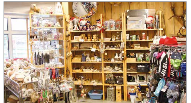
Kylmäsen lahjavaranurkkauksesta löytyy pienempää ja isompaa matkamuistoa sekä kortteja postitettavaksi.