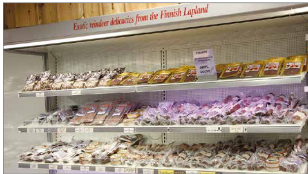
Kaikenlaiset poro- ja palvituotteet ovat myydyin artikkeli Kylmäsellä.

Viime kesänä itsensä läpi lyönyt jäätelötiski on tänä kesänä Kurenalla ainoa paikka, josta voi ostaa italialaista irtojäätelöä joko aitoon vohveliini tai pikariini. Italialaista IL Primo jäätelöä löytyy