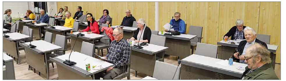
Keskustan Pudasjärven kunnallisjärjestön vuosikokouksesta lähetettiin puolueen puheenjohtaja Katri Kulmunille tsemppiviestin ja toivomus, että hän toimisi edelleen pohjoisen Suomen edustajana valtakunnallisessa päätöksenteossa.

Kokous keskusteli kunnallispolitiikan ajankohtaisista asioista. Kaupungin talouden kuntoon saamiseksi tulee tehdä aktiivisesti työtä. Suuri merkitys on myös Oulunkaaren kuntayhtymän menokurilla. Oulunkaaren toimiminen yhteistoiminta-alueena kunnallisten itsenäisten ratkaisujen sijaan tuottaa nykyistä taloudellisempaa palvelutuotantoa. Palvelurakenteen muuttaminen korjaavasta työstä ennaltaehkäisevään toimintaan tulee myös sekä taloudellisesti että inhimillisesti nykyistä edullisemmaksi.