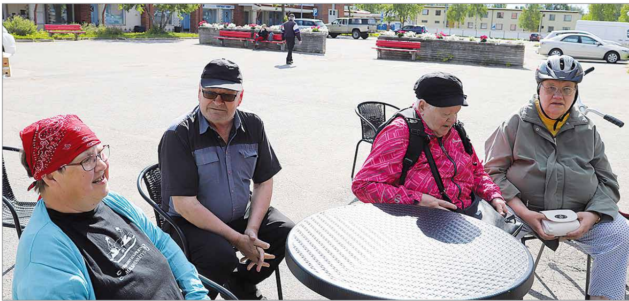
Juuri avatun torin Tietopisteen ensimmäiset asiakkaat viihtyivät kesäisen lämpimässä säässä.