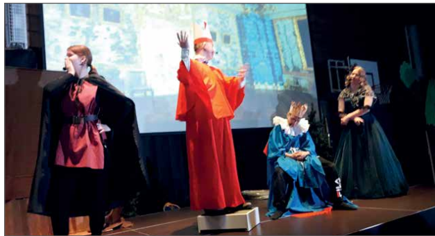
Ilkeä ja vallanhimoinen kardinaali neuvoo Ranskan kuningatarta esittämään vaimolleen toiveen käyttää kaulanauhaa suuressa juhlassa.