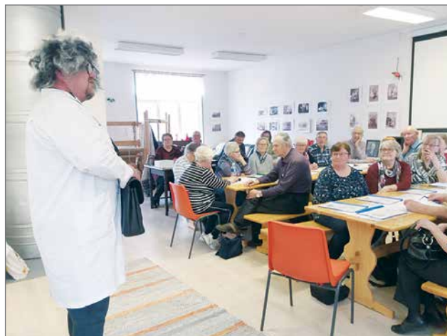
Rohvessori Julukku kävi mainostamassa hoitokonsejiaan ja uhkaili lopettaa kaikki eläkkeet, koska kaikki vieraat olivat hänen mielestään nuoria ja työkykyisiä.

Pudasjärven eläkeläiset vierailivat tiistaina 4.6. Korpisen kylätalolla tutustumassa kyläläisiin ja kyläseuran toimintaan. Vierailupäivä sujui mallikkaasti, sillä vierailijat ihastelivat maisemien lisäksi kyläseuran aktiivisuutta.