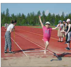
Suojalinnalla vietettiin hellepäivää aktiviteettien parissa.

Monelle viikon kohokohta oli varmasti pyöräretki Pudasjärven rantaan, jossa lapset pääsivät uimaan, syömään retkieviä sekä ihastelemaan maisemia lintutor-