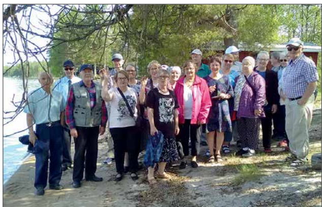
Virtapiiriläiset Puhoksen Marjohiekan rannalla.