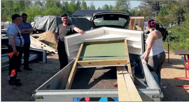
Osa talkooväestä lähdössä viemään paikoilleen yhtä monista tehdyistä ilmoitustauluista.