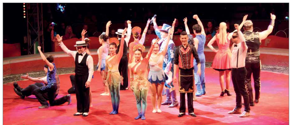
Esiintyjät kiittämässä yleisöä.

-On tärkeää saada suomalaisten sirkusten ja taiteilijoiden historia talteen. Jos me emme sitä tee, niin kuka sit-