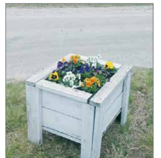
Kukka-asetelma Kipinän risteyksestä.

on istuttanut myös kukkia tienvarteen piristämään kyläläisiä ja ohikulkijoita.