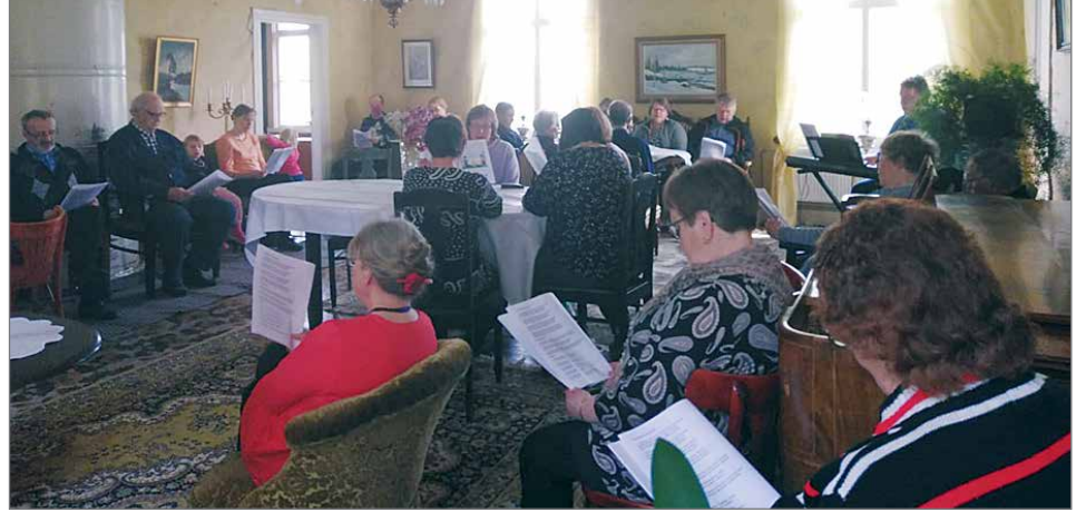
Hirvaskosken kartanoon kokoontui kesän ensimmäiseen lauluiltaan liki 50 henkeä.