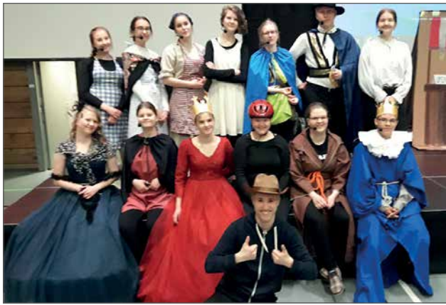
Iloinen näyttelijäporukka lavalla.