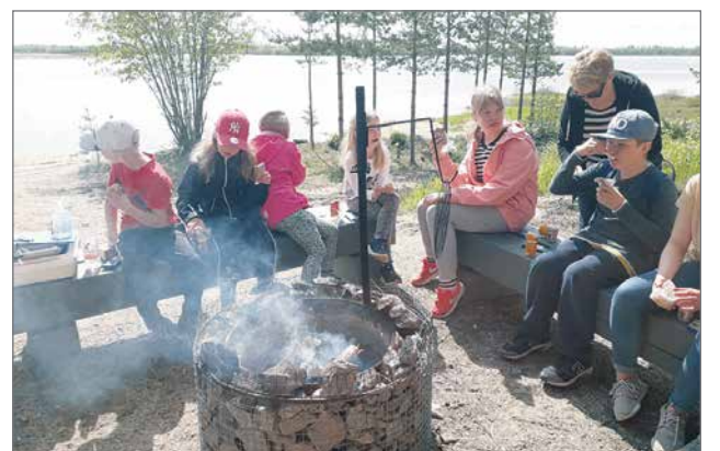
Pyöräretkellä Pudasjärven rantaan lapset pääsivät uimaan, syömään retkieviä sekä ihastelemaan maisemia lintutor-