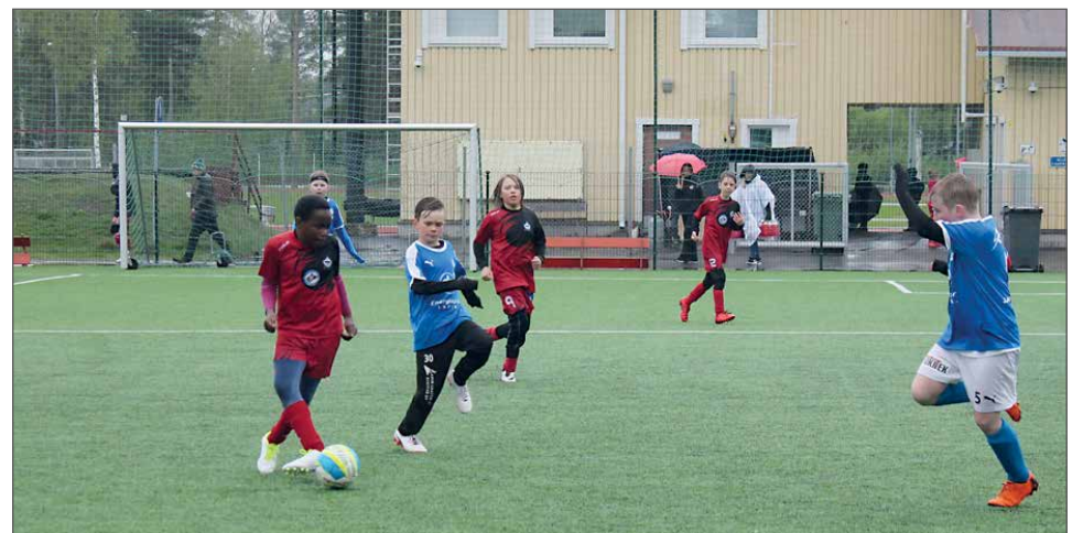
Sää vaihtui turnauksen P11 turnauksen aikana sateiseksi, mutta se ei Kurenpoikien menoa hidastanut. Viimeisessä ottelussa RoPS kaatui 9-2 lukemin.

Pudasjärven tekonurmi-kenttää on kehuttu maakunnan parhaaksi kentäksi, ja tämä näkyy joukkueiden haluna osallistua paikkakunnalla järjestettäviin turnauksiin. Vaikka jalkapallo onkin tarkoitettu pelattavaksi aidoilla nurmilla, on kaupunkimme tekonurmi ns. uuden sukupolven alusta, joka