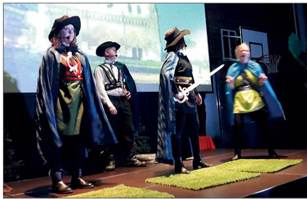
Kolme muskettisoturia ottavat urhean Dartonin mossipojakseen.