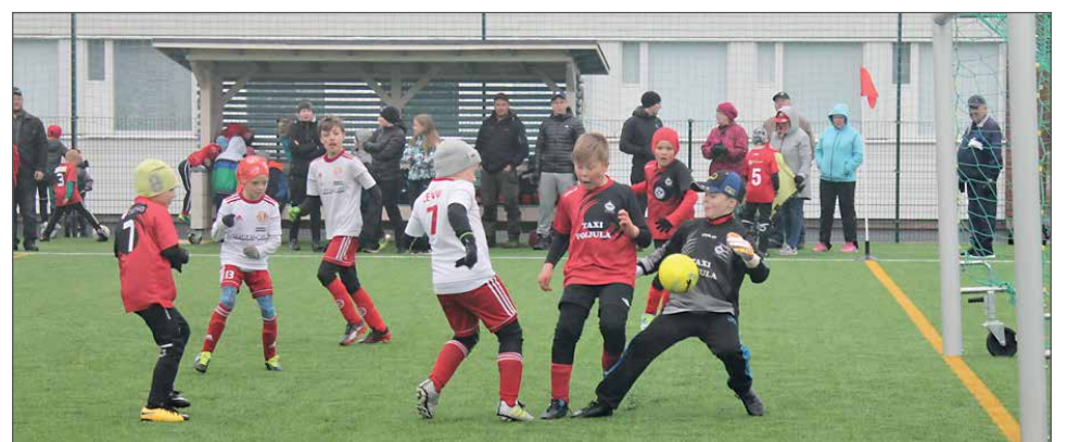
Kurenpoikien P9 pelaajia on ikäluokassa niin runsaasti, että sarjaan on ilmoitettu kaksi joukkuetta.

listaisi vieläkin suurempien turnausten järjestämisen. TN