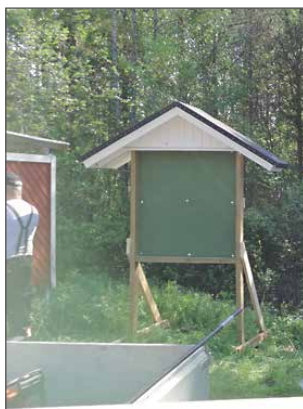
Taulu odottamassa kovaa käyttöä Ikosenniemiellä Konttilantien risteyksessä.