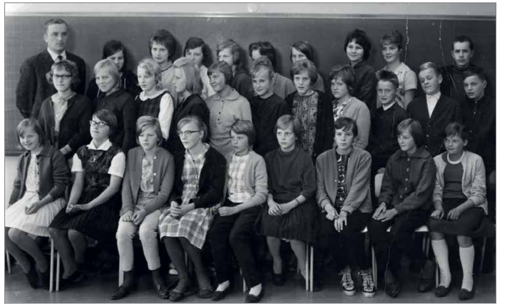
Sorriin koululaiset luokkakuussa vuonna 1962.

Pudasjärven lukio oli aloittanut toimintansa v. 1960 ja toimi tuolla nimellä vuoteen 1962. Pudasjärven yhteiskoulu perustettiin 1962 ja tällä nimellä toiminta jatkui kevätlukukauden 1969 loppuun saakka. Yhteiskoulu sisälsi sekä keskikoulun että lukion. Me sorrinkoululaiset siirryimme syksyllä 1962 toimintansa aloittaneeseen Pudasjärven yhteiskouluun ja kannatusyhdistyksen ylläpitämä privatistiryhmä jäi historiaan. En muista pitkö pyrkiä 2.luokalle, vai miten siirto tapahtui.