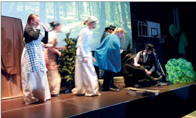
Kardinaalin kätyrit yrittävät anastaa kaulanauhan muskettisotureilta, jotka ovat hakeneet sen takaisin Englannista.

sia. Kurssilaiset kertovat oppineensa itsestään, saaneensa rohkeutta sekä nauttineensa yhdessä tekemisen tuomasta hyvästä mielestä. ER