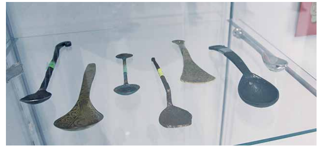
Historiallisista lusikoista löytyy myös harvinaisuus, joka on ajalta 100 v ennen ajanlaskumme alkua.

Suomi-Venäjä-Seuran Pudasjärven osaston jäsen