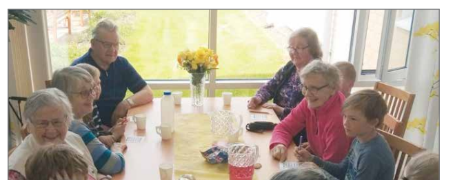
Senioreiden luona vierailtiin Kaupunginkartanossa sekä Pappilantien kerhuhuoneessa.