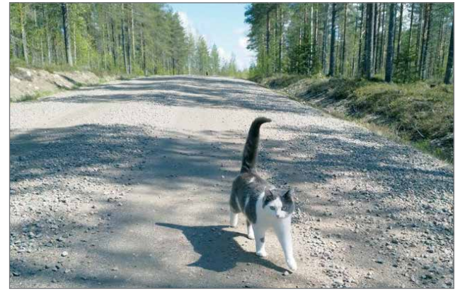
Pai-kissa on tehnyt havainnon roskista.