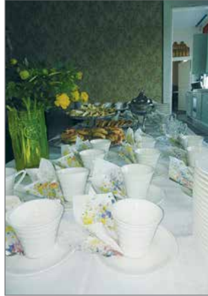
Kahvipöydässä oli esillä kevään ensimmäiset Kullerot.