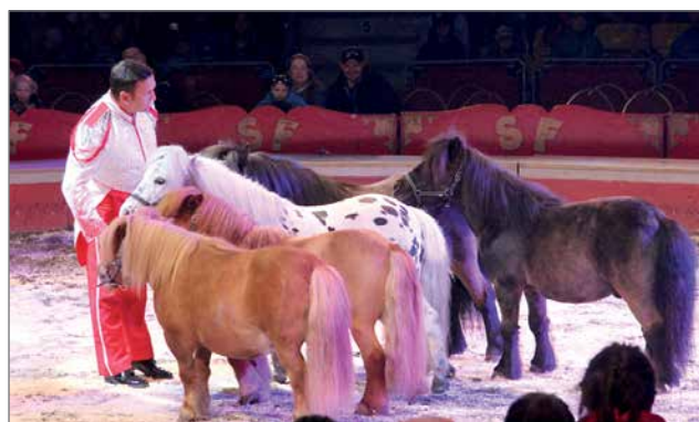
Pienet sirkusponit olivat estehyppyineen ja temppuineen yksi pääesiintyjistä.