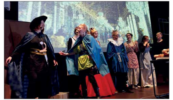
Kuningatar saa kaulanauhansa takaisin, ja hänen maineensa säilyy. Lopussa juhlitaan.