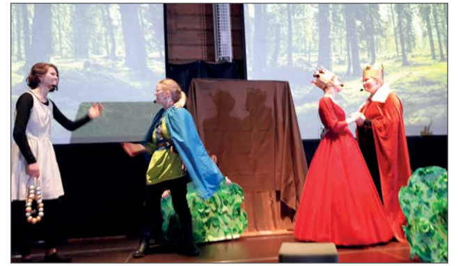
Ranskan kuningatar antaa Englannin kuninkaalle arvokkaan kaulanauhan muistoksi heidän kielletystä rakkaudestaan.