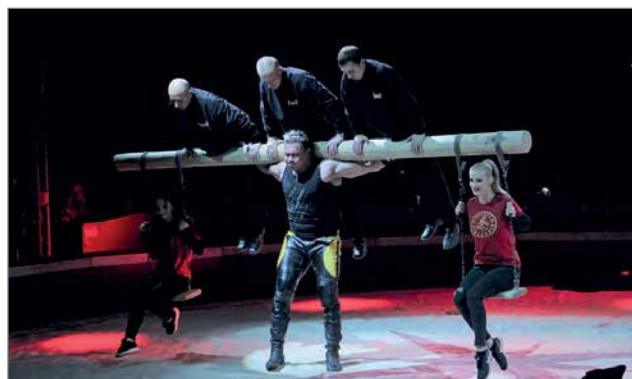
Voimamies häkellytti Yleisöä vetämällä suullaan isoa autoa sekä monilla muilla voimatempuilla