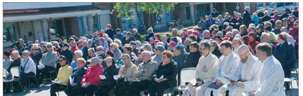
Kaiken kansan Torimessuun helatorstaina osallistui runsaasti väkeä.