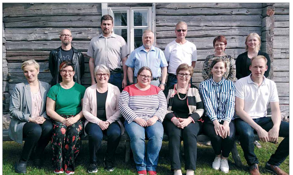
Uusi hallitus Turkansaaren kesäisissä maisemissa.

tusta myönnetään Oulun Seudun Leaderin toiminta-alueen 13-25 vuotiaiden nuorten yrityskokeiluihin