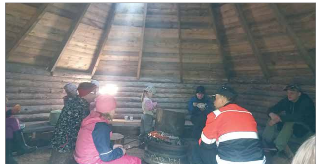
Makkaran paistoa Riepulan kodalla.