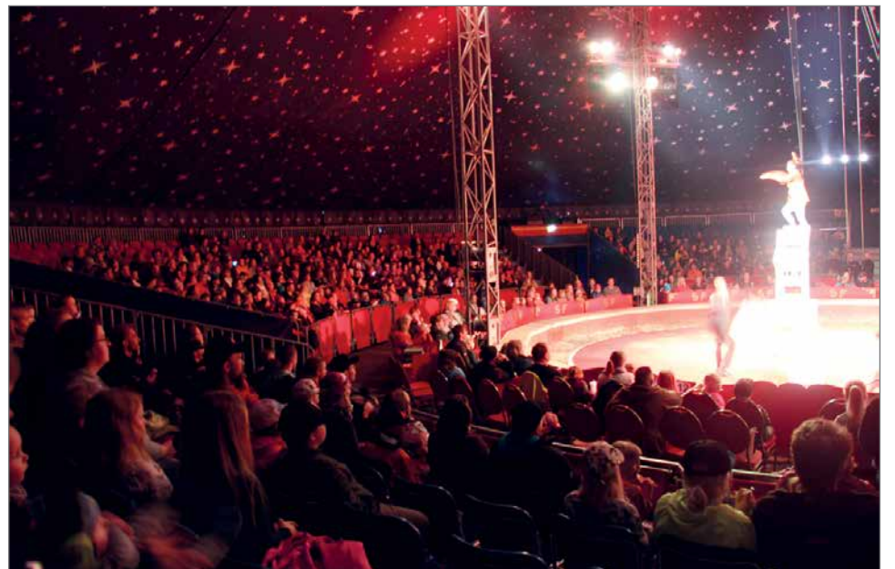
Tunnelmallinen 1200 hengen sirkusteltta oli lähes täynnä yleisöä ja pellet takasivat koko-aikaisen viihtymisen.