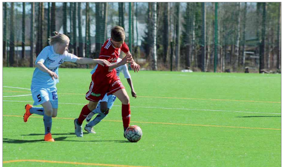
Sarja-avaus 10.5. Suojalinnan kentällä, josta otettiin oppia tuleviin peleihin.