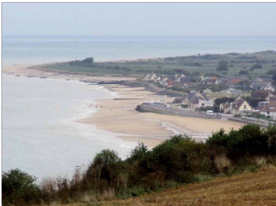
Normandian rannikkoa Arromanchesissa.