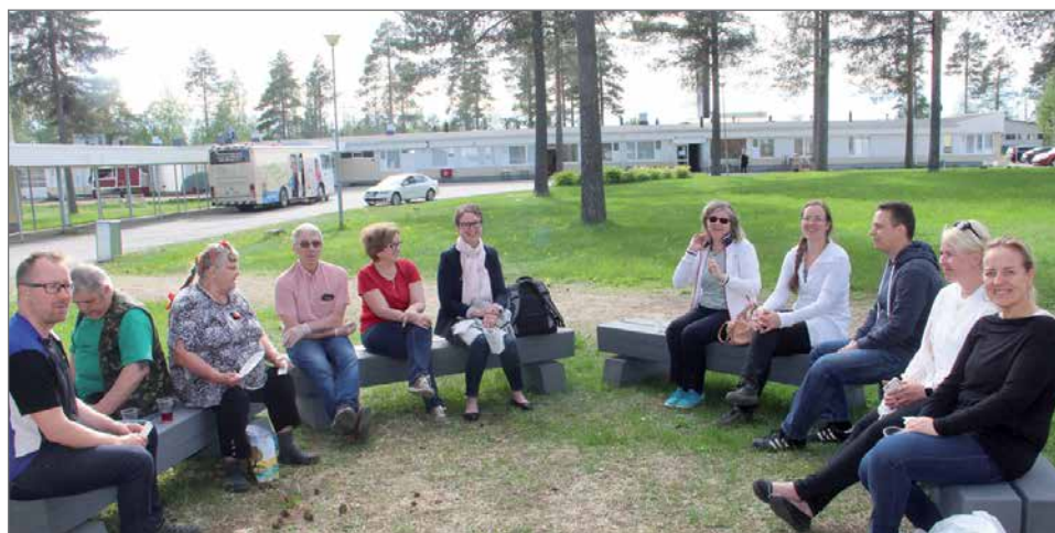
Illalla vielä istahdettiin Unelmatehtaan laavulle kyläporinoitten merkeissä.