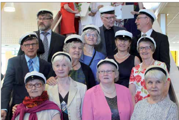
12 riemu ylioppilasta yhteisessä kuvassa.