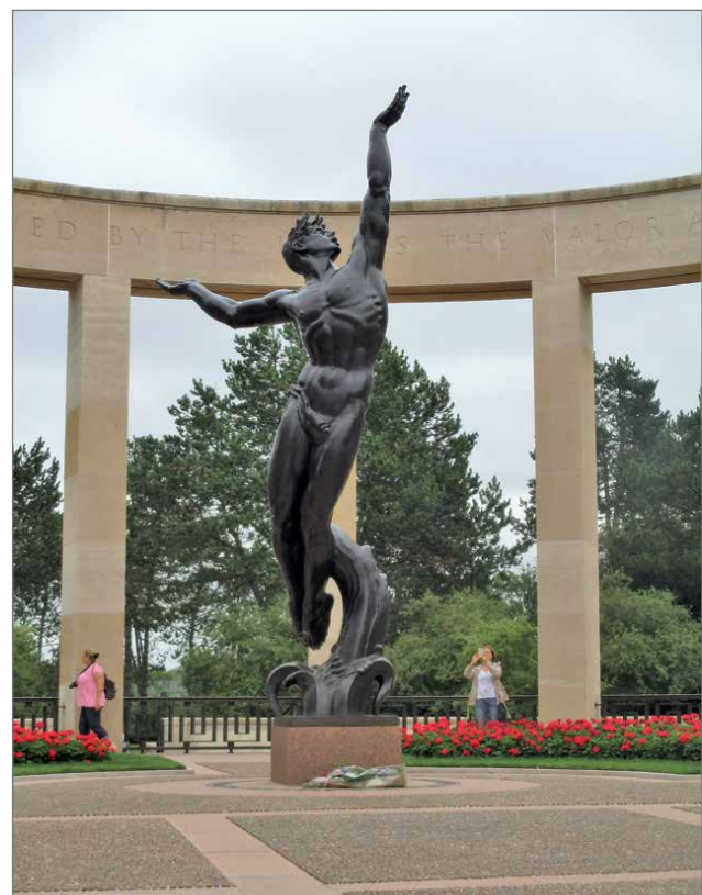
Amerikan nuorison henki nousee aalloista.

Tämä kirjoitukseni aloittaa muutaman kohdemat-kailujutun sarjan Jotta emme unohtaisi . Sotahistoriaa har-