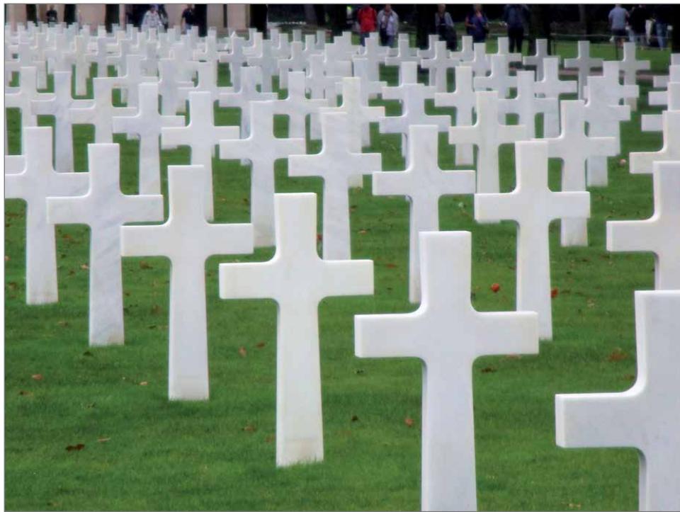
Valkoisten marmoriristien hiljaista armeijaa.

Valkoisia ristirivejä jatkuu miltei loputtomiin. Välissä pilkottaa jokunen daavidintähti. Hiljaisuudessa, jonka rikkoo vain Atlantin aaltojen vaimea kohina, täytyy yrittää eläytyä siihen melskeeseen, joka näillä rannoilla alkoi 6. kesäkuuta 1944.