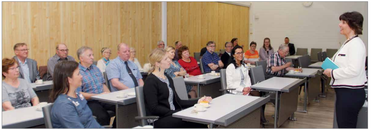
Ministeri Anne Berner kertoi olleensa vaikuttanut Hirsikampuksella ja siellä myös eri luokissa vierailusta. Hän vakuutti myös, että Suomen tiestön korjausvelkaa on otettu kiinni, vaikka vielä on paljon tehtävissä.

Virallisesti kaupunki esitti, että Liikenne- ja viestintäministeriö osoittaisi syksyn talousarviossa vuodelle 2019 erillismäärärahan Pudasjärven kaupungin uuden taajamaliittymän rakentamishankkeen VT 20:n ELY:n tealueen liikenneympyräinvestointiin. Määrärahatarve on noin 1,8 miljoonaa euroa. Uusi taajamaliittymä sisäntuloväyli-