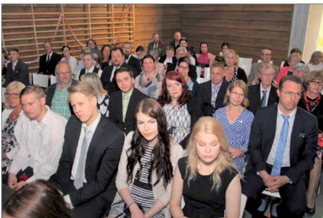
Juhlaan osallistui salin täydeltä lukion väkeä sekä ylioppilaiden perheenjäseniä ja läheisiä.