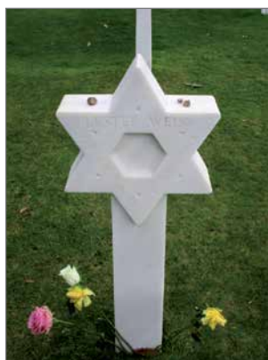
Maihinnousussa kaatui myös juutalaisia. Daavidintähti muistokivineen.

maita ja karheasti veistettyjä kiviristejä olemme nähneet Narvikissa. Kappelissa on haalistuneita kuvia saksalaisten muistomerkeistä Euroopassa, myös Norvajärven mausoleumista.