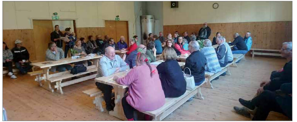
Hyvänä esimerkkinä kylätapahtumien merkityksestä voidaan mainita Kyläneuvoston tuorein kokoontuminen tiistaina 5.6. Siuruan työväentalolla.

Pudasjärvellä hieman yli puolet väestöstä asuu taajamassa, kun vielä vuonna 2014 enemmistö keskittyi kylille. Kurenalan ympärillä on yhteensä neljätoista laajempaa kylää ja ne jakaantuvat vielä pienempiin osa-alueisiin. Pitkien etäisyyksien kaupungissa mahdollisuus kokoontua omalla kylällä on arvossa arvaamattomassa. Vapaa-