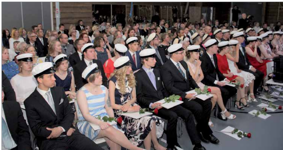
Hirsikampuksen juhlasali täyttyi jo toisena keväänä ylioppilasta ja juhlayleisöstä.

Pudasjärven lukion ylioppilajuhla oli lauantaina 2.6. toista kertaa Hirsikampuksen juhlasalissa. Pudasjärven lukiossa sai valkolakin 25 uutta ylioppilasta.