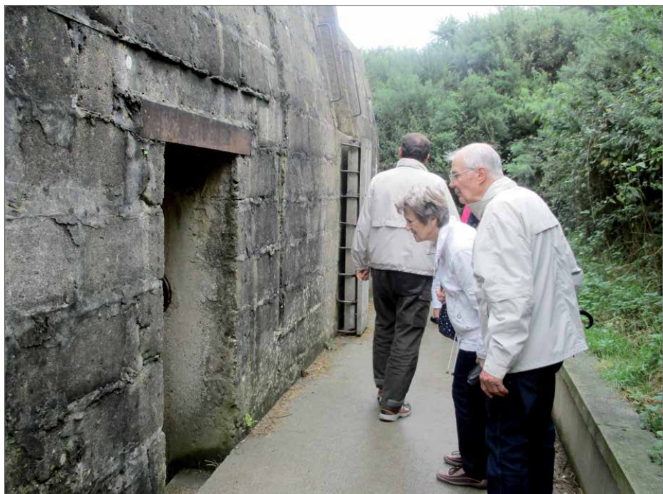
Uskaltaako bunkkeriin sisään?