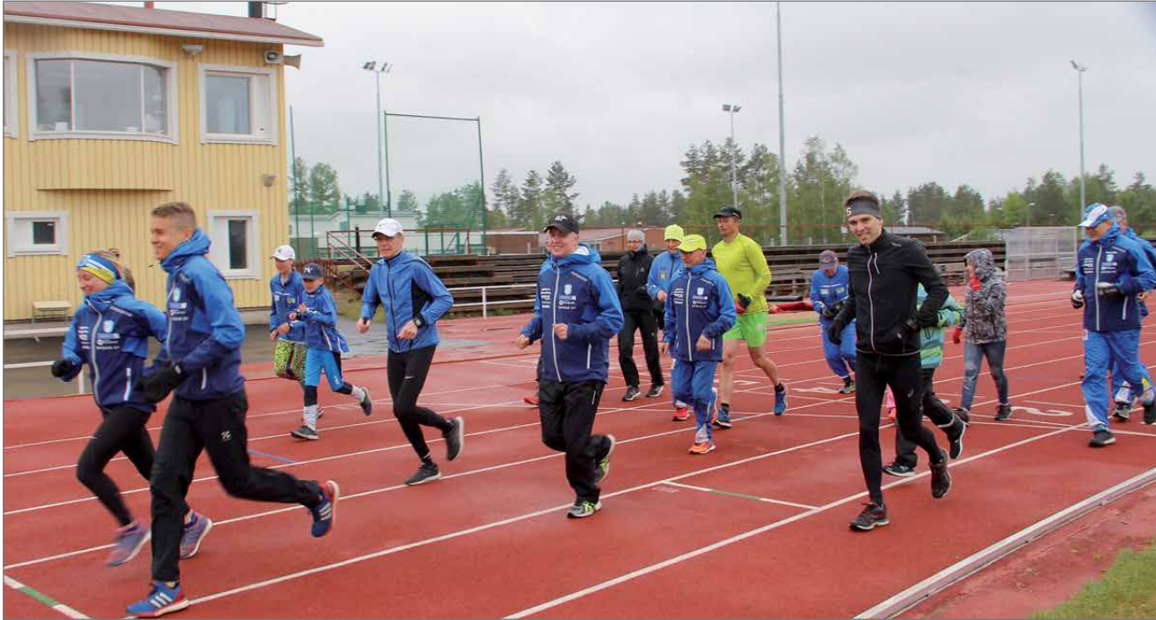
Kesän kylmin ja sateisin sää sattui kunniakierrostahtumaan, mutta osallistujia oli silti mukavasti.