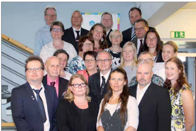
Koulun henkilökunta kokoontui juhlan loppuun yhteiseen kuvaan.