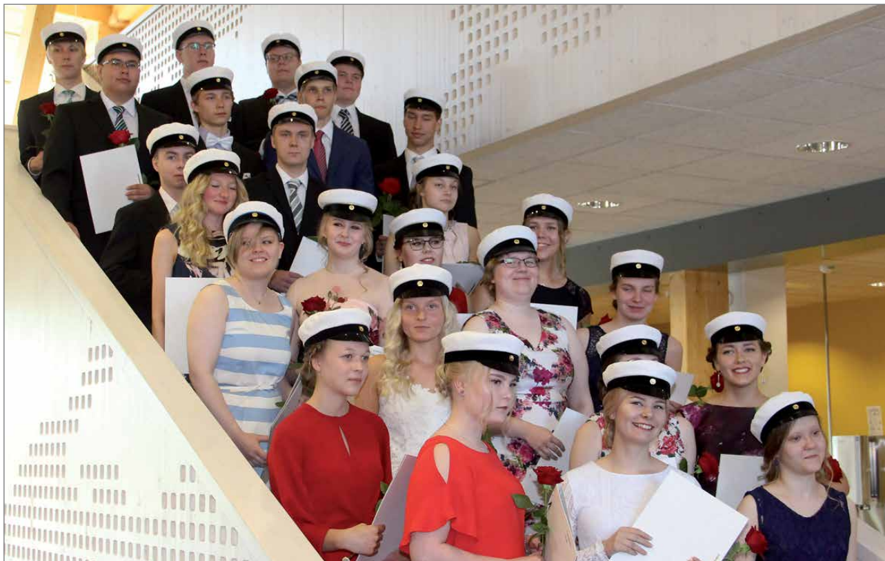
Vuoden 2018 ylioppilaita yhteisessä kuvassa Hirsikampuksen yläkerran portailla.