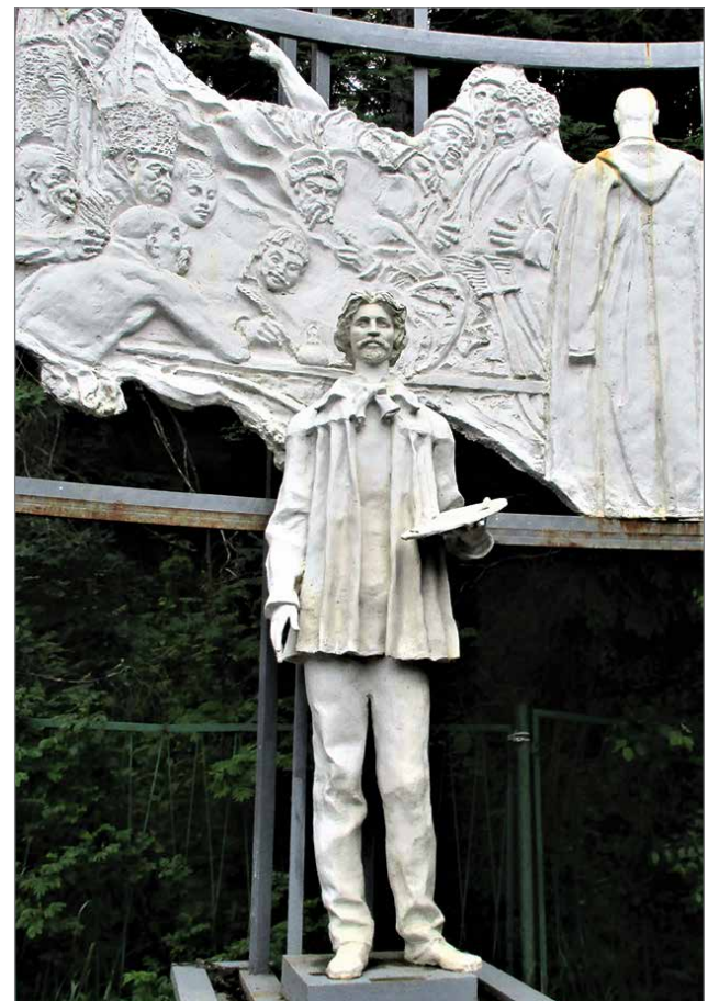
Reliefi Penatyssä esittää Repiniä maalamaan kasakoita, jotka kirjoittavat pilkkakirjettä Turkin sulttaanille.