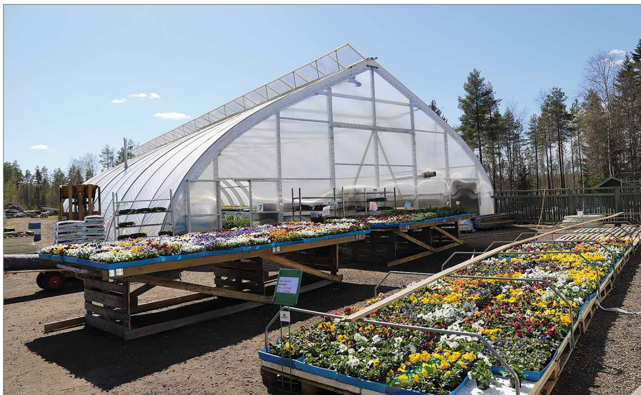
Puutarhalla on tilaa useita tuhansia neliötä seitsemässä eri kasvihuoneessa. Lisäksi asiakkaat pääsevät liikkumaan koko puutarha-alueella ja valitsemaan muun muassa perennoja, pensaita ja puita.