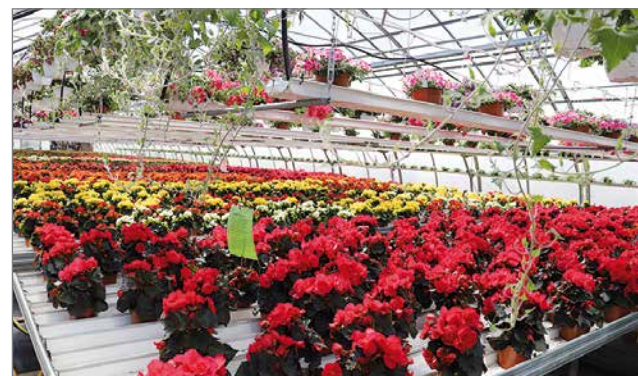
Ruusupegonioita löytyy runsaasti eri väreissä.