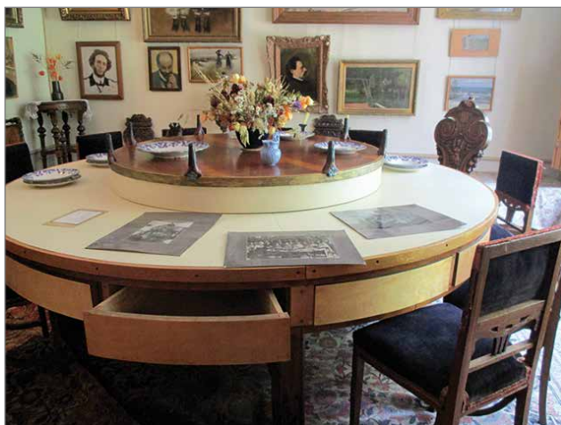
Ruokasalin pyöreässä pöydässä voi harrastaa itsepalvelua.