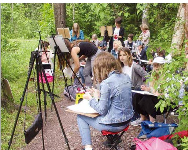
Nuoria taiteilijoita Penatyn puistossa.