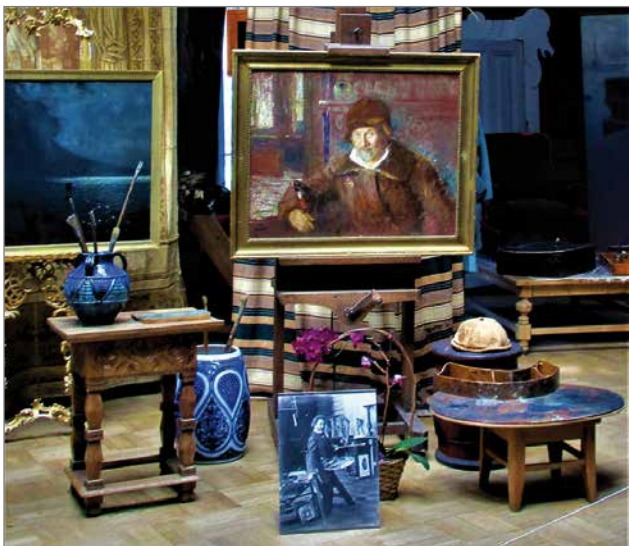
Repinin viimeinen omakuva vuodelta 1920. Kylmässä ateljeessa taiteilija joutui käyttämään ulkovaatteita.

Kirjoittaja on pudasjärveläislähtöinen tietokirjailija. Hän asuu nykyisin Rovaniemellä ja harrastaa matkailua.