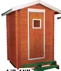
LilleVilla Toilet 8 PUUCEE 1,20x1,4 m