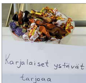
Tapahtumaan ja 15-vuotisjuhlaan saapuneet vieraat olivat tuoneet tulsia, jotka olivat kaikkien nautittavana.