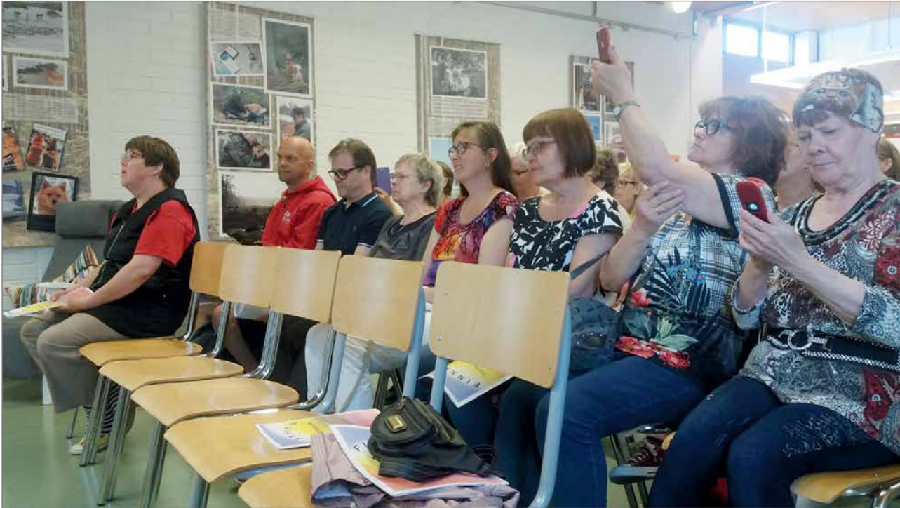
Yleisöä oli kuulolla yli 20 henkilöä.