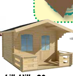
LilleVilla 20 PIHA- AITTA 16,8 m 2