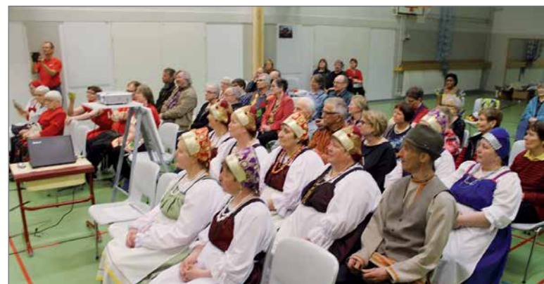
Noin neljä tuntia kestävä Vappujuhlatapahtumapäivän päätteeksi oli Kesseli ry:n 15-vuotisjuhla.