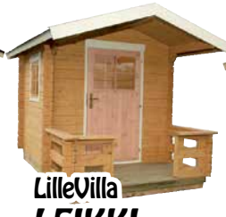
LilleVilla LEIKKI- MÖKKI/ VIERAS- MAJA