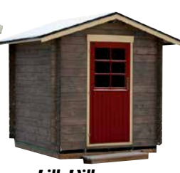
LilleVilla Kuopio VARASTO 2,0x2,0 m