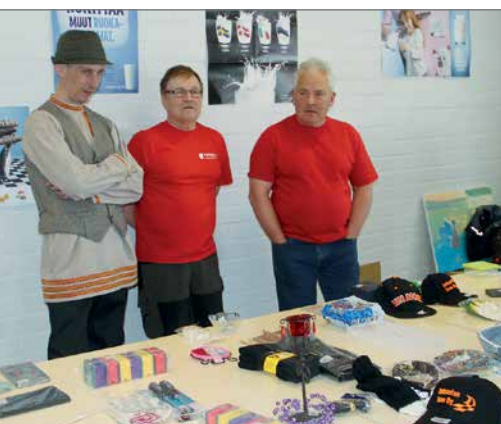
Arpajaisissa jokaisella arvalla sai jonkin voiton.