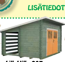
LilleVilla 207 VARASTO- LIITERI 16 m 2