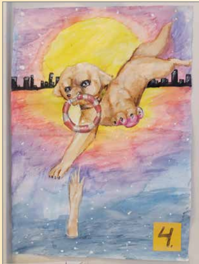
Tässä piirustuksessa on hyvä sana. Apu voi tulla yllättävältäkin taholta. Tämä piirustus palkittiin Wauvasta Waariin Wapputapahtumassa 300 euron luokkarekistipendillä. Onnea koko luokalle!

Konsertin järjestää Pudasjärven kansalaisopisto. RK