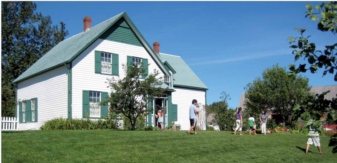
Anna-kirjojen Vihervaaran esikuva on nykyisin museona.