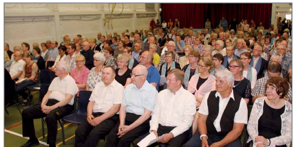
Muistokonsertti kokosi salin täyteen yleisön.