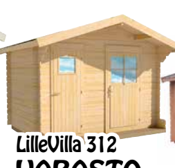
LilleVilla 312 VARASTO- PUUCEE YHDIS- TELMÄ