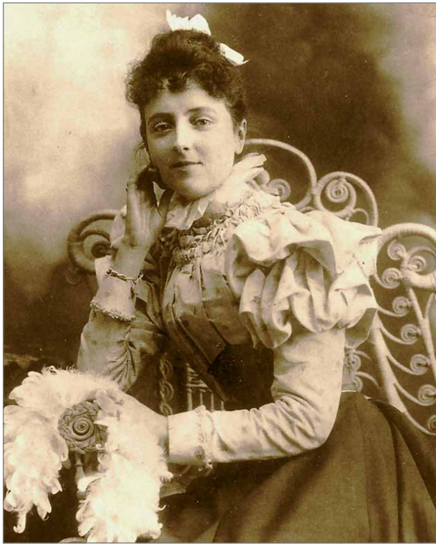
L.M. Montgomery (1874-1942).

Cavendishiin rakennet- tu Avonlea Village tarjoaa Montgomery-faneille mo- nia aktiviteetteja. Siellä voi ajaa Matthewin kieseillä sekä tavata Annan, Dianan