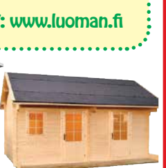
LilleVilla 94 PIHAITTA 15,3 m 2