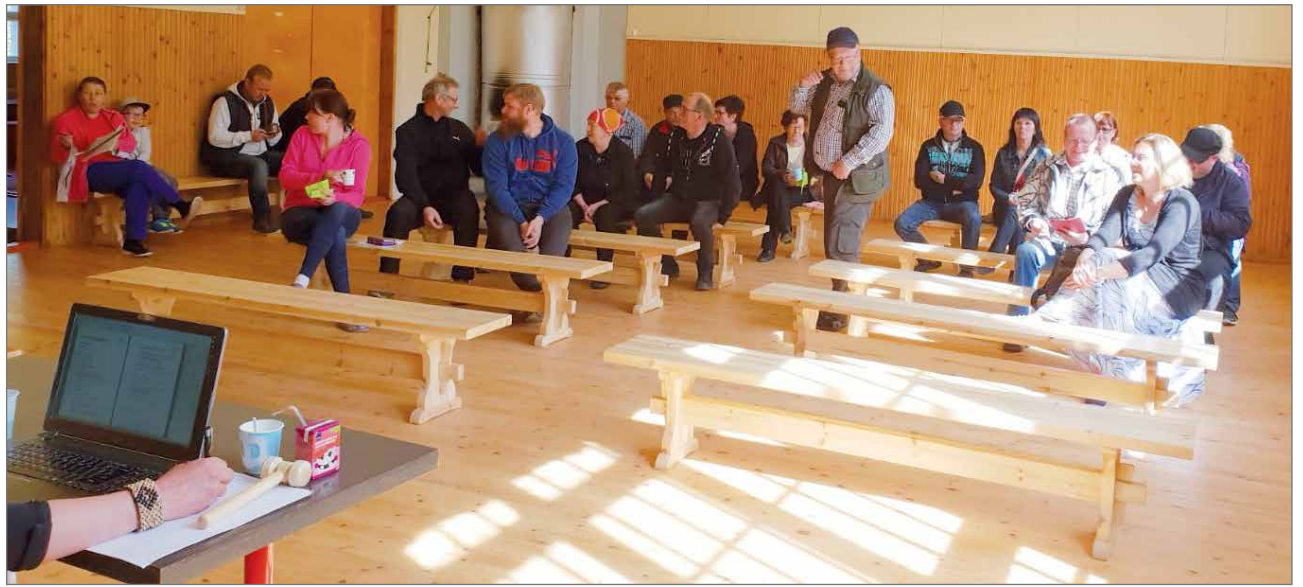
Siuruan Kylä ry kattaa koko Siuruan kylän alueen ja parantaa yhteistyötä kylän alueella.