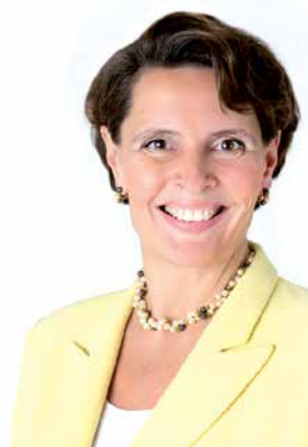
Ministeri Anne Berner vierailee Pudasjärvellä ensi viikon maanantaina.