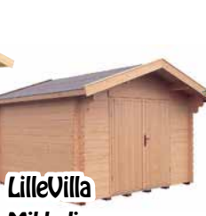
LilleVilla Mikkeli PARIU- VARASTO 9 m 2