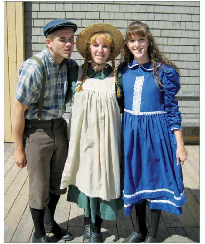
Montgomery-fantasiaa: punatukkainen Anna Gilbertin ja Dianan kanssa Avonlea Villagessa.

nettuja taloja, on kauppa, kirkko ja koulu. Viimek- si mainittu on siirretty Bel-