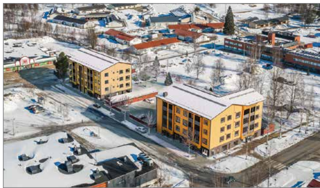
Kerrostalojen ulkoseinät tehdään pudasjärveläisen Kontiotuotteen painumattomasta hirrestä.

Pudasjärven keskustaan nousevat kerrostalot rakennetaan hybridirakenteella, jossa talon runko tehdään betonielementeistä ja ulko-