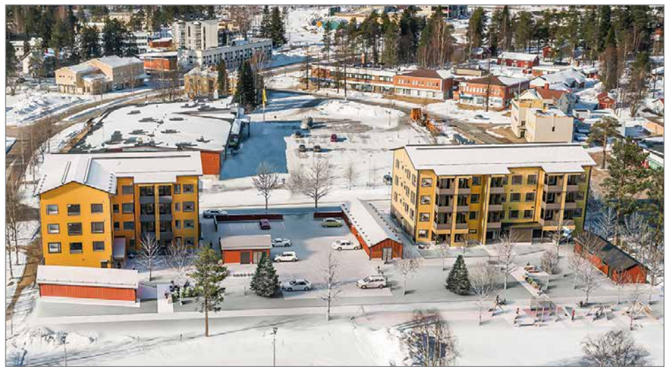
Rakennusliike Lapti rakentaa Pudasjärven keskustaan kaksi nelikerroksista hirsikerrostaloa. Havainnekuva Linja Arkkitehdit Oy.

Pudasjärven Hirsihoviksi nimettyjen talojen ensimmäiseen kerrokseen tulee liiketiloja tuleville ja nykyisille yrittäjille. Asunnoista suuri osa on yksioita ja kaksioita. Talosta löytyy myös kolmioita ja neliöitä. Pudas-