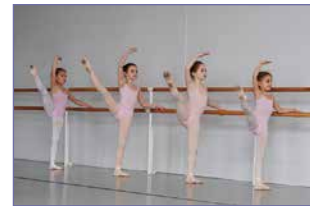
Pienimpien balettiryhmissä opitaan jo varhaisessa vaiheessa kehonhallintaa.

Baletti raivaa tietä muille harrastuksille!