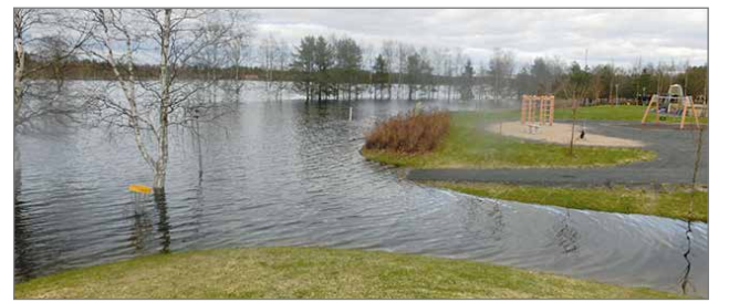
Tulvakuva Rajamaanrannasta vuonna 2015. Nyt ennustetaan myös lijoen tulvivan tavallista enemmän.