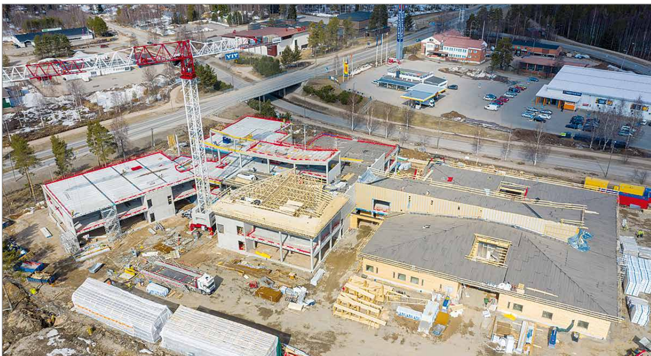
Hyvän Olon Keskuksen työmaa etenee pääosin aikataulun mukaisesti.