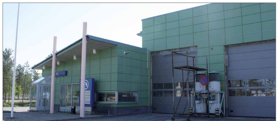
Hallin on saatu uudet nosto-ovet ja nyt sisälle voi ajaa isommankin auton. Hallin toisessa päässä toimii Ajovarma.