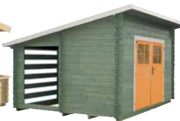
LilleVilla 207 VARASTO- LIITERI 16 m 2