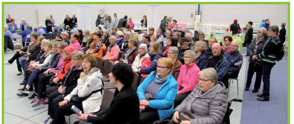
Messuyleisö sai kuunnella välillä esityksiä lavalta ja tutustua myyjien esittelypisteisiin.