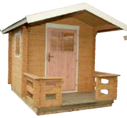
LilleVilla LEIKKI- MÖKKI/ VIERAS- MAJA