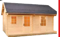
LilleVilla 94 PARIAITTA 15,3 m 2