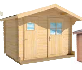
LilleVilla 312 VARASTO- PUUCEE YHDIS- TELMÄ