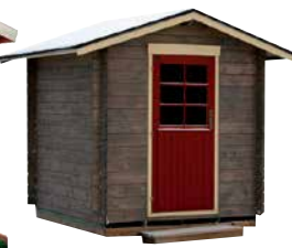
LilleVilla Kuopio VARASTO 2,0x2,0 m