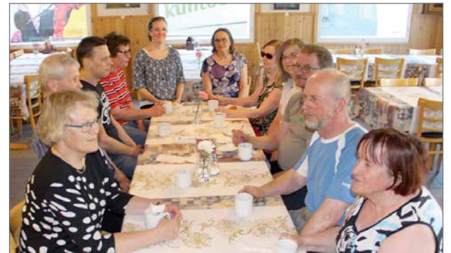
Niemitalon Tauon paikassa nautittiin tapahtuman välillä leipäjuustokahvit ja tämäkin hetki keskenään porinoiden.