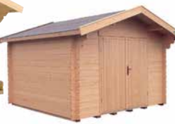
LilleVilla Mikkeli PARIUVI- VARASTO 9 m 2