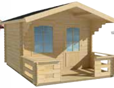
LilleVilla 20 PIHA- AITTA 16,8 m 2