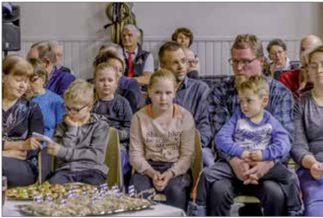
Suomi 100v-juhla on juuri alkamassa ja osa lapsista joutii istumaan isän syliin.