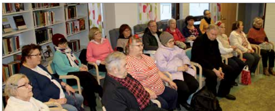
Runo- ja kuvakirjan julistamiseen oli tullut mukavasti asiasta kiinnostunutta väkeä.

Kirjaa voi hankkia Tuohimaaalta p. 040 938 3341 ja Kujalalta p. 045 158 5404 tai sen voi tilata 25 euron hintaan suoraan kustantajalta mediapinta.fi.