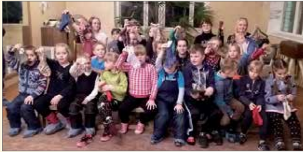
Borovoin lapset lauloivat innokkaasti. Paras ryhmä!

Joululaulutilaisuuksia kertyi yhteensä 49 viidessätoista päivässä. Ajokilometrejä tuli tarkalleen 2900 km. Suuri kiitos kaikille lahjoittajille, jotka halusivat antaa joulumieltä Vienan Karjalan lapsil-