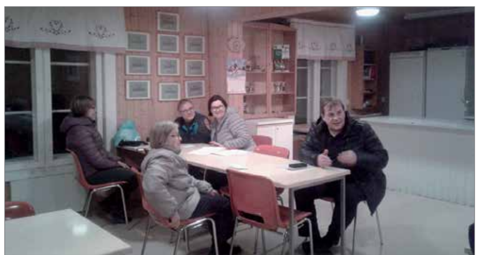
Syyskokous pidettiin Koskenhovilla, jonka remontointia jatketaan ensi keväänä maalamalla talo ulkoapain.

lapsille pidetään kansantanssikerhoja ja kesäleirejä mahdollisuuksien mukaan yhdessä Nuorisotoimen kanssa. Tarpeen mukaan pidetään talkoita Koskenhovilla. Koskenhovin remontointia jatketaan viime syksynä toteutetun lattiaremontin jälkeen. Nyt on vuorossa talon ulkomaalaus tulevan kevään aikana. Osallistutaan kansantanssien katselmuksiin sekä järjestetään huhtikuussa Supikas - kansantanssikatselemus liikuntahallilla yhteistyössä Pohjois-Pohjanmaan nuorisoseurojen liiton kanssa. HT