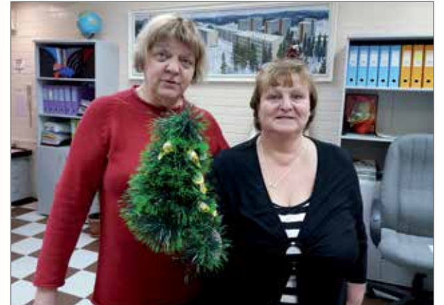
Kostamuksen koulun nro 1:n opettajat lähettivät hyvät terveiset lehden lukijoille!