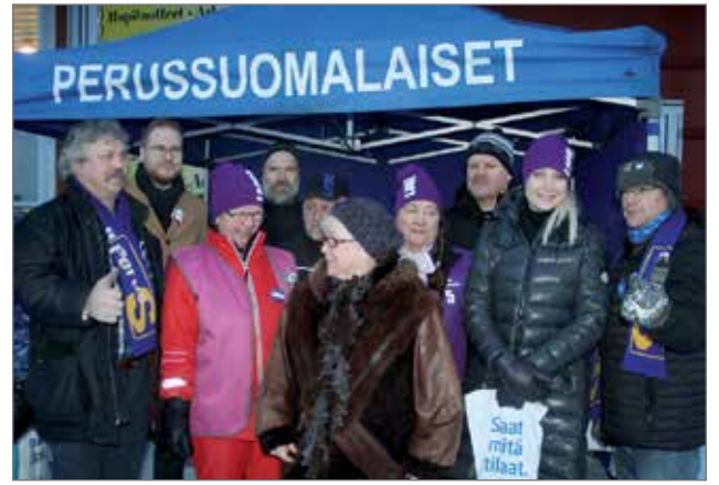
Paikalliset Perussuomalaiset kokoontuivat yhteiskuvaan pidetyn presidenttiehdokkaan kanssa.

Hän vielä totesi, että tärkeintä on suomalaisten turvallisuus ja hyvinvointi - se, että meidän, lastemme ja lastemme lasten kelpaa täällä elää vielä tulevaisuudessa. HT