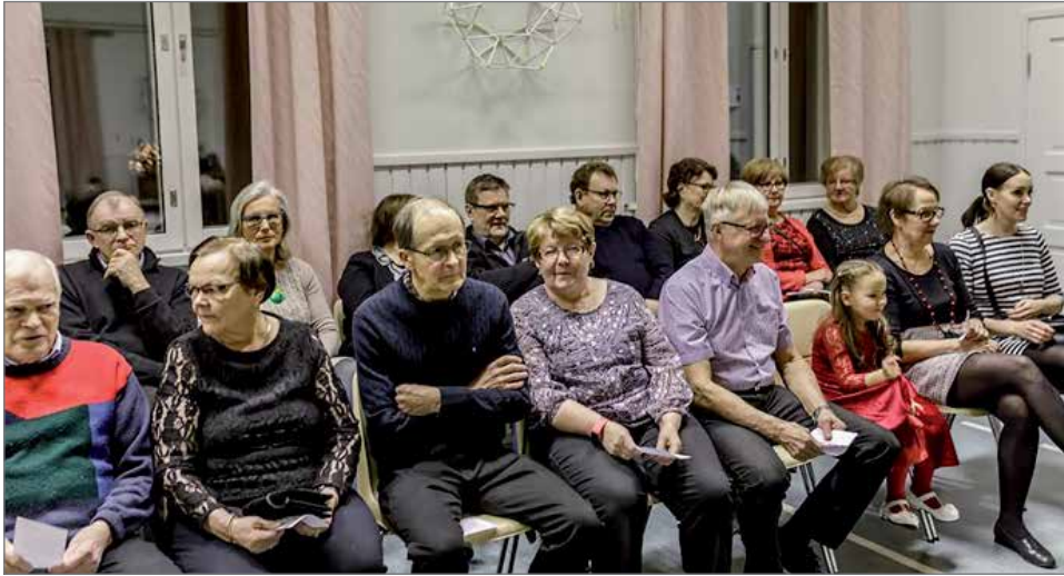
Suomi 100v-juhla on juuri alkamassa ja vähän vielä mietityttää, että mitähän seuraavaksi tapahtuu?