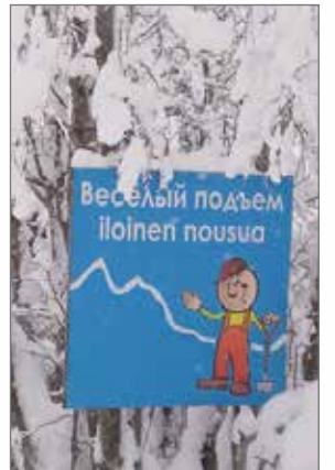
Huumori auttaa huonoissa paikoissa Karjalan teillä.