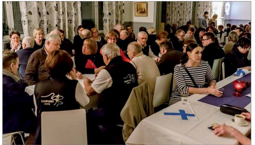
Päivällinen oli runsas ja maukas. Pöydät oli katettu sinivalkoisin väreihin.