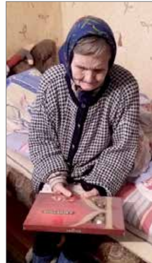
Outi itkien sanoi: - Kiitos, kun te vielä minua muistatte.