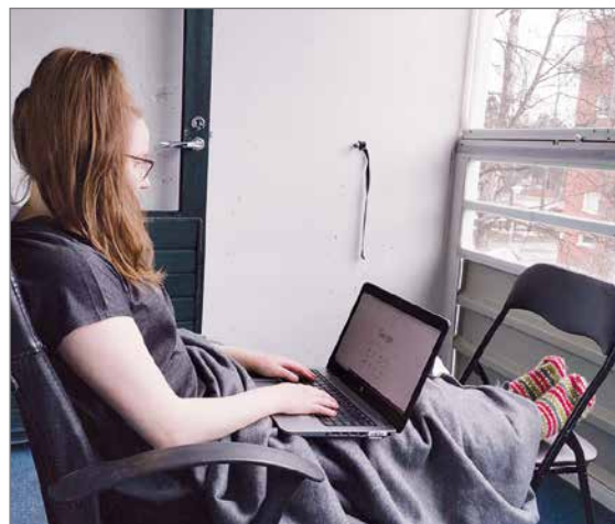
Etäpäiviin saa vaihtelua opiskelemalla eri paikoissa.