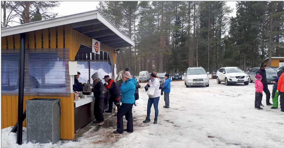
Ulkogrillistä myytiin lettukahveja ja tarjottiin grillimakkaraa.

Sää suosi pääsiäisenä ulkona liikkujia, ja auringonpaisteesta olikin paikalle tullut nauttimaan noin 200 ihmistä. Tämä on Puhoskylän pääsiäistapahtuman kävijäennätys, ja alueen mökkiläisiä yritetään jatkossa kannustaa vielä entistä enemmän osallistumaan kyläseuran toimintaan ja tapahtumiin. Lisäksi lauantai-iltana järjestettiin karaoke ilta kyläläisille, ja pitkänä perjantaina oli tanssit. Toimintaa oli siis runsaasti tarjolla pää-