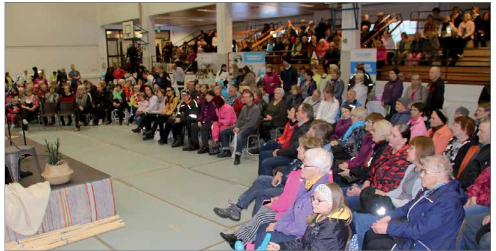
Monipuolista ohjelmaa oli seuraamassa runsas yleisö.