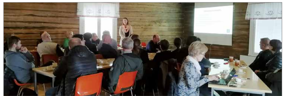
Aktiivinen joukko eri yhdistysten edustajia kokoontui Koskenhoville tapahtumatyöryhmän ensimmäiseen tapaamiseen.