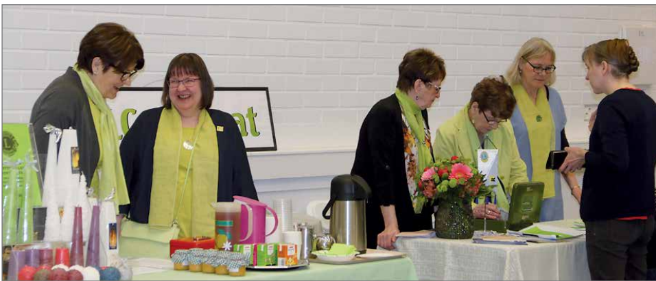
Hilimat myivät omaa tekemää sinappia, arpoja ja kahvia messutilassa. Erikseen heillä oli vielä kahvio, jossa oli tarjolla Lapin ukon juhlakeittoa ja kahvia leivonnaisten kera.