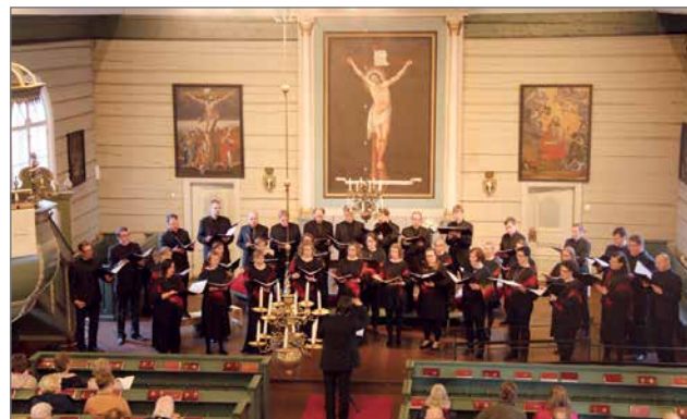
Suomen Kanttorikuoro esiintymässä Pudasjärven kirkossa.

Pudasjärven kirkkoon oli tullut kahdella bussilla vieraita Kuusamosta ja Puolanganalta. Suurin joukko kon-