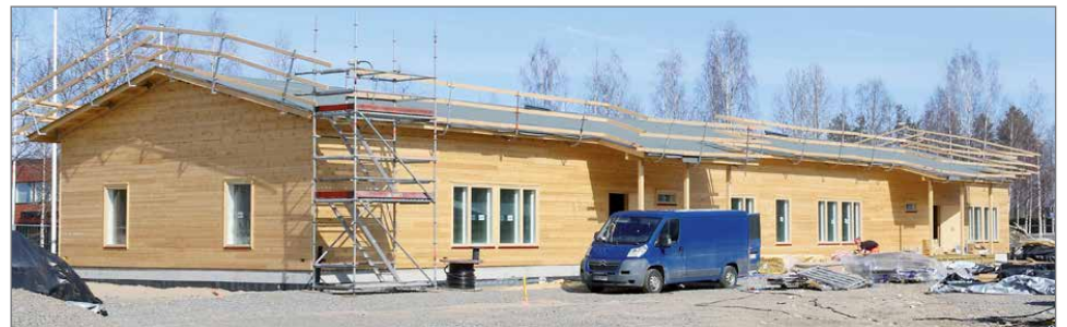
Touhula Pudasjärven hirsinen rakennus on hyvää vauhtia valmistumassa kaupungintaloa vastapäätä ns. Hartsun tontille.