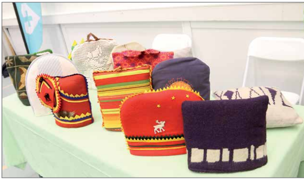
Pannumyssyt olivat kerätty Hilimojen kodeista. Aikanaan ne pitivät pitkään kahvin lämpimänä.