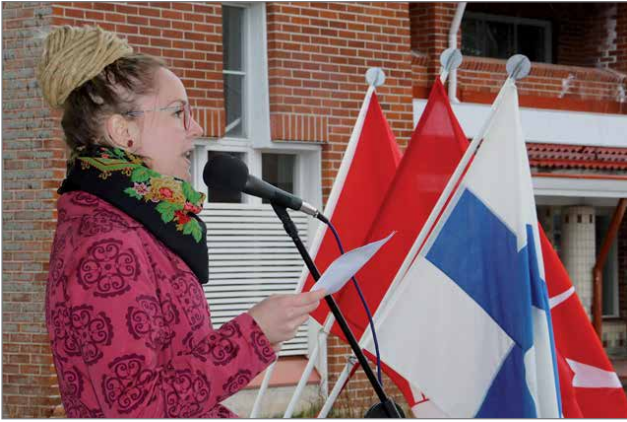
Kansanedustaja Hanna Sarkkinen oli vierailut vappupuhujana ennen Pudasjärveä jo Muhoksella ja Oulussa.

Vasemmistopuolueiden sekä SAK:n Pudasjärven paikallisjärjestön yhteisesti järjestämää Vappujuhlaa vietettiin torilla vappuna 1.5. Ilmassa oli takatalven tuntua kylmän tuulen ja räntäsateen muodossa lämpimän jakson jälkeen.