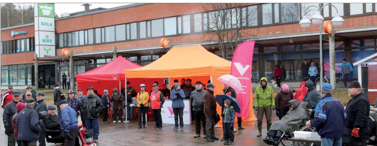
Vappupuhetta kuunneltiin koleassa säässä ja suuri osa yleisöstä etsiytyi Osuuspankin kiinteistön seinän vierelle suojaan tuulelta ja sateelta.