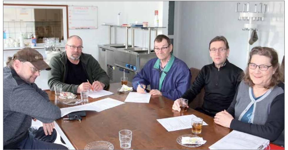
Kevätkokousväkeä Työpetarin pirttikahviossa.

Kuntouttavaa työtoimintaa on jatkettu Rimmin koulun tiloissa. Yhdistyksen toiminnanjohtaja on vastannut toiminnan toteuttamisesta. Kuukausittain toiminnassa mukana on ollut 4-7 henkilöä. Yhteensä koko vuonna miestyöpäiviä on tullut 345 ja mukana on ollut 13 eri henkilöä. Yhdistyksen puolelta ohjaustehtävissä on ollut kolme henkilöä. Yhdistys on työllistänyt kokoaikaisesti toiminnanjohtajan ja osaaikaisesti toimistosihiteerin. Metsäryhmän vetäjä on ollut töissä seitsemän kuukautta viime vuoden aikana. Lisäksi on työllistetty työllistämistuen avulla kol-