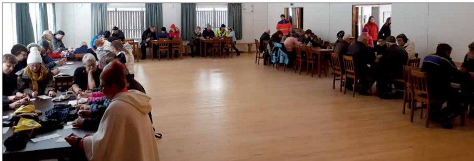
Bingossa oli niin suuri kiinnostus, että otettiin käyttöön myös juhlasali.