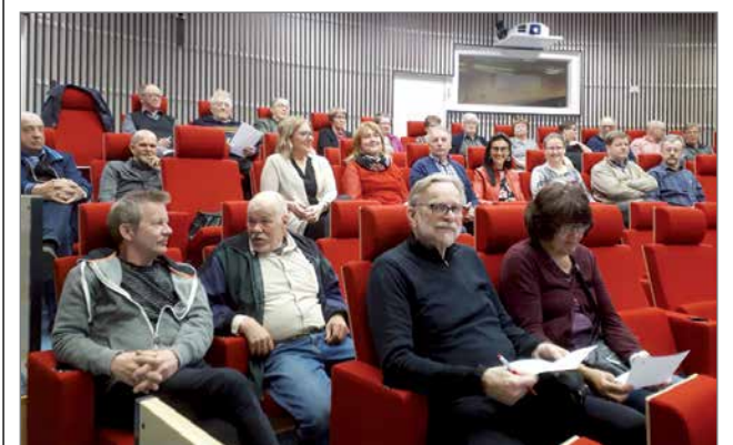
Keskustan ylimääräinen yleinen kokous kokoontui Pohjantähdessä elokuvateatterissa.

Kaupunginvaltuuston kokous on torstaina 9.5. Kokouksessa esillä olleet henkilövalinnat päätetään siellä, joten niiden uutisointi tapahtuu ensi viikon Pudasjärvi-lehdessä. Samalla tulee julki myös valtuuston pienryhmien henkilövalinnat.