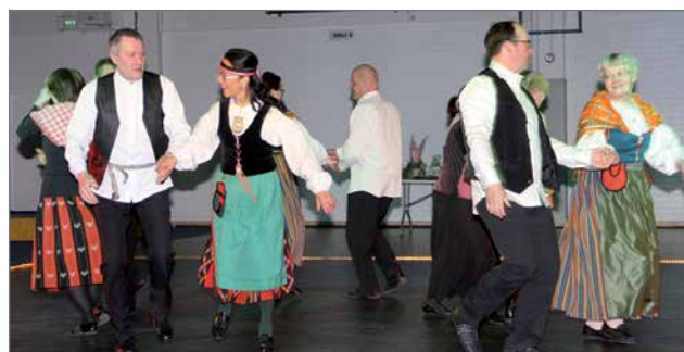
Iijoen tanssijoiden "Hyssyn myssyn".