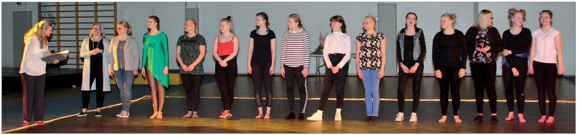
Esityksen loppupuolella voimistelujoukoston vastuunkantajat yhteiskuvassa.