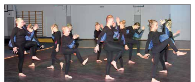
Gymnaestrada voimistelukoulu kenttäohjelma "Salainen labryntti". Esitys on ensi kesänä Turussa.