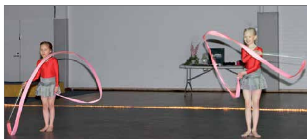
Välinevoimistelu "Kohti kesää".