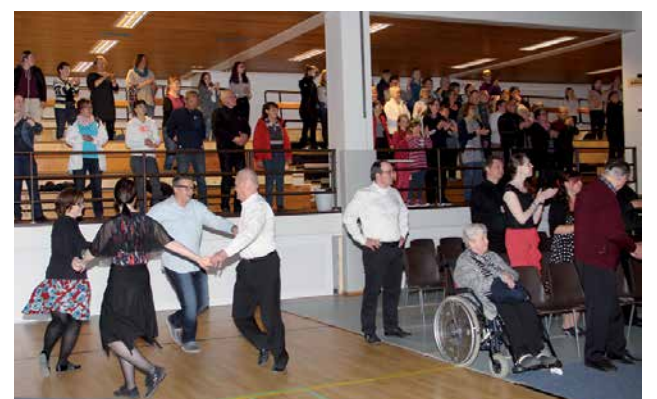
Yleisö osallistui Gymnaestrada Turku 2018 yhteistanssiin.