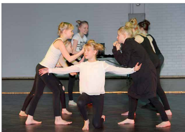
Hirsikampuksen show kerho.