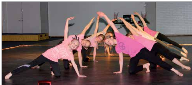
PuU 7-9 vuotiaat voimistelukoulu "ilman lupaa".