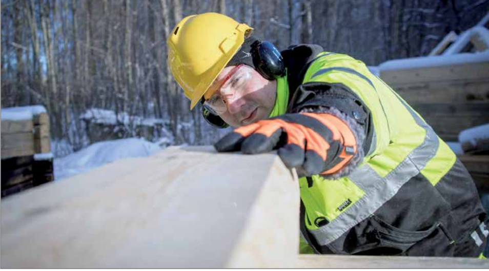
Osaon opiskelija on hirren kimpussa ja katse tulevaisuudessa.