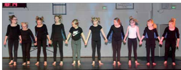
PuU 10-13 v voimistelukoulu "Airtrack temppuulua"