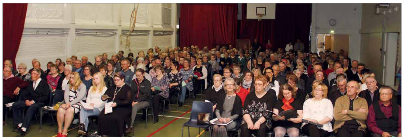
Salikki täyttyi ääriään myöten yleisöstä.