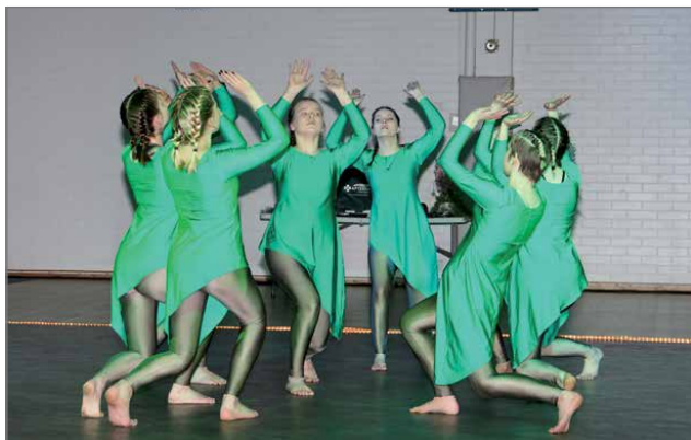
Gymnaestrada tanssillinen voimistelu kenttäohjelma "Energian ympäröimä". Esitys on ensi kesänä Turussa.