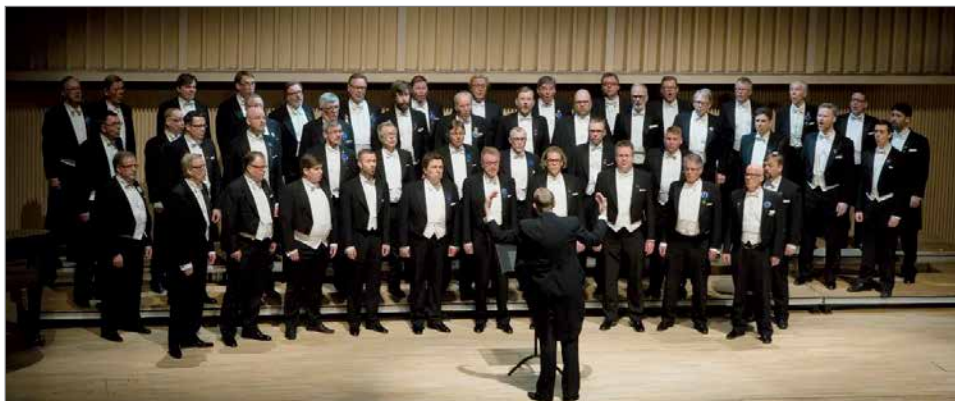
Pohjan Laulu -mieskuoro saapuu konsertoimaan Pudasjärvellä. Kuoron vahvuus on tällä hetkellä noin 60 aktiivijäsentä.

Kuoro on konsertoinut ja kilpaillut ahkerasti jo vuosikymmeniä sekä kotimaassa että ulkomailla. Lisäksi kuoro on tehnyt useita pidempiä konserttimatkoja Eurooppaan, Pohjois-Amerikkaan, Aasiaan ja Afrikkaan. Viimeimpänä syksyllä 2017 Floridaan Suomi 100 -juhlavuoden kunniaksi. Vuonna 2015 Suomen mieskuoroliiton Tampereella järjestämässä kansainvälisessä Leevi Madetoja -kuorokilpailussa Pohjan Laulu voitti kansallisen sarjan ja palkittiin myös erikoispalkinnolla parhaas-