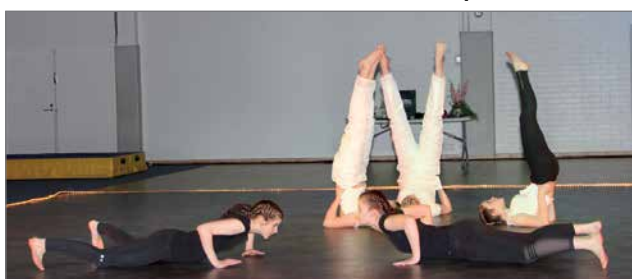
PuU nuorten tanssillinen voimistelu "Erlainenko?"