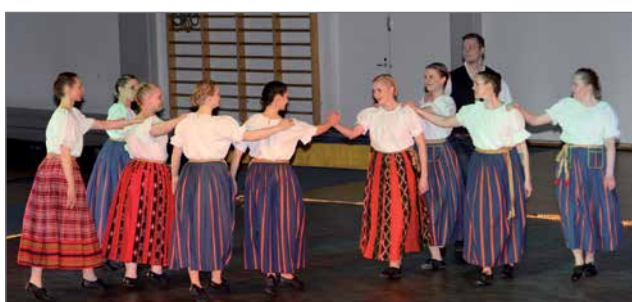
Kansantanssiryhmä Fliikat "Kaikella rakkaudella".

Pudasjärven Urheilijoiden Voimistelujoukoston toiminta on monipuolista ja aktiivista. Toiminnassa liikutetaan noin 100 aktiivista voimistelijaa neljä vuotiaasta aina yli 70 vuotiaaseen. Ryhmät kokoontuvat harjoituksiin kerran viikossa. Toiminnassa on yhdeksän koulutettua ohjaajaa ja kolme apuohjaajaa. Nuorten ohjaajat ovat koulutautuneet myös Suomen Voimisteluliiton voimistelukouluohjaajiksi. Ohjaajat pitävät osaamistaan yllä käymällä jatkokoulutuksissa. Tänäkin vuonna ovat nuoret ohjaajat käyneet mm. Helsingissä saakka koulutautumassa.