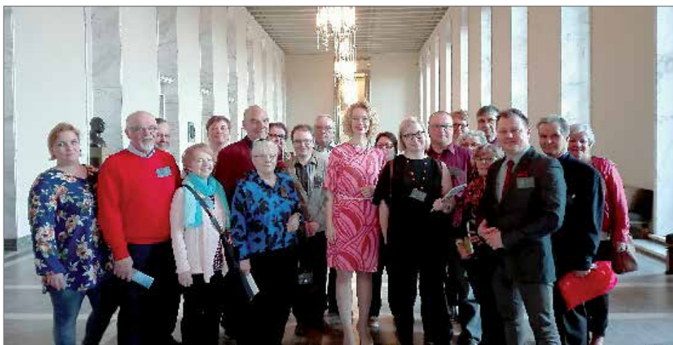
Koillismaalaisten demarit yhdessä kansanedustaja Tytti Tuppuraisen vieraina.