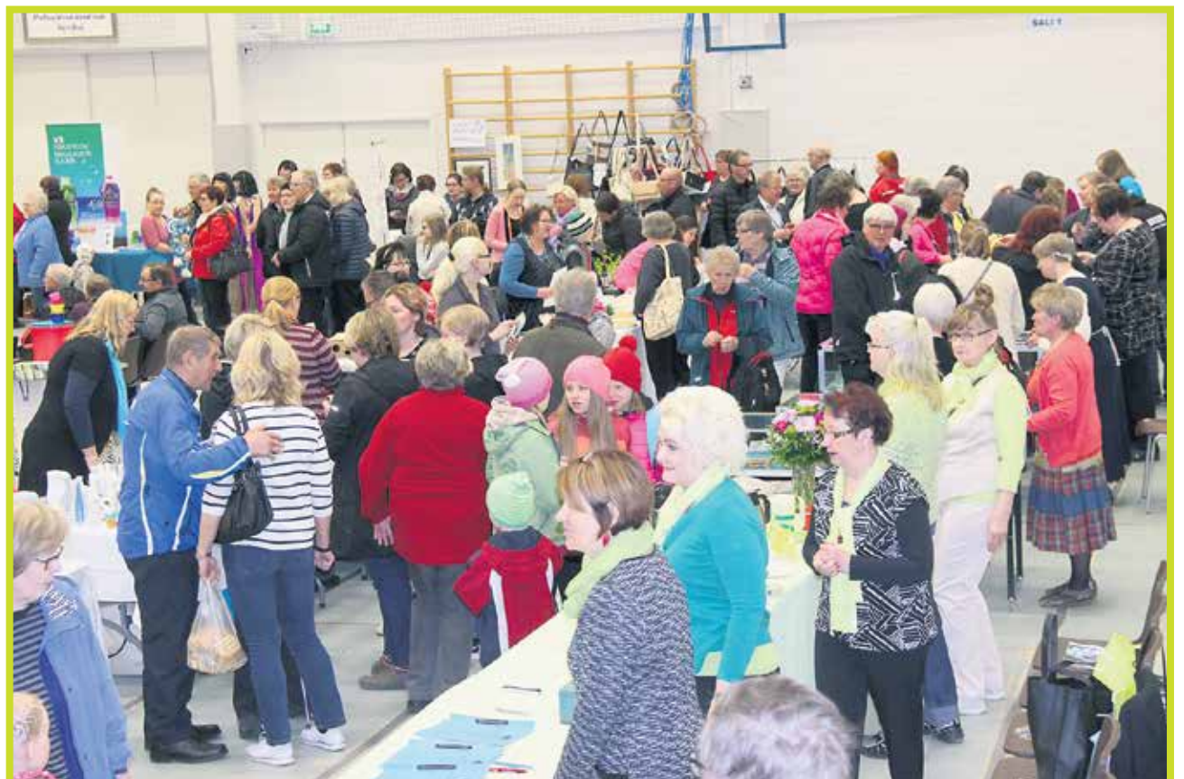
LC Pudasjärvi Hilimat olivat tyytyväisiä Hyvän Olon Messujen onnistumiseen. Hyväntuulisia messuvieraita oli paljon liikkeellä ja Hilimat saivat messuilla kerätyksi varoja hyväntekeväisyyteen.