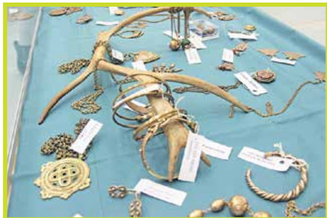
Kalevala Koruja oli esillä messuilla ja moni messuvieras ihasteli niitä.