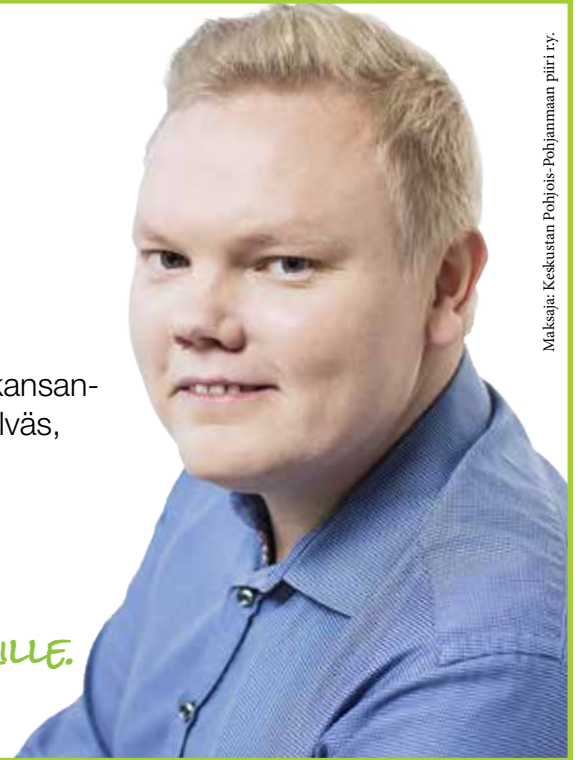
Maksaja: Keskustan Pohjois-Pohjanmaan piiri ry.

KOKOUS ON AVOIN KAIKILLE. Tervetuloa mukaan!