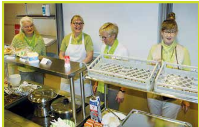
Messujen järjestäjien Hilimojen kahvilassa oli koko ajan vilkasta. Ruokana tarjottiin Lapin ukon juhlakeittoja ja kahvin kanssa oli valittavana monipuolinen kahvileipävalikoima.