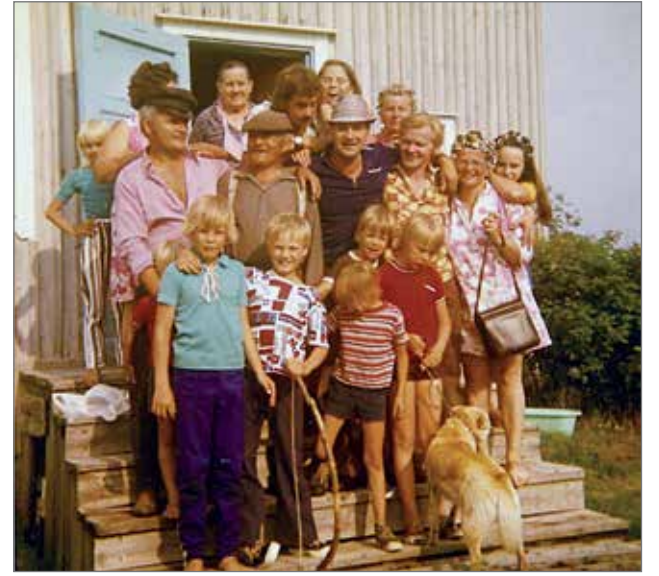
Kesäloma oli vuoden kohokohta niin Suomeen jääneille kuin Ruotsin siirtolaisillekin. Esimerkiksi Pintamon Huit-sinvaaran erämaatalon väki moninkertaistui kesällä 1970.

Pudasjärvi on 1960-luvulta saakka ollut muuttotappio-