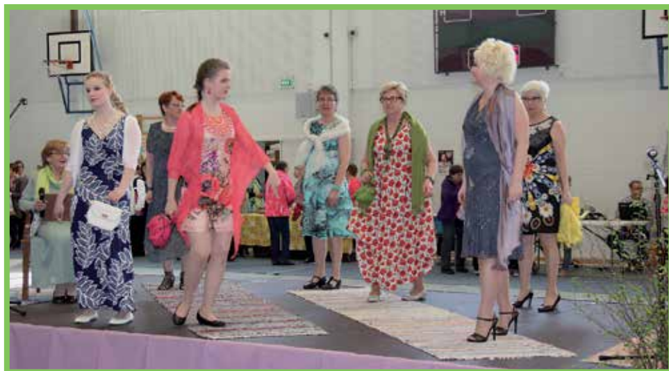
Pudasjärveläisen Vaatepuoti Hertan valikoimasta kootussa muotinäytöksessä nähtiin niin arki- kuin juhla-asujakin.