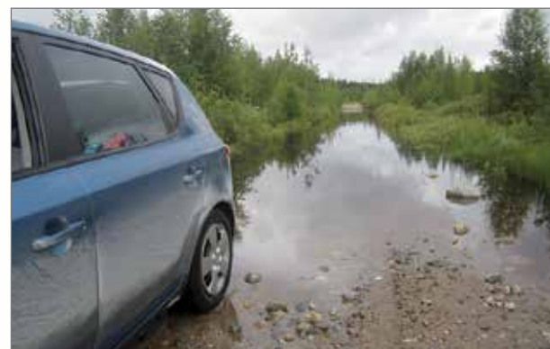
Joskus olisi hyvä olla vene matkassa.

Kerromme näissä jutuissa, millaista avustustyötä teemme Vian Karjalassa ja Koillismaalla.