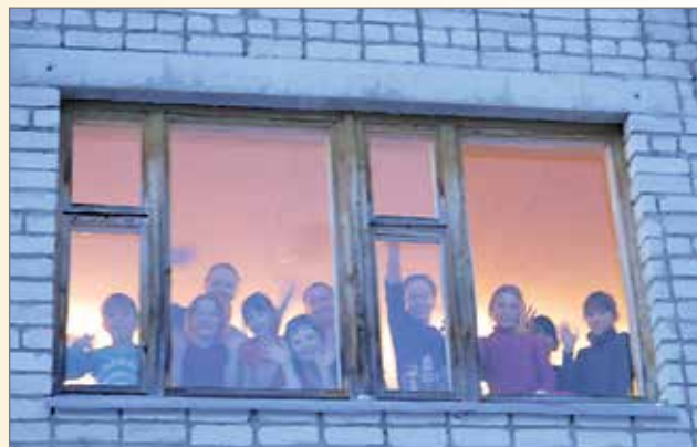
Lapset lähettivät paljon terveisiä ja kiitoksia kaikesta avustuksesta. Tässä heitä urheilutalon ikkunassa vilkuttamassa.

Vuonna 2015 jäsenmaksuista kirjattiin 7515 euroa. Toimintamme ensimmäinen ja tärkein periaate on, että jäsenmaksu käyteen 100 prosenttisesti avustustyöhön. Vian Karjalan avustus oli 10.787,02 euroa, kotimaan avustus 2296,43 euroa, ystävälapsitoiminnan kautta apua annettiin 822,32 euroa.