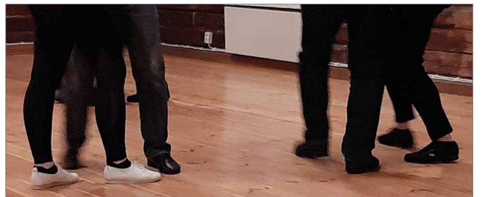
Tanssivat jalat.