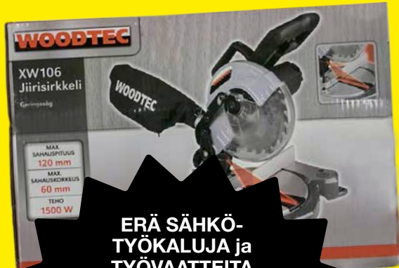
ERÄ SÄHKÖ- TYÖKALUJA ja TYÖVAATTEITA

POISTO POISTO POISTO POISTO POISTO POISTO POISTO POISTO POISTO POISTO ALE ALE ALE ALE ALE ALE ALE ALE ALE ALE