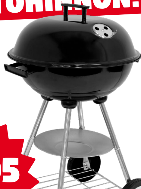
BBQ KING PALLOGRILLI Grillin kupu ja hiilikaukalo ovat emaloitua terästä. Lämpötilaa voi säätää kannen ilma-aukkojen avulla. Pyörillä varustettu jalusta helpottaa grillin siirtelyä. Mitat: 47,5 x 44,5 x 74 cm, grillausalan halkaisija 41 cm. Norm. 19,95