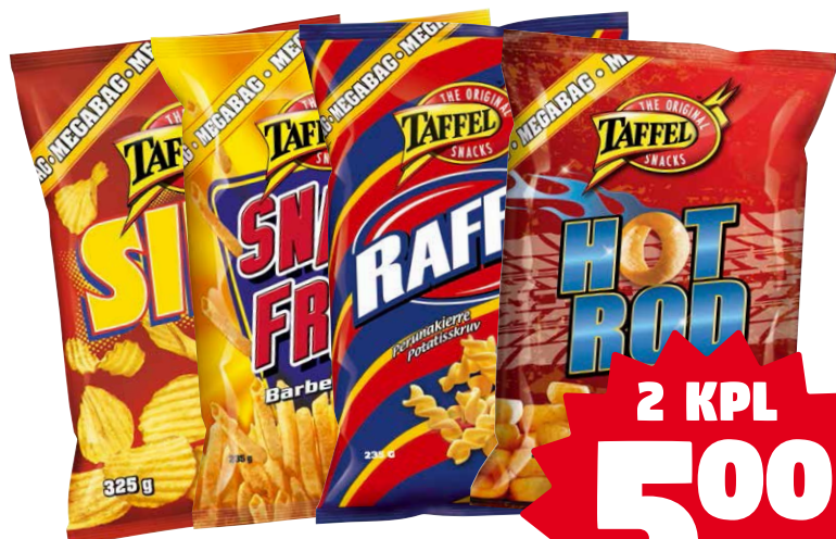
TAFFEL PERUNALASTUT 235-325 g (6,15-8,51/kg) Norm. 2,55/ps

UUDISTAMME MYYMÄLÄN TUOTEVALIKOIMAA PALJON TUOTTEITA POISTOHINNON!