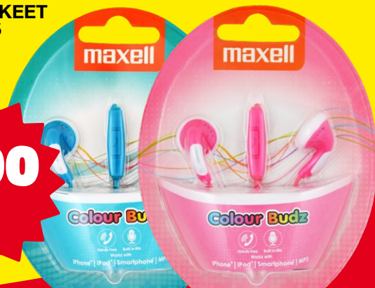
MAXELL KUULOKKEET Norm. 5,95

Tutustu ja hae täysin ilmaista Tokmannin Yrittäjän Etukorttia osoitteessa tokmanni.fi/yrityksille tai täytä paperinen hakemus paikan päällä myymälässämme.