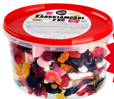
NAMIPÄIVÄ KARKKI- ÄMPÄRI 2 kg (3,45/kg) Norm. 8,50