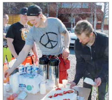
Rakennusmiehet nauttivat harjannostajaisissa perinteisesti tarjottavaa hernekeittoa ja täytekkukahvit. Taustalla näkyvillä tontilla oleva Pikku-Paavaliin päiväkotia.