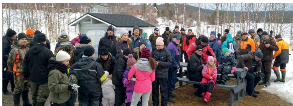
Palkintojen jakamisen jälkeen jäätin vielä keskustelemaan ja vaihtamaan kisakokemuksia.

Miesten/yleiseen sarjaan osallistui 33 henkilöä, naisten sarjaan 13, nuorten sarjaan kolme ja lasten sarjaan peräti 17 innokasta pilkkijää.