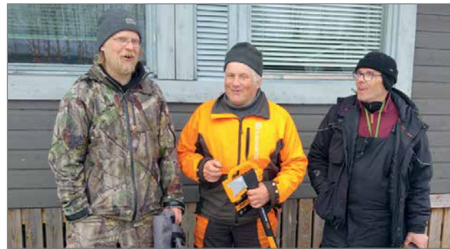
Miesten kolme parasta palkintojen kanssa.

Kouvanjärvellä oli perinteiset Kouvan kalastuskunnan järjestämät pääsiäisajan pilkkikilpailut lankalauantaina 20.4. Järven jää sai täyden kympin. Niin kilpailijat kuin katsojat saivat kokea pitkästä aikaa sen tunnelman, kun jään pinta on pakkasen karskeaa ja järven kannella sai kävellä kuin parhaiten hoideutulla kadulla. Väkeä saapui läheltä ja kaukaa niin kisaamaan kuin kannustamaan ja rupattelemaan tuttujen kanssa Piipposenpirtin rantamaisemaan.