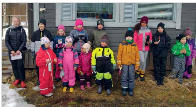
Lasten sarjan osallistujia, osa oli jo kotimatalla.

Loistavat olosuhteet mahdollistivat makkaroiden ja kahvilatuotteiden jakelun kilpailujen aikana myös kisailijoille. Kauppa kävi niin jäällä kuin rannallakin. Munkit ja makkarat lisuk-