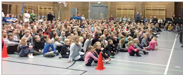
Tämän vuoden Kansallisen Veteraanipäivän päivän vietosa otettiin huomioon veteraanien lisäksi huomioon myös nuoret.