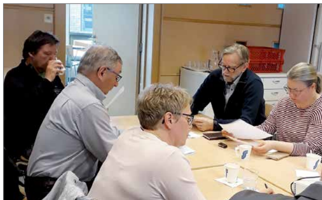
Kevätkokouksessa todettiin asiat hoidetun mallikkaasti. Kun seuran talous on kunnossa, on hyvä toimia Yhdessä PuU:n parhaaksi!