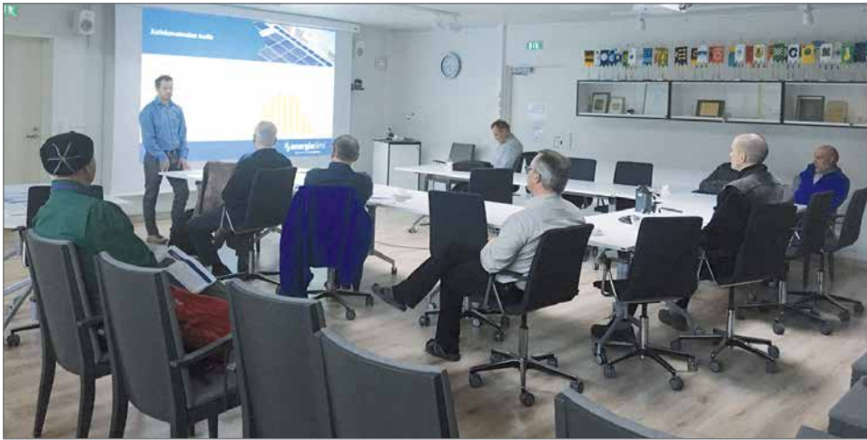
Pudasjärven yhteishankinta infossa keskustelua herätti mm. takaisinmaksuaika, rakentamiseen liittyvät asiat ja paneelien kestävyys ja takuu.