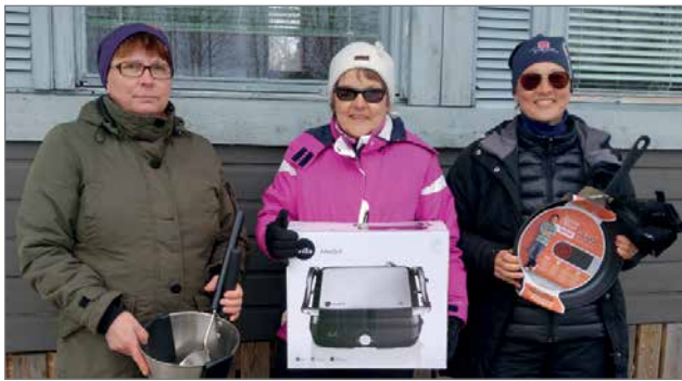
Naisten sarjan palkitut.