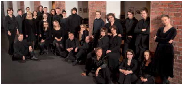
Vuodesta 2007 lähtien kuorossa on laulanut myös naisia ja kirkkomusiikin ammattiotiskelijoita.