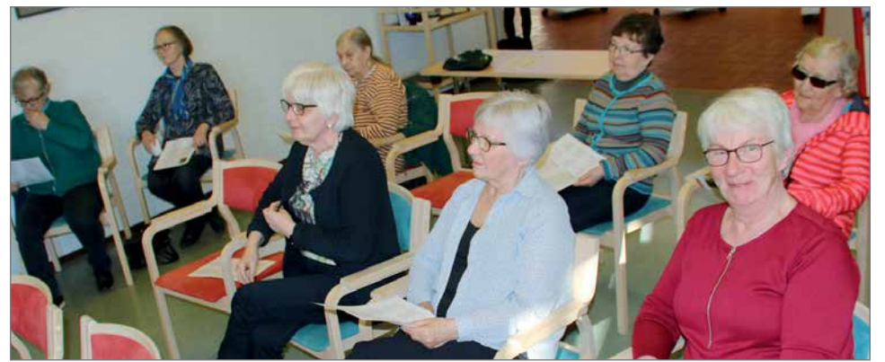
Runoiltaan osallistujat saivat tutustua etukäteen Vähälän ohjelmiston listaan ja poimia sieltä toiverunojaan.

Kuntayhtymien hallinnoissa toimivat kaupungin hallituksen jäsenet antoivat ajankohtaiskatsauksen ja kokouksessa kuultiin myös Oulunkaaren palvelutuotantolautakunnan ja PPHS:n hallituksen ajankohtaiskatsaukset. RR