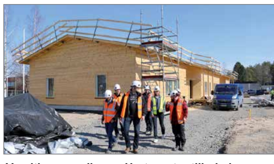
Varsitien varrelle ns. Hartsun tontille kohoavaan hirsiseen päiväkotiin on tutustuttu ja harjannostajaisväkeä on siirtymässä nauttimaan hernekeittoa ja täytekkukahvit. Päiväkodin edustalle tulee leikkikenttä ja kuvassa näkyvälle rakennuksen päädyn alueelle tulee asfaltoidut kulkureitit ja autojen parkkipaikka.