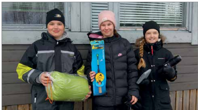
Nuorten sarjassa oli kolme osallistujaa, jotka kaikki palkittiin.