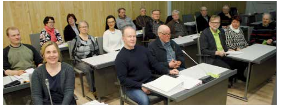
Keskusta Pudasjärven kevätkokousväkeä kaupungintalon valtuustosalissa.

Kokouksessa käytiin läpi sääntömääräiset asiat sekä keskusteltiin valtuustoryh-