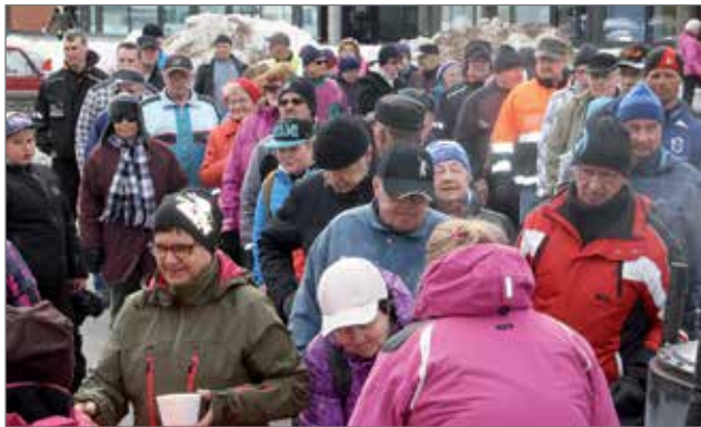
Juhlan lopuksi yleisö järjestäytyi hernekeittonoon, kaikille riitti Pitopalvelu Illiikaisen keittämää soppaa ja santsatakin sai.