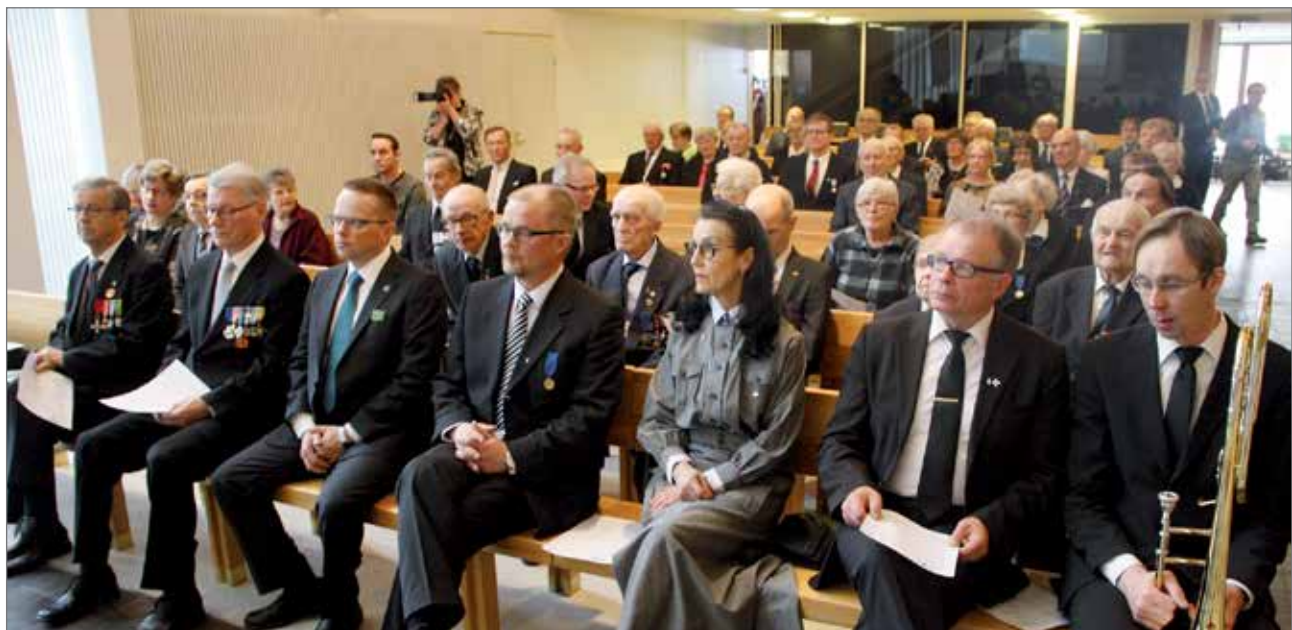
Kansallisen Veteraanipäivän juhlaa vietettiin teemalla "Sinun Veteraanipäiväsi".

-Päivän teema tulee suoraan kohti myös minua; mitä minulle merkitsee Veteraanipäivä tänään? En-