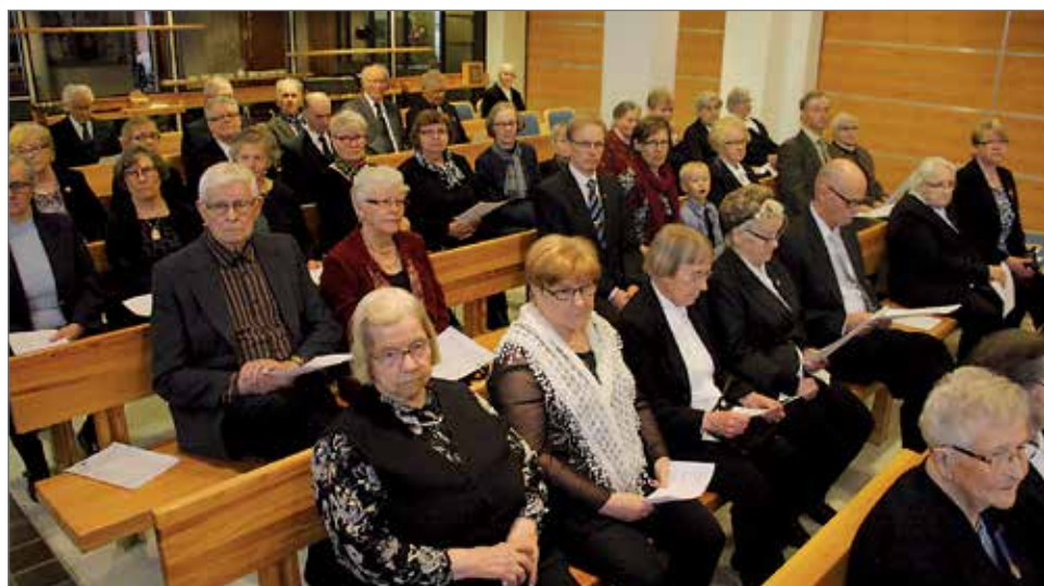
Veteraanipäivän juhlan järjestäminen Pudasjärvellä on vuotuinen perinne.