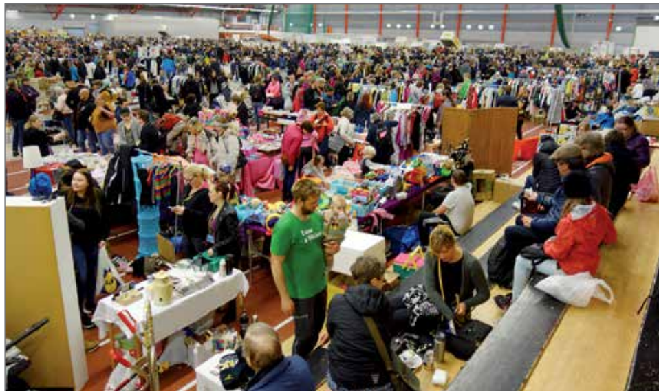
25.ttä vuottaan juhliva Luulajan suurkirpputori on Ruotsin suurin kirpputoritapahtuma. Se on kasvattanut suosiotaan myös suomalaisten keskuudessa.

Perustajat eivät osaa tarkalleen sanoa, mitä suomala-iset messuilta hakevat. Heidän kokemuksensa mu-kaan Luulajasta Suomeen lähtee kuitenkin muun mu-