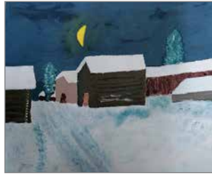
Graafinen pihapiiri öljyväreillä toteutettuna.