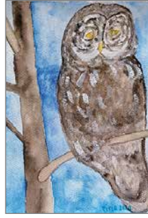
Taidokas akvarellityö oksalla tuijottavasta pöllöstä.

Taidokas öljyväretyö syysruskasta, joka on taiteilijan ensimmäinen teos paletti-veitsellä työstettynä.