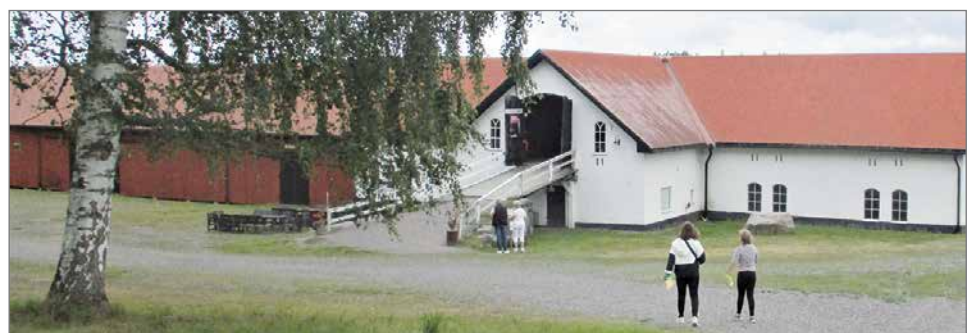
Entisestä tallista on tehty näyttelytila.