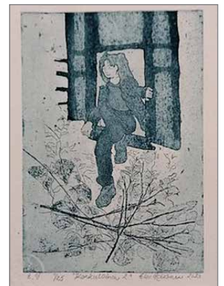
Helpoin tapa aloittelijalle on tehdä pehmytpohjan avulla laattoja käyttämällä erilaisia materiaaleja.

jonka päälle laitetaan kuparilaatta kuvapuoli kohti paperia. Kuva siirretään paperille prässämällä tai vedostamalla. Tätä voidaan tehdä myös värillisinä.