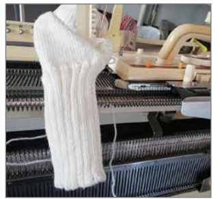
Sukat kantapääkavennuksineen voidaan suorittaa myös koneneulon.

lenkiintonsa ilmaista suoraan kansalaisopistolle joko vastuuoopettaja Vuokko Nymanille tai osoitteeseen kansalaisopisto@pudasjarvi.fi