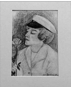
Hiilityö nuoresta ylioppilaasta.

tajalta löytyy jotakin työskentelyyn liittyvää materiaalia ostettavaksi.