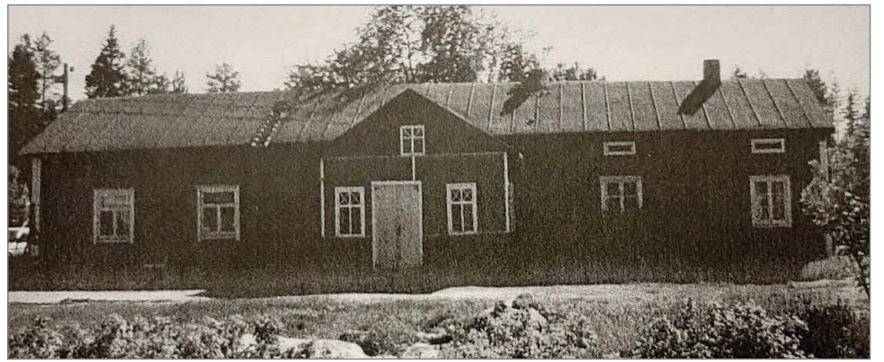
Tulipalon jälkeen rakennettu Sakarila talo.

Myöhemmässä vaiheessa kauppa siirtyi pirtin päähän rakennettuun kauppahuoneeseen.