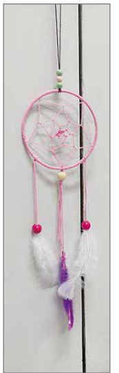
Tytöt tekivät äideillensä unisiepparit.

makrameekoruja sekä joulun alla minimakrameeta kanelitankoon. Siitäpä saatiin jouluihin tuoksu ja lahja kortin muodossa! Tytöt sol-