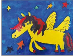
Iloinen satuhahmo toteutettuna akvarelli-tussityönä, jossa värit erottuvat selkeästi.