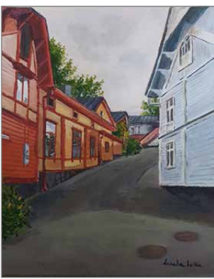
Perspektiivitaidetta toteutettuna öljyväriyönä.

Tarvikkeet oppilaat hankkivat itse, mutta myös opet-