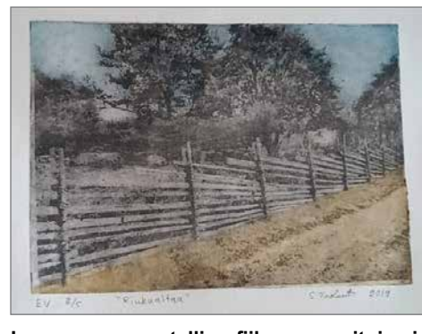
Imagon on metalligrafiikan suosituin ja myös haastavin menetelmä.

Taideteos saadaan aikaan kaikissa menetelmissä samalla tavalla. Väri levitetään kuparille ja ylimääräinen väri hantataan pois. Prässille asetetaan kostea syväpainopaperi,