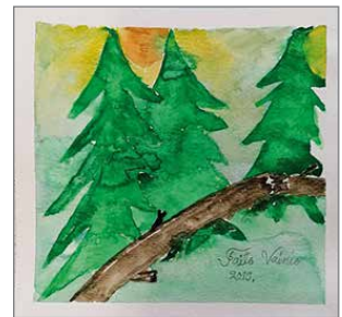
Oman ajatuksen voimalla tehty akvarellityö metsästä.

Kansalaisopiston virtuaalinäyttelyä katsellessa näitten Räisänen ryhmien ero näkyy selvästi siinä, että Työkeskuksen puolella ilotellaan selkeil-