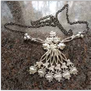
Ruusulusikoitten varsista taidokkaasti valmistettu tanssijatar-riipus.

Useammalla hopeakurssilla olleitten mielenkiinto alkoi suuntautumaan laajemmalle alueelle ja kevätlukukauden aikana alettiin koruja työstämään hopealevystä, joka on lähtökohdaltaan hieman erilaista tekemistä. Hopealevystä voi tehdä muutakin esineistöä