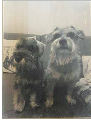
Kuvia voidaan siirtää myös puuhun.

Syyslukukaudella Livon käsityöpiirissä valmistui betonitöitä kankaankudon-