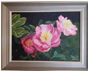
Öljyvärimaalaus herkistä pionin kukista.

laista neulontaa puikoilla ja virkkaamista koukulla. Samalla opeteltiin myös suomen kieltä! Vastaavasti opettaja sai uusia ideoita ja oppi erilaisia tekniikoita käsityötaitoisilta monenlaisiin kulttuureihin kuuluvilta maahanmuuttajilta.