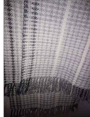
Pietarilan kudontapajassa valmistui monenlaista käsityötä, kuten huopia ja kuultokudoksia.

Pietarilan kudontapiiri on vuodesta toiseen suosittu kurssi ja tulijoita on aina enemmän kuin mitä on mahdollista ottaa vastaan, sillä kangaspuitten määrä rajoittaa osallistujat. Pietarilassa on kahdettoista kangaspuuta, joissa valmistui erilaisia kädentaidon näytteitä räsymatoista herkkiin kuultokudok-