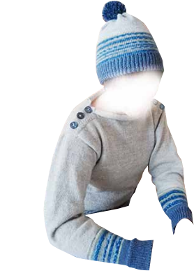
Koneneulomalla voidaan tehdä piposta sukkiin ja kaikkea siltä väliiltä.

Vuosittain Työkeskus teettää Oulunkaarelle kalentereita kuvataidepiirissä tehdyistä töistä.