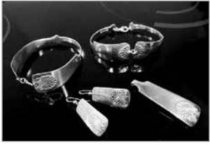
Aterimien varsista valmistettu korusetit.