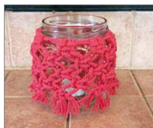
Joulun alla Nuokkarin Kädentaitopajassa makrameesolminnalla valmistui monenlaisia koruja.