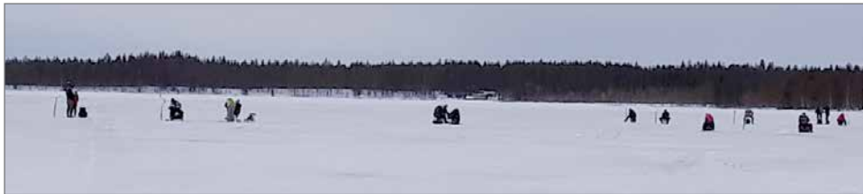
Pilkkisää oli pilvipoutainen.