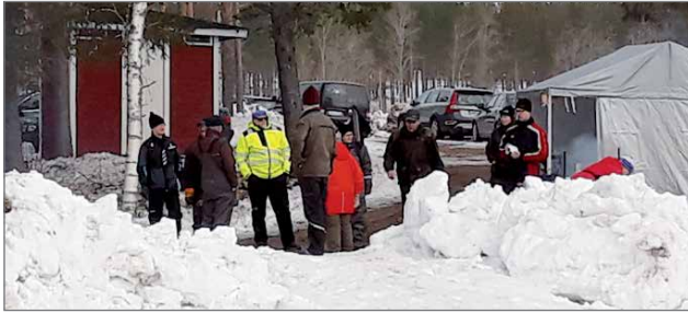
Neljän tunnin pilkkimisen jälkeen kokoonnuttiin punnitukseen ja nauttimaan kisakahvilan antimia.

Yleisö sai kisakahvilasta makkaroita, kahvia, munk-