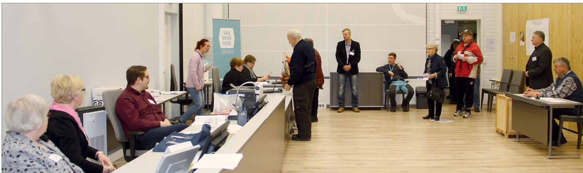
Kaikki valmiina äänestyksen aloittamiseen kaupungintalossa.