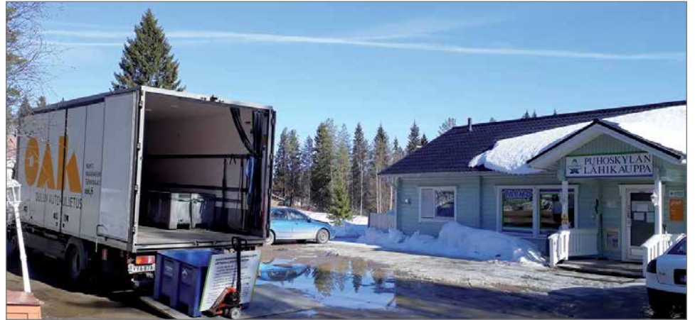
Kiertokaari kerää maksutta kotitalouksien vaarallisia jätteitä 16.4.–4.7. kaikista toimialueensa kunnista. Pudasjärvellä toteutettiin ensimmäinen keräys tiistaina 16.4. Puhoskylältä Kipinä.

Jo pienikin määrä vaaralliseksi luokiteltua ainetta voi aiheuttaa veden tai muun ympäristön saastumisen tai haittaa eläinten ja ihmisten terveydelle. Viemäristä vaarallisia aineita päätyy lopulta vesistöön, koska jätevedenpuhdistamot eivät pysty kaikkia haitallisia aineita poistamaan. Kodin roskien sisältö päätyy jättevoimalaan, jossa vaaralliset jätteet voivat aiheuttaa pa-