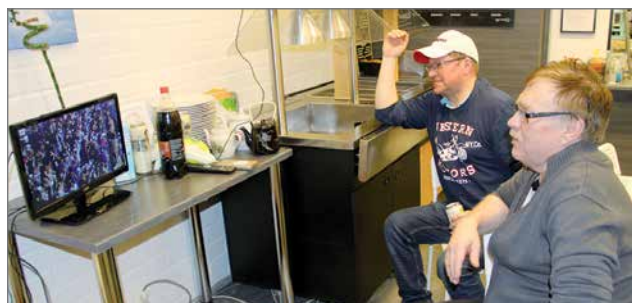
Perussuomalaisten vaalivalvojisissa oli sivupöydällä toinen tv avoinna, josta seurattiin Naisten MM-jääkiekon loppuottelua Suomi-USA. Hurraa huuto kuului, kun Suomi tasoitti ottelun 1-1.