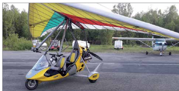
Koulutus tapahtuu Pietilän Tanarg Air Creation koneella.