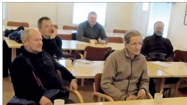
Lentäjänmajalla kuunneltiin tarkkaavaisesti uudesta lentäjäkoulutuksesta, joka alkaa huhtikuun lopulla Pudasjärven lentokentällä.

Mahdollisuus vuokrata myös lyhyemmäksi aikaa kalustettuna. Tiedustelut: p.050 501 9090.