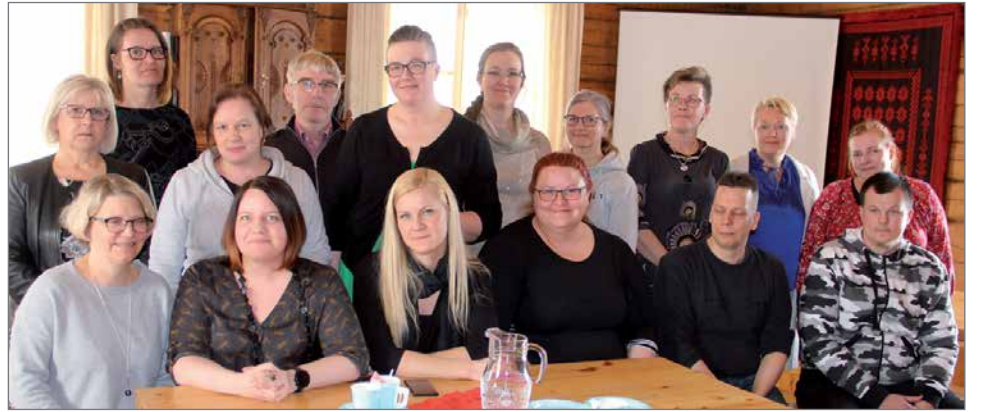
Valpas-hankkeen järjestämän tilaisuuden osallistujat saivat tietoa, kuinka kehitetään työllistämisen- ja kuntoutuspalveluja.

Kemijärven kaupungin maksamat työmarkkinatukimaksut ovat alentuneet merkittävästi pitkäjänteisen moniammatillisen yhteistyön tuloksena. Se on kiistan osoitus työllisyysyksikön toimintamallin toimivuudesta. Työmarkkinatukimaksut ovat pudonneet vuositasona noin 240 000 euroa. Pitkäaikaistyöttömyys lukuina on laskenut vuoden 2015 270 henkilöstä tämän hetkiseen 59 henkilöön.