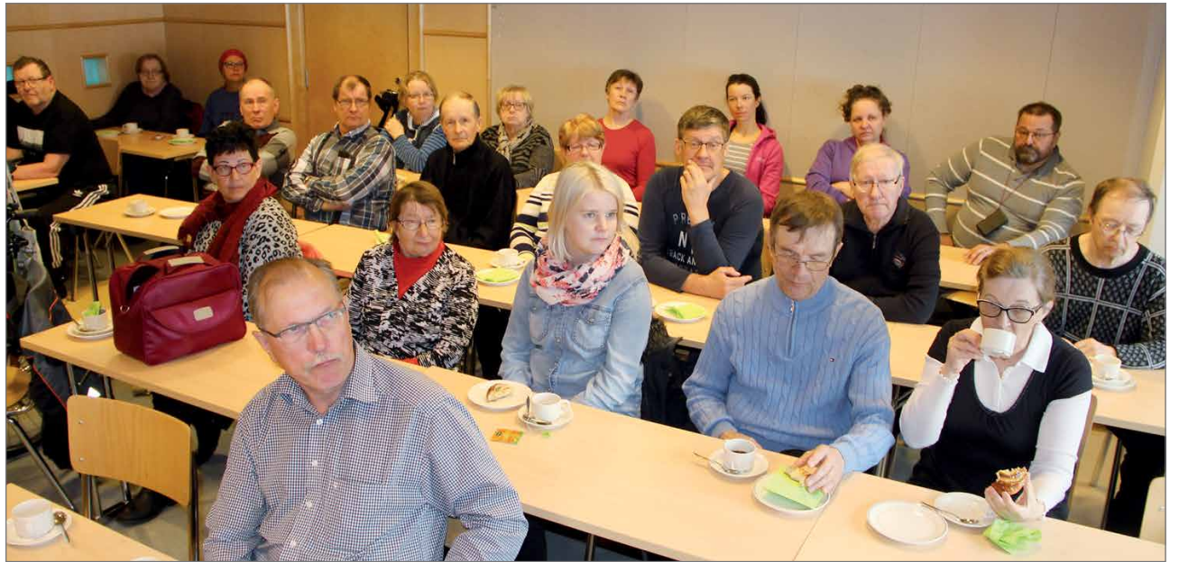
Virkistysuimala Puikkarin tiloissa mietittiin neurologisesti sairaiden ja vammautuneiden ihmisten yhteistoiminnan kehittämistä Pudasjärvellä.

Toinen asia joka huolestutti osallistujia, oli neurologin palvelujen puute. OYS jossa on neurologien vastaanotot sijaitsevat kaukana palveluja tarvit-