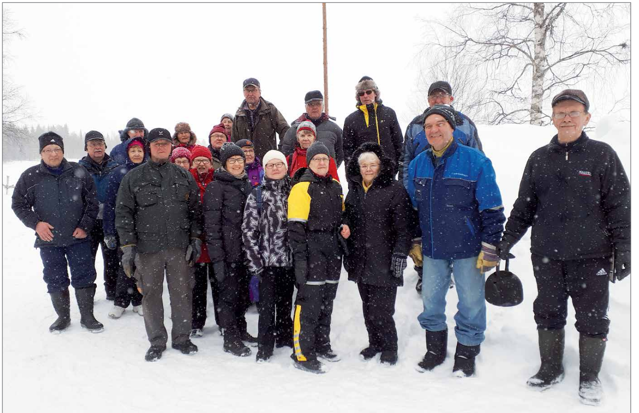
Jaurakkajärven laavulla oli kisailuohjelmaa ja järvellä pilkkimistä.