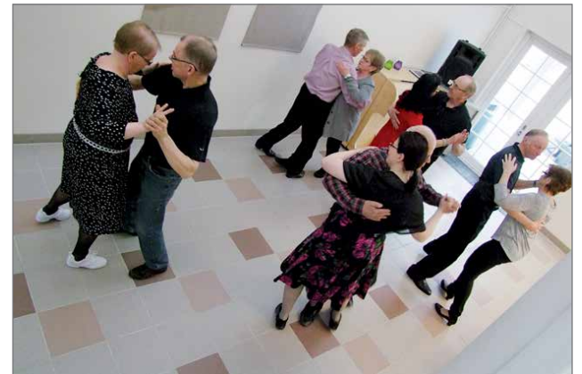
Kansalaisopiston lava- ja kansantanssikirssilaisien tanssirit esittivät taitojaan tanssimalla humpppaa ja tangoa.