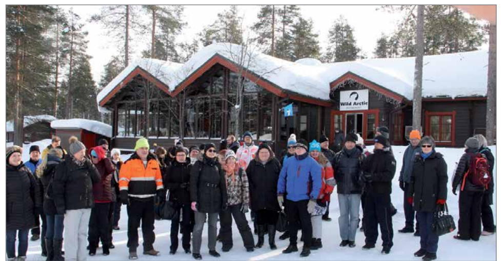
TyöTakomo hanke järjesti maaliskuussa Jääkarhuseminaarin Ranuan eläinpuistossa, johon osallistui Pudasjärvellä 19 henkeä. Kuva seminaariväen lähdöstä eläinpuiston tutustumiskierrokselle.

neet henkilökohtaisten keskustelujen lisäksi työnhaun asiakirjojen laatimista, yrittävien kunnossapitoa, työhaastatteluharjoituksia ja -kontakteja sekä vaivattomasti etäyhteydellä toteutettuja erilaisia lyhyitä valmennuksia ja infoja. Ehdottomasti motivoituneimpia asiakkaat ovat olleet henkilökohtaisiin keskusteluihin, mutta hankkeessa on pyritty kannustamaan vuorovaikutukseen myös laajemmissa yhteisöissä. Hankkeessa onkin toteutettu kaksi verkostoitumisretkeä, joista ensimmäinen suuntautui Haaparantaan ja toinen Ranualle. Retkillä tutustuttiin, yli Oulunkaaren kuntarajojen, muihin työnhakijoihin, työllistämispalveluiden henkilökuntiin sekä yrittäjiin. Ensimmäisellä retkellä oli 29 ja toisella 56 osallistujaa. Verkostoitumisen lisäksi retkien tarkoitus oli kannustaa työnhakijoita tuomaan oman äänensä kuuluviin työllisyyden hoidon suhtein.