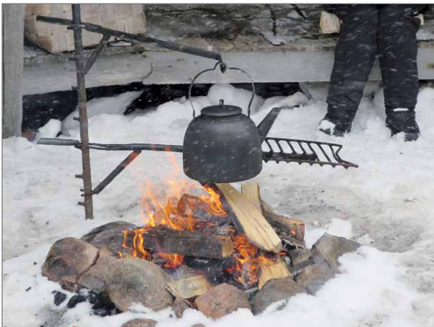
Nokipannukahvit oli laitettu nuotiolle jo retkiväkeä odottaessa.

Eläkeliiton Pudasjärven osasto suoritti retkeily- ja ulkoilupäivän pääsiäisen jälkeen tiistaina Jaurakkajärvellä. Sateisesta ja märästä kelistä huolimatta osallistuminen oli varsin runsasta, reilut 20 henkeä.