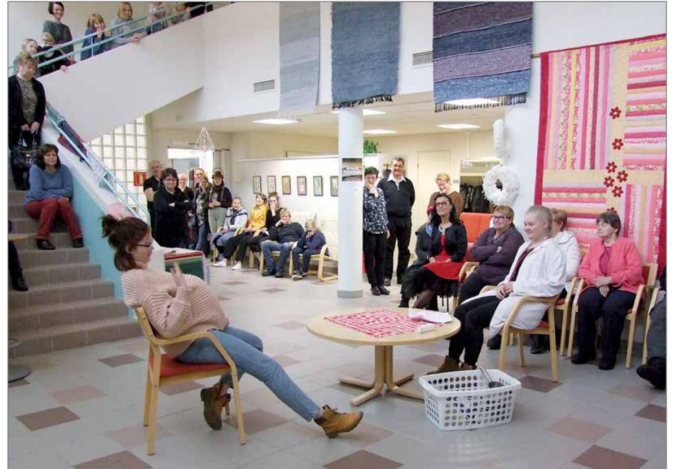
Lääkärin vastaanotolla -pionäytelmässä esiintyneillä potilailla oli jos jonkinlaisia vaivoja.

Ne ovat kuulemma käytössä kestäviä ja pehmeitä.