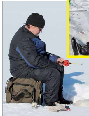
Pilkkiminen on tarkkuutta vaativa laji.

Saalista nousi kappalemääräisesti vähänlaisesti kahden tunnin kisan aikana. Kalat olivat sitäkin isompia, sillä tällä kertaa hauki oli syönnillä.