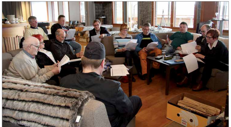
Kokouksessa oli noin 10 henkeä ja kokousasiat käsiteltiin rennosti sohvalta takkatulen ääressä.

Muissa asioissa puheenjohtaja Tommi Niskanen kertoi, että hän toivoisi yrittäjiltä aktiivisuutta käyttää yrittäjäjärjestön palveluja. Tarjolla on asiantuntijapalveluja, lakipalveluja ja monia muita. Ha-