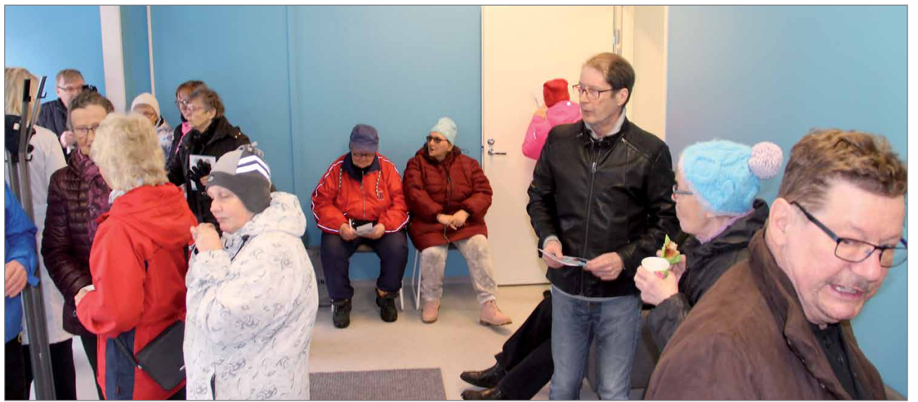
Koko avajaispäivän ajan oli vilkkaasti ihmisiä liikkeellä.