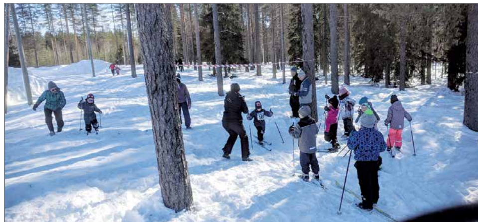
Vauhdikasta menoa maalialueella.