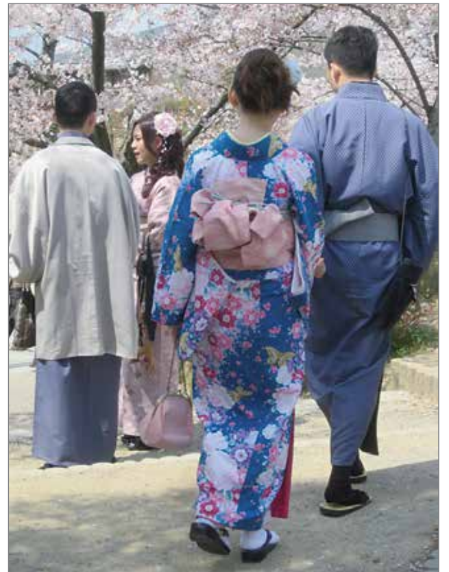
Kimonopukuisia hanamin juhlijoita.

Väenpaljoudessa kaksi japanilaista toimittajaneitosta kävelee vastaan. Toisella on videokamera, toinen kantaa mikrofonia. He haluavat haastattelun ja utelevat, mil-