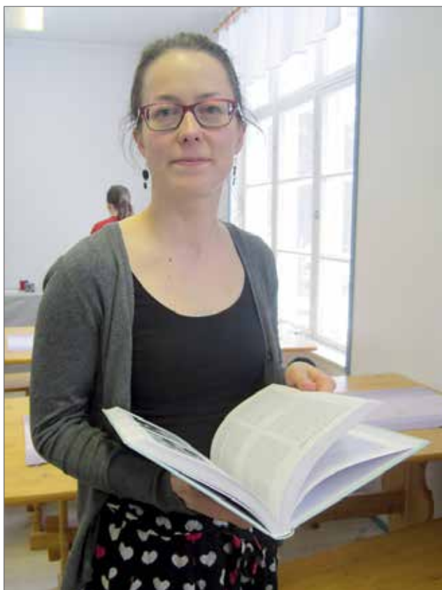
Kirjastonjohtaja kertoi Korpisella muun muassa OUTI-kirjastojärjestelmästä ja aprillipäivänvieron historiasta.

Celia-kirjastosta, joka palvelee niitä, joilla on vaikeuksia painetun tekstin lukemisessa. Äänikirjoja voivat lainata heikkonäköisten lisäksi esimerkiksi hoivakodit, palvelutalot ja yhteisöt. Kirjastosta kannattaa kysellä tarkempia tietoja, jos tarvetta erikoiskirjastolle on. RR