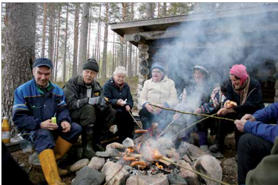
Virikepäivissä riittää väkeä, mutta lapsiperheitä kaivattaisiin mukaan.