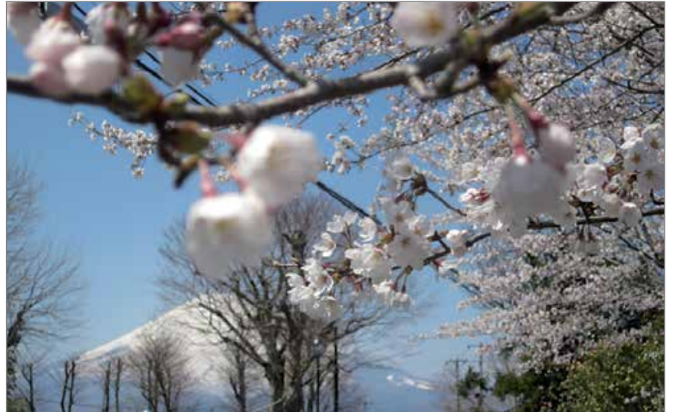
Kirsikankukkaa taustanaan Fuji-vuori.

Hanami-juhlan taustalla on aware, alakuloinen perusvire ja buddhalaisuudesta periytyvä elämänasenne. Se on ollut tyypillistä runoudessa ja muussa taiteessa.