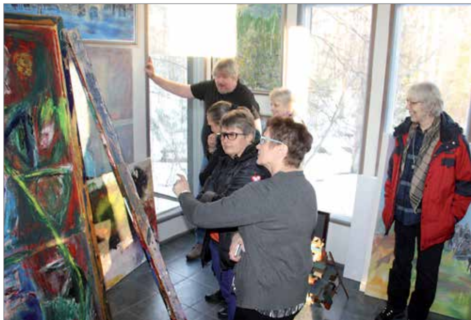
Kansalaisopiston aamu- ja iltamaalareilla oli paljon nähtävää ja uuden oppimista muun muassa taiteilija Ahosen rohkeasta värien käytöstä.