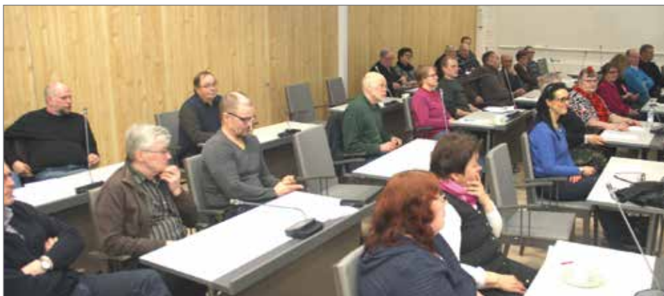
Kokousväki täytti valtuustosalin.

Valtuustosalin oli täynnä kokousväkeä ja puheenjohtajalla piti torpata kysymystulvaa kansanedustajalle, jotta päästiin kokouksessa virallisiin vuosikokousasioihin.