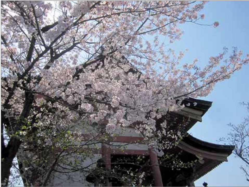
Kirsikankukkien hehkua Kiotossa Kiyomizun temppelellä.

Päivä näin tyyni. Kevät. Valoa tulee taivaan täydeltä. Mutta kirsikankukat varisevat yhtenä.