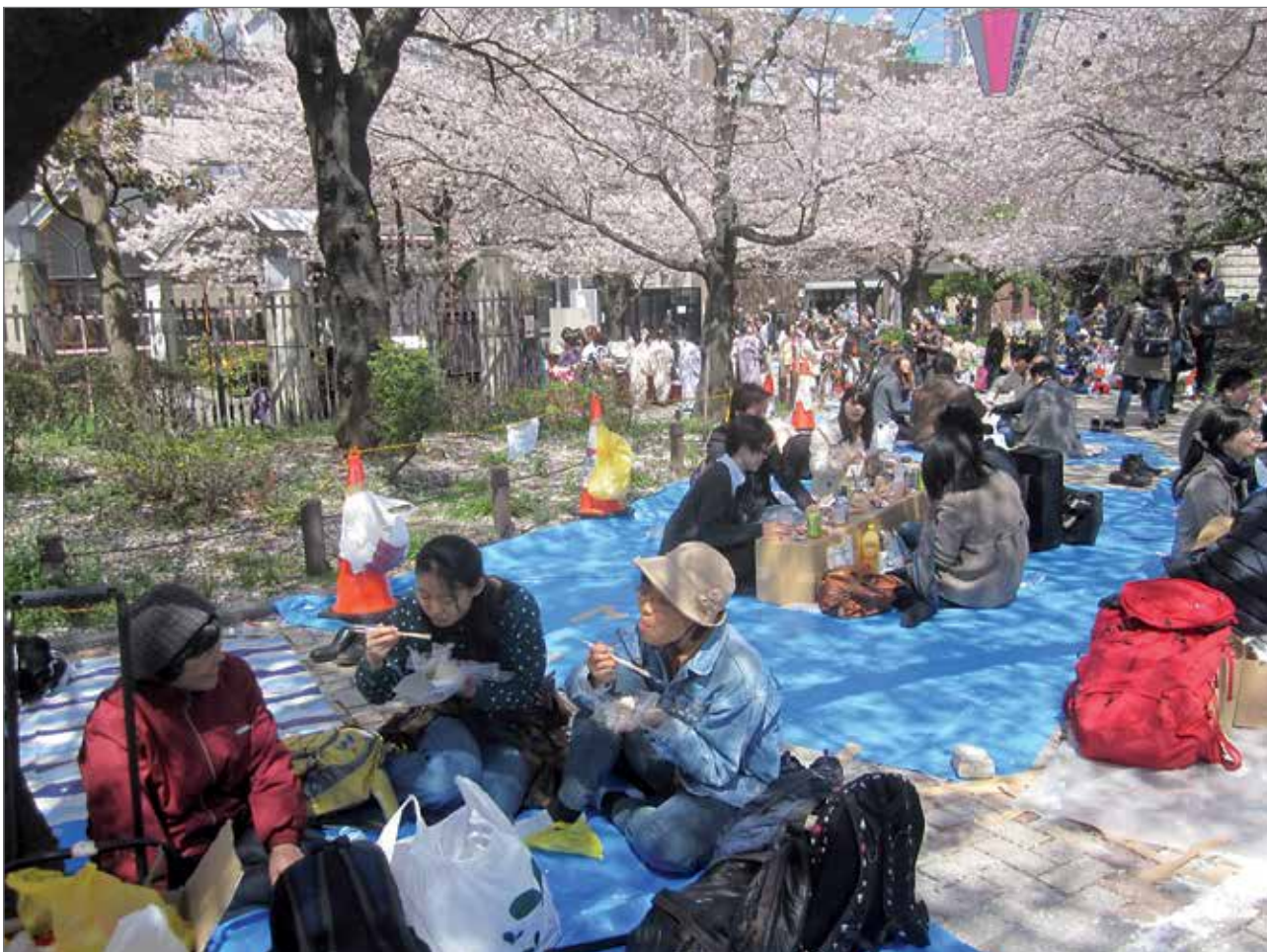
Hanamia juhlietaan piknikillä.