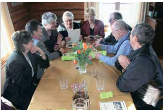
Vanhojen valokuvien katsominen toi mieleen muistoja yli 50 vuoden takaa.