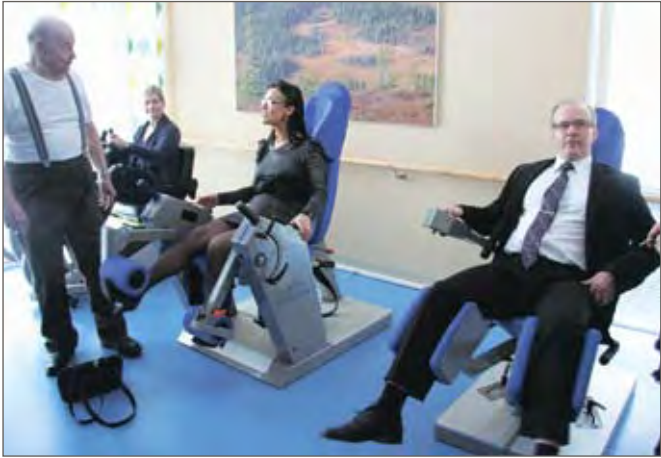
Taloon tutustumiskierroksella nähtiin muun muassa asukkaiden käytössä oleva nykyaikainen kuntosali.