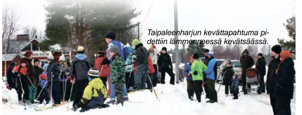
Taipaleenharjun kevättapahtuma pidettiin lämmenneessä kevätsäässä.