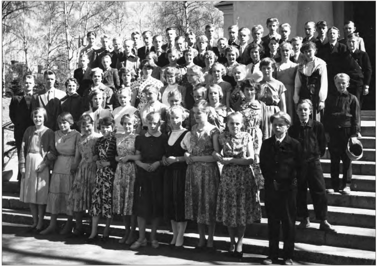
Kevätretkellä vuonna 1957 Oulussa Tuomiokirkon portailla.