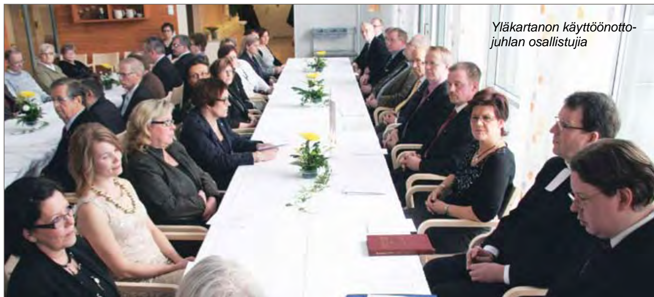
Yläkartanon käyttöönottojuhlan osallistujia