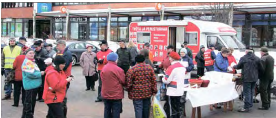
Vasemmistoliiton vaalikiertueeseen kuuluva vaaliryttinä kokosi runsaasti väkeä Pudasjärven torille.