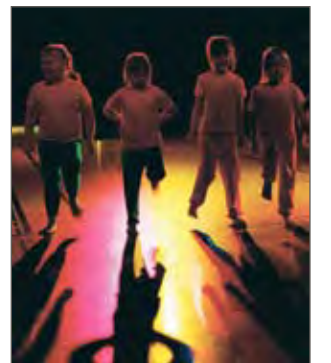
Vauhtia edellisen vuoden tanssi- ja liikuntanäytöksessä.

Vieraileva esiintyjäryhmä on Oulusta ja nimeltään Safir. Ryhmä esittää itämaisia tanssia; Ensimmäinen kappale on Habibi Arhamni ja