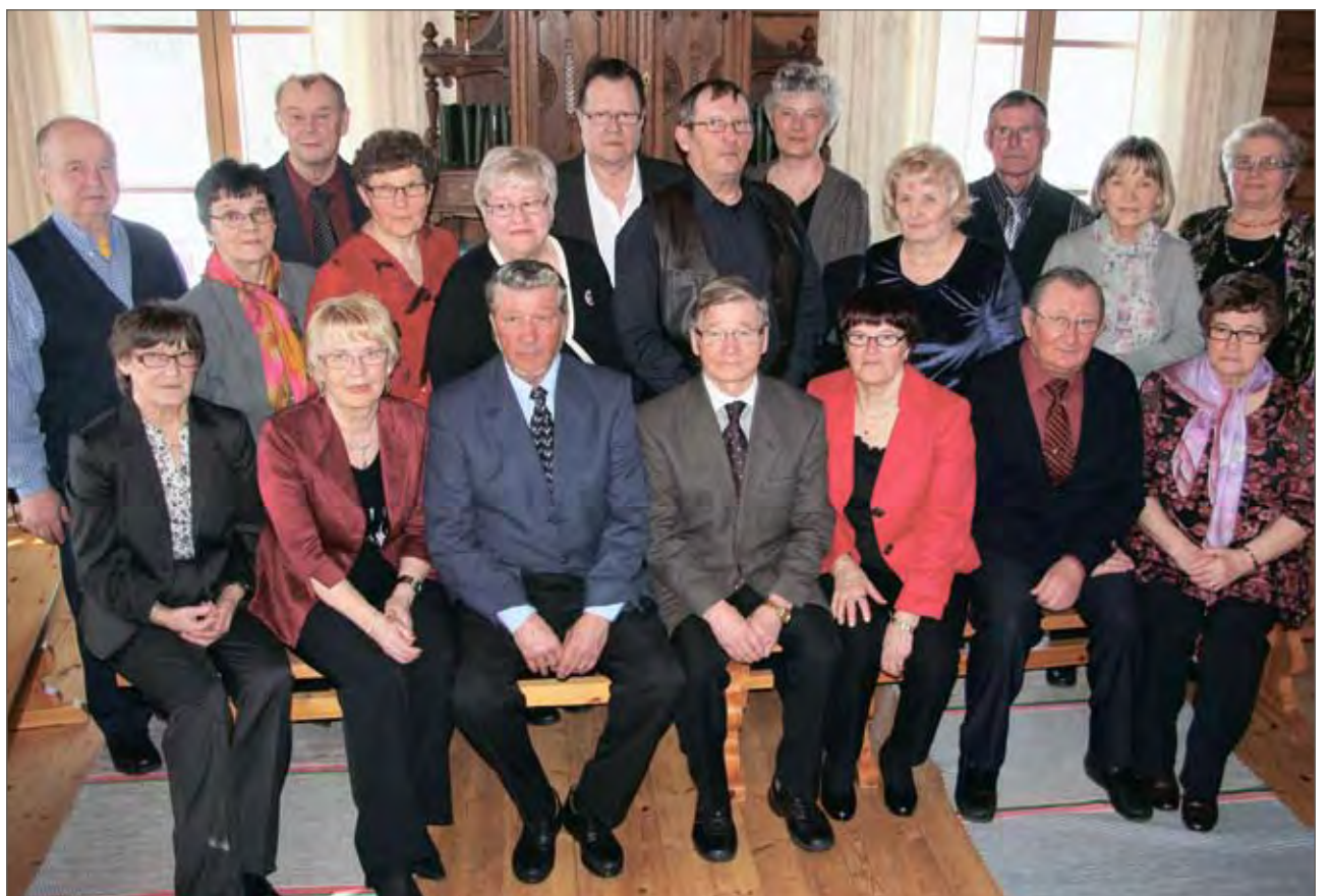
Uusi "luokkakuva" Liepeen pappilan väentuvassa yli 50 vuoden jälkeen.