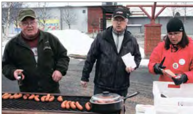
Grillimakkarat tekivät hyvin kauppansa.

Merja Kyllönen sanoi tekevänsä kansanedustan työtä täydellä tarmolla ja suurella sydämellä. Hän kantoi huolta tuloerojen kasvusta, joka vieraannuttaa ihmiset toisistaan. Hän vakuutti, että tasa-arvo luo turvallisen yhteiskunnan ja solidaarisuus ja yhdenvertaisuus ovat arvoja, jotka eivät vanhene. (ht)