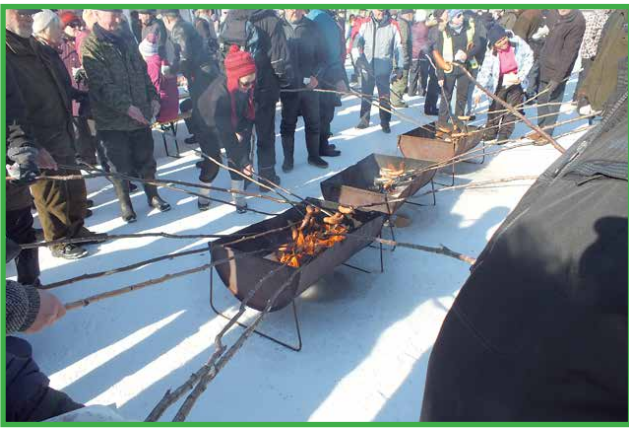
Nuotiomakkarat maistuivat päivän aikana.