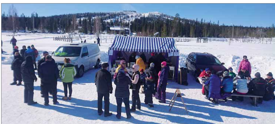
Kyläyhdistyksen kisakanttiinista sai lättäkahvia ja grillimakkaroita.