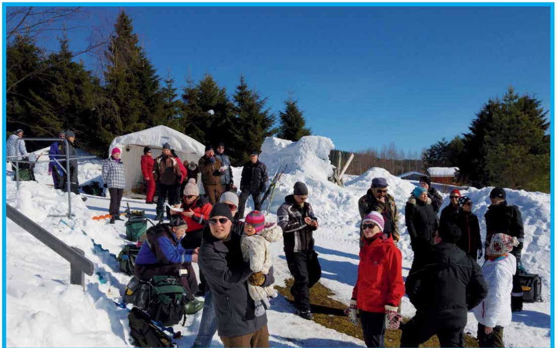
Grillimakkarat pitivät nälän loitolla.