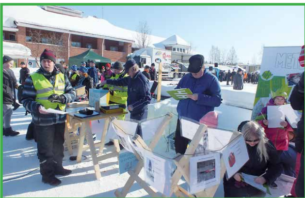
4H-yhdistyksen metsäaiheinen kilpailu oli suosittu.