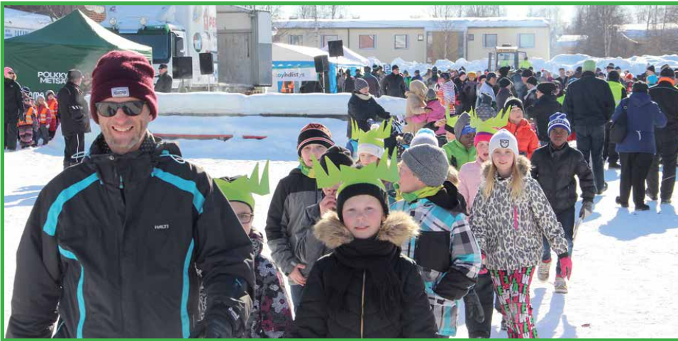
Hirsikampukselta tultiin Metsäpäiville suurella joukolla. Myös Lakarin koululaisia vieraili tapahtumassa useana ryhmänä.