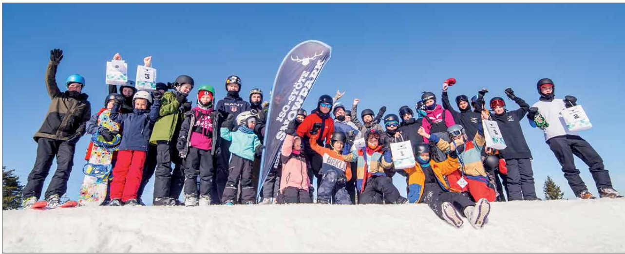
Rinnetapahtumissa oli sankoin joukoin osallistujia!