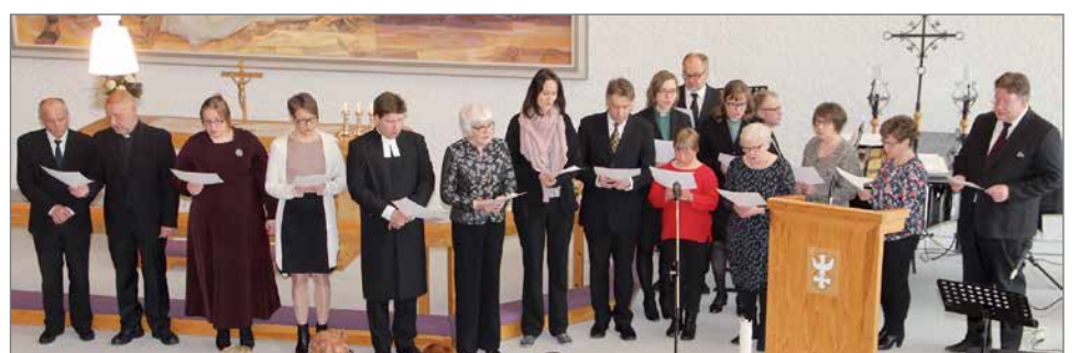
"Sinua siunata tahdon" lauloivat seurakunnan nykyiset ja entiset työntekijät.