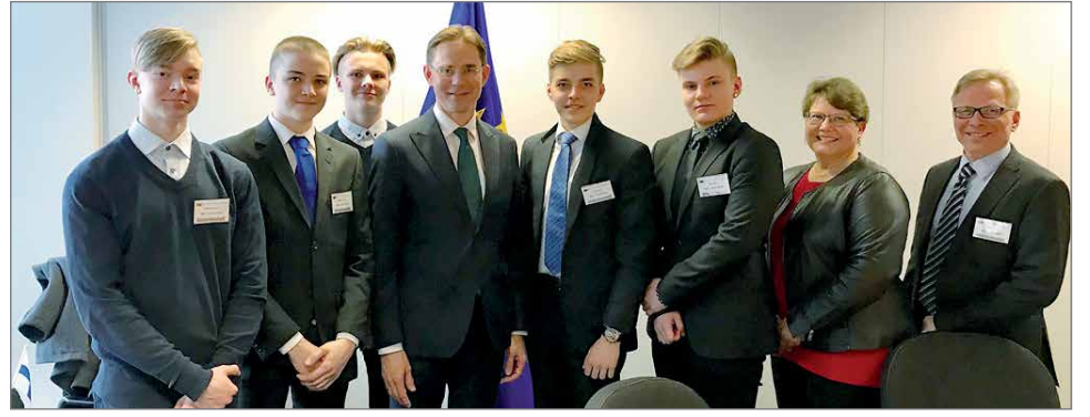
Komission kabinetissa Jyrki Kataisen vieraana.

Lyhyesti tiivistettynä reissumme oli yksi parhaista tähän mennessä! JA Euroopan järjestämä "Why Europe Matters" -konferenssi oli