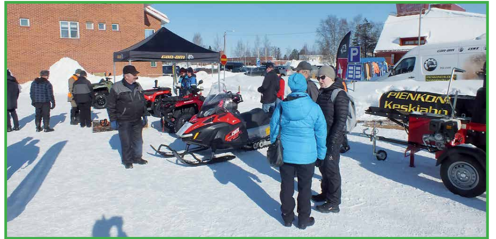
Keskiaho Oy:n osastolla oli esillä kattava valikoima moottorikelkkoja ja mönkijöitä.