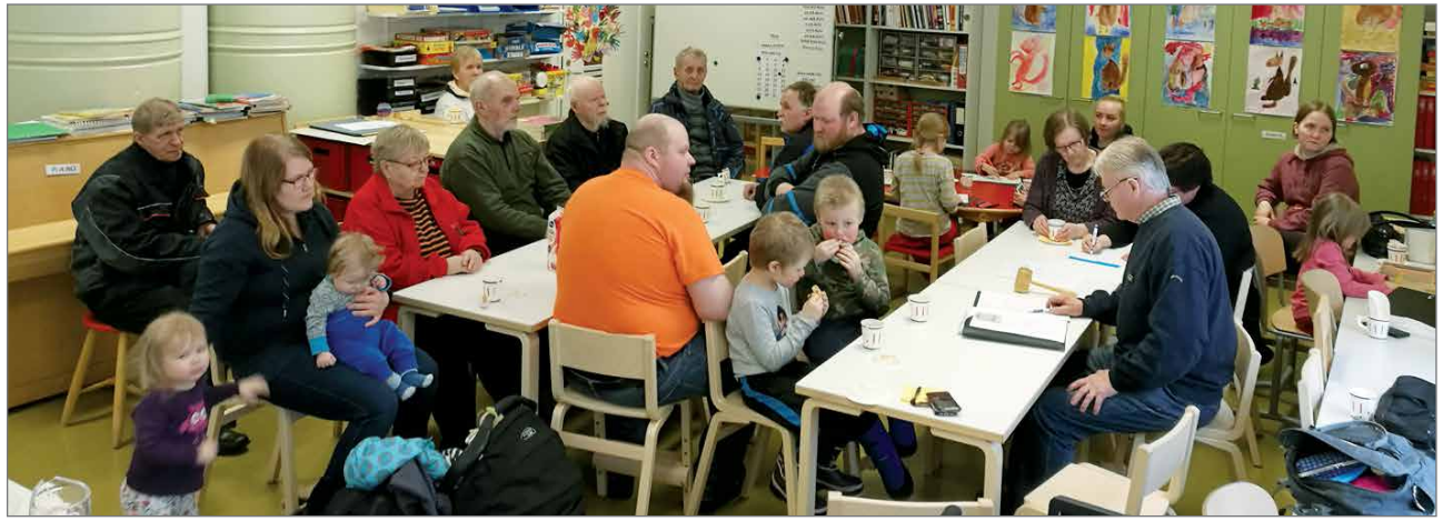
Kipinän kyläseuran vuosikokouksessa oli mukavasti väkeä koolla.