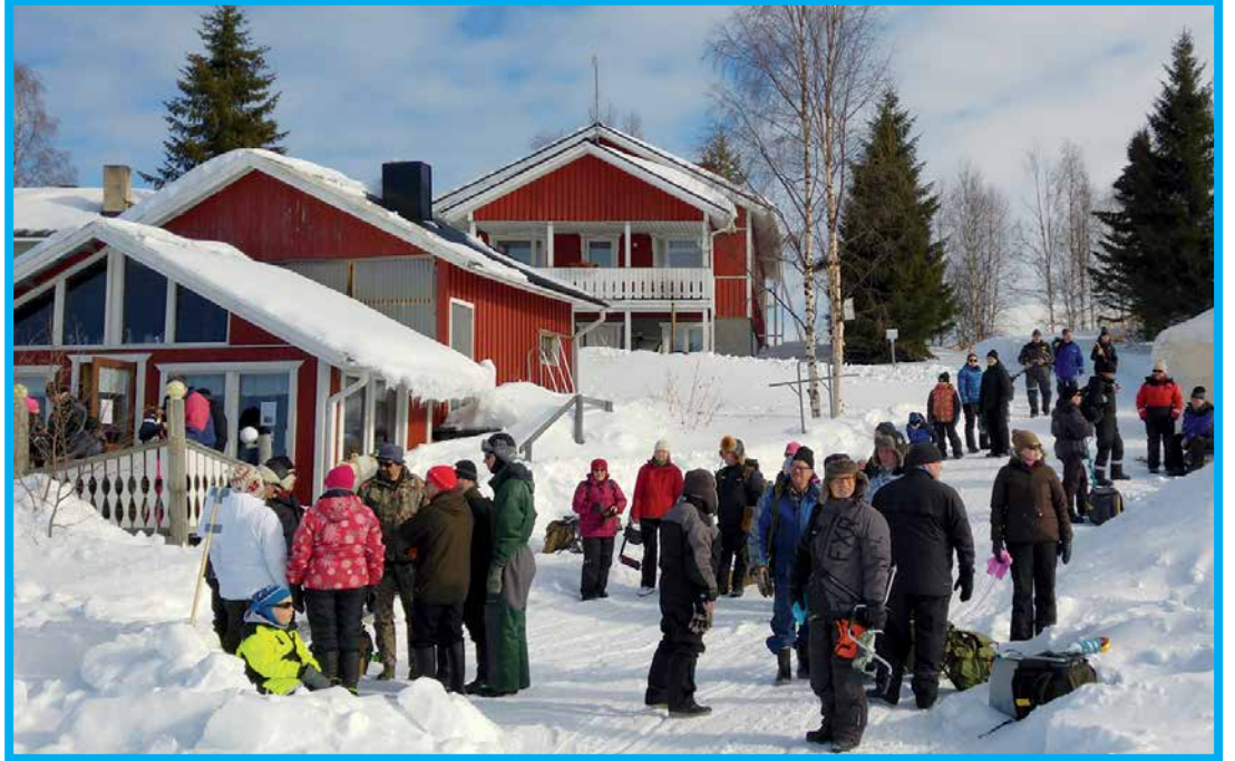
Pilkkikansaa saapuu paikalle.