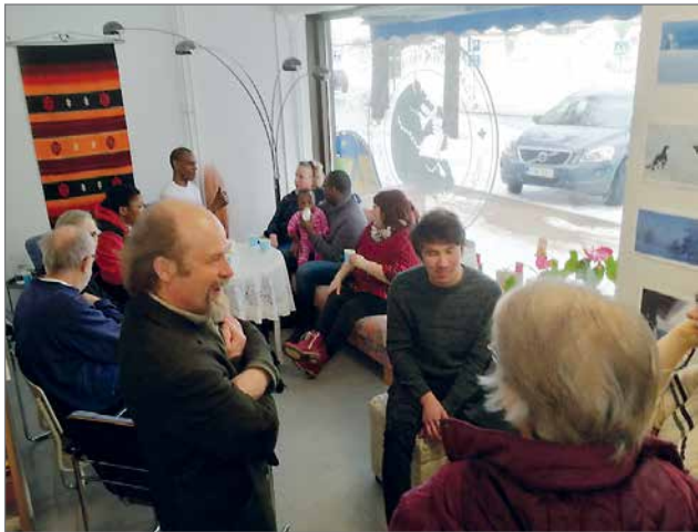
Elävät kirjat tapahtuman ajatuksena on tutustuttaa eri taustoista lähtöisin olevia ihmisiä toisiinsa.