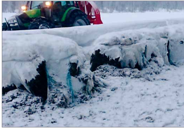
Hirviporukka tuhosi 40 pyöröpaaleja Jaurakkajärvellä maaliskuussa 2019.

Nyt on aika tarkistaa taimikot taimikonhoitotöiden ja hirvivahinkojen varalta. Vahinkojen korvausjärjestelmä uudistui vajaa 2 vuotta sitten. Silloin korvausperusteiden taso nousi noin kolmanneksen ja vahingon arviointiperusteisiin tuli korvaustasoa korottavia muutoksia. Esimerkiksi kuivahkon kankaalla luontaiset kuusentaimet eivät enää alenna korvauksia. Pienin maksettava vahingonkorvaus on 170 euroa. Korvattava vahinkoalue voi muodostua useammasta, vähintään 0,1 hehtaarin suuruisesta kuviosta ja va-