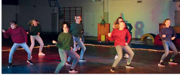
AK-Dance Oulusta hiphopin ja showjazzin harrastajia, Tennessee.