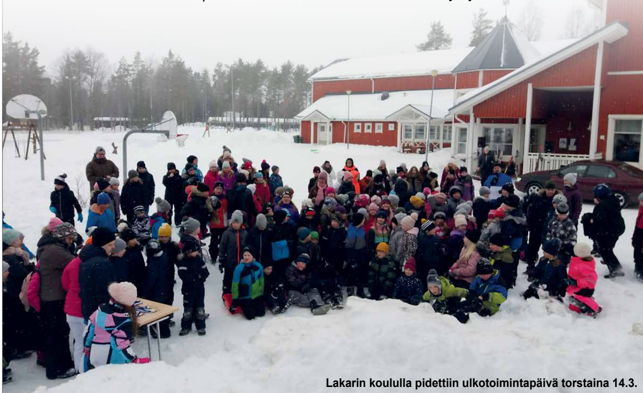
Lakarin koululla pidettiin ulkotoimintapäivä torstaina 14.3.