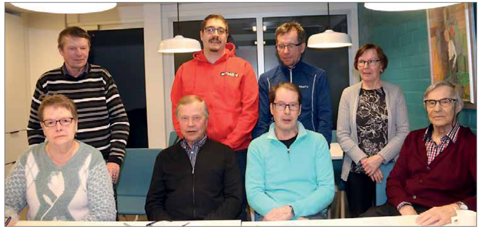
Pudasjärven Vasemmiston kevätkokouksessa otettiin kantaa ja keskusteltiin ajankohtaisista asioista monipuolisesti.

Vasemmiston arvoihin kuuluu sivistys ja sivistynyt käytös, ja tämä näkyy myös eduskuntatyössä asti. Vasemmiston edustajat eivät solvaa ihmisiä, toisin kuin populistisella politiikalla pinnalle nousseet edustajat. Pudasjärven vastaanottokeskusta ei pidä populistisen politiikan takia lopettaa. Maailman suurimpia muutostoimia on tällä hetkellä pelko. Pelolle löytyy monta kohdetta ja tästä johtuva syy-seuraus nousee