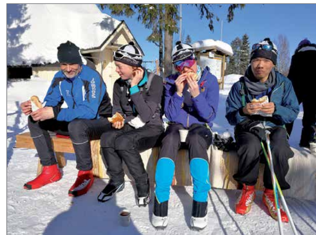
RR3-ryhmän hiihtäjiä Kantojärven huoltopisteellä viimeisenä hiihtopäivänä.