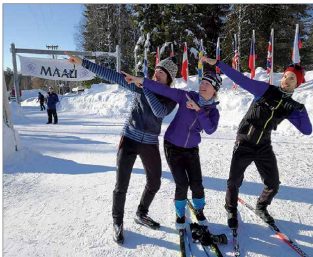
RR3-ryhmän hiihtäjiä onnellisena maalissa Karungissa.

Kaikki kuusi järjestävää kuntaa Kuusamo, Taivalkoski, Pudasjärvi, Ranua, Kemimaa ja Tornio esittäytyvät hiihtäjille erilaisine ympäristöineen ja palvelui-