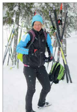
Sukset pois ja tauolle.