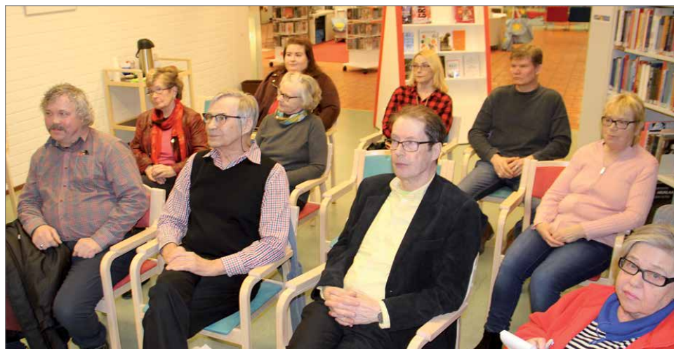
Yleisö osallistui vilkkaasti keskusteluun.