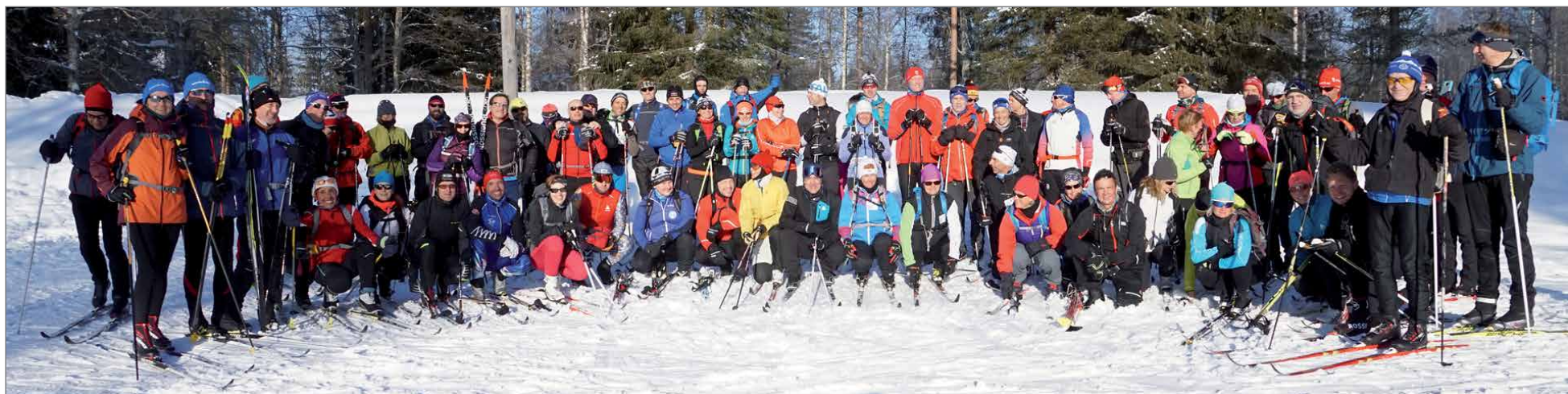
RR4-ryhmäkuva aurinkoisessa säässä Ranualla.