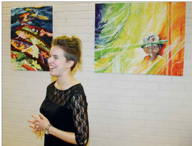
Taiteilija esittelemässä teoksiaan Arvoitus ja Ääretön.

Taidenäyttelyn työt ovat myytävänä. Hinnat vaihtelevat käytetyistä materiaaleista, työtunneista ja vuosimal-lista riippuen 90-290 euron välillä. HT