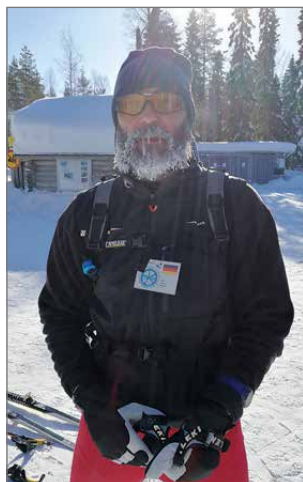
Välillä hiihrettiin kipakassa pakkassäässä.

Mukana oli noin 260 hiihtäjää 18 maasta. Suomalaisia oli hiihtämässä vajaa 50. Reitti kulki Venäjän rajalta pääosin tutuissa ja vaihtelevissa maastossa kohti Ruotsin rajaa. Muutamia muu-