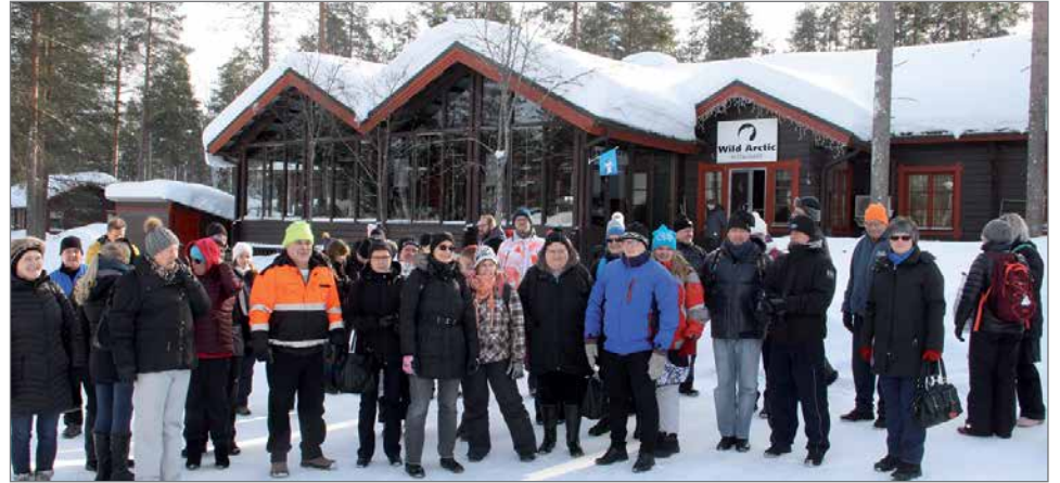
Ranuan eläinpuistossa kierrokselle lähdettiin kahdessa ryhmässä ja nähtiin muun muassa yleisön suosikiksi noussut jääkarhun poikanen Sisu yhdessä äitikarhu-Venuksen hoivissa.

Palkkatuettu työ mahdollistaa tietojen ja taitojen päivittämisen sekä osaamisen osoittamisen työelämässä heille, joilla on vaikeuksia päästä avoimille työmarkkinoille, erilaisten työtehtävien kokeilun, työnantajan tutustumisen työntekijään ja päinvastoin sekä ehkäisee syrjäytymistä ja huomioidaan työntekijöiden terveydelliset seikat. Valitettavana koettiin palkkatuen mahdollistavan joissakin tapauksissa jatkuvan työn tar-