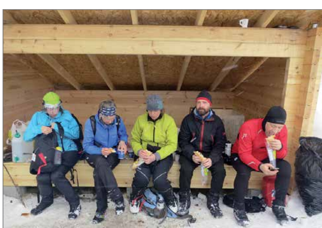
Uudella Ylimmäisen Pirinlammen laavulla ruokatauolla.