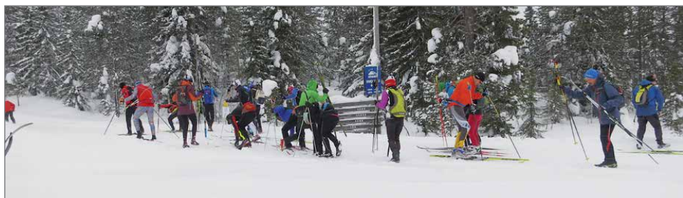
RR ryhmän startti Pikkusyötteeltä kohti Ranuaa - matkaa 86 km.